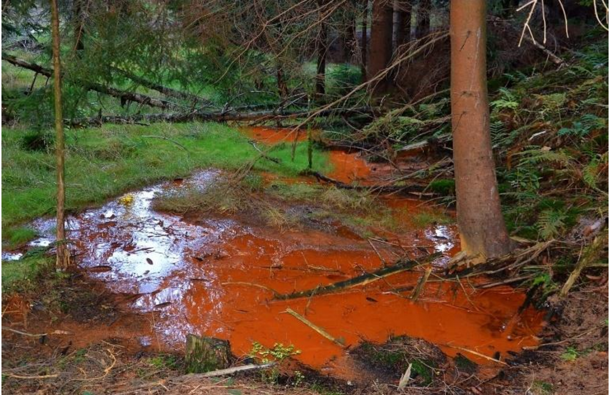
Obr. č. 1: Znečištění životního prostředí důlní činností [11]

Na obrázku č. 1 lze vidět vývěr důlní vody z dolu sv. Anny, po jehož důlní činnosti se do dnešní doby zachovalo velké množství hald, zářezů a šachet. Voda ze štoly odtéká do potůčku Krahbachu, který se vlévá do řeky Svatavy [11].