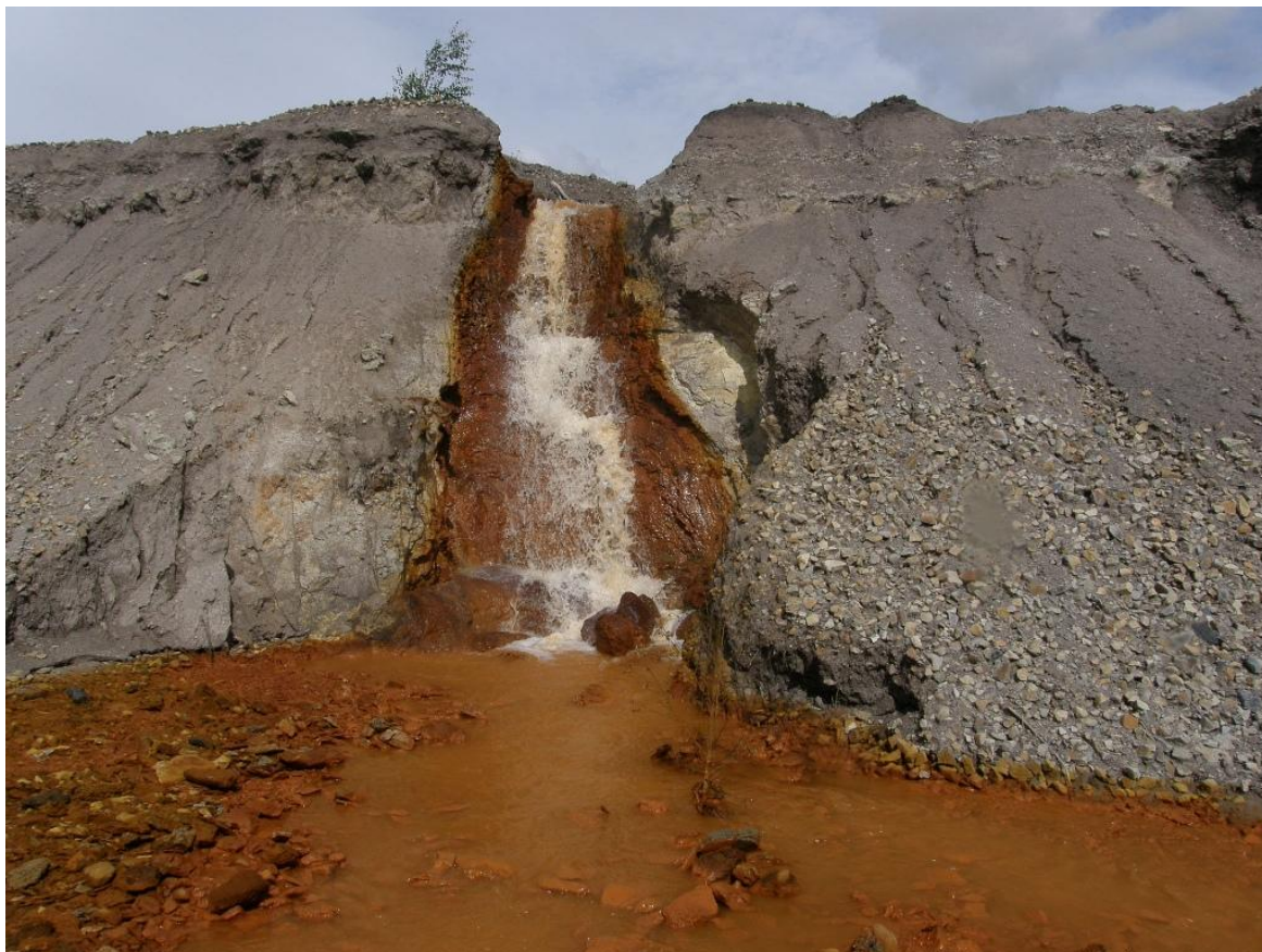
Obr. č. 2: Odtok důlních vod znečišťující vodní ekosystém [29]

Základním nástrojem ekotoxikologické práce jsou testy toxicity sloužící k zjištění nebo odhadu možného toxického vlivu testovaných látek či směsných vzorků na živé organismy a obecněji rovině na životní prostředí. Test toxicity je experimentální metoda, pomocí které hledáme odpověď organismu na expozici toxickou látkou. Z hlediska praktické aplikace se dělí do dvou skupin: 1) testy toxicity cílené na odhad možných toxických účinků na člověka 2) testy toxicity, od kterých očekáváme informace na možné nepříznivé účinky látek a jejich směsí na životní prostředí