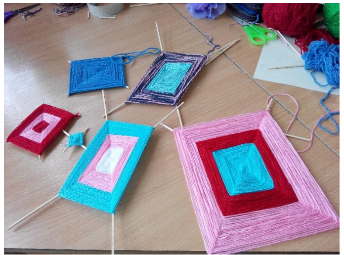
Práce s vlnou – rozvoj jemné motoriky