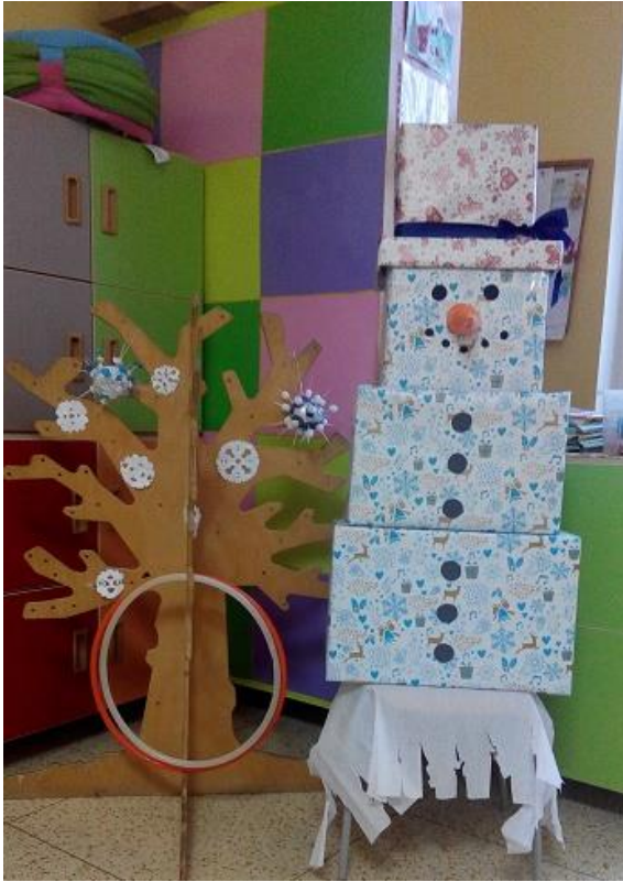
Prostorová tvorba – sněhulák

Ukázky rukodělných činností žáků 1. stupně ZŠ