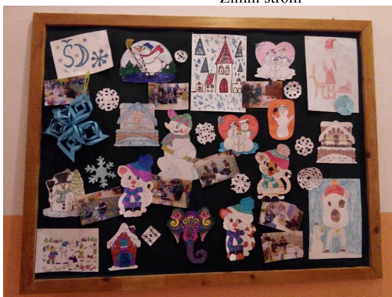
Zima – vystřihovánky