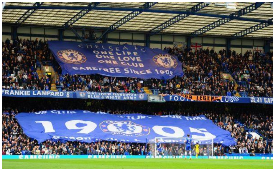
Obrázek 2 Příklad rozvinuté vlajky na anglických stadionech 21

soutěžích. Choreografie se taktéž na anglických stadionech nacházejí zřídka, většinou jde o velké vlajky, které mají tradici již několik let a jsou rozvinuty nad návštěvníky kotle. Pokud se bavíme o choreografiích, které známe z jiných evropských stadionů, tak ty se objevují spíše při rozloučení s klubovými legendami nebo při jiných významných událostech klubu.