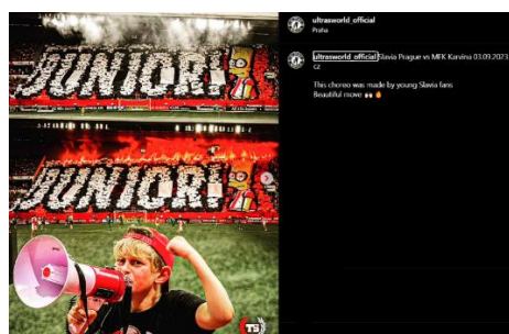
Obrázek 10 Choreografie vytvořená dětmi na Tribuně Sever 72

Často se můžeme setkat s frázemi, že „stadiony nejsou bezpečné pro rodiny s dětmi“, „tohle by se v Anglii či na západě nestalo“ apod. Já osobně si stojím za názorem a z rozhovoru, který jsem provedl s SLO Slavie Praha Martinem Bendou, si za ním stojí i on, že tyhle fráze nejsou pravdivé a tuzemské prostředí na stadionech je naprosto bezpečné. Ostatně to dokazují i aktivity např. pražské Slavie či Sparty, kteří aktuálně vyprodávají domácí zápasy jako na běžícím páse, v případě Sparty jde o dlouhodobě silnou marketingovou pozici, v případě Slavie jde o předzápasové programy, kdy se v okolí stadionu pořádají tzv. fanzóny pro fanoušky. V těchto fanzónách můžeme najít různé druhy občerstvení, aktivit spojených s klubovými legendami či hráči nebo aktivity pro nejmenší. Poslední touto aktivitou je choreoškola pod záštitou Slavie a fanouškovské organizace Tribuna Sever, kteří dali šanci nahlédnout nejmenším fanouškům, jak se vytváří choreografie. Děti měly možnost namalovat plachtu s Bartem Simpsonem, roznést kartóny za sedačky, vyzkoušet si bubnování či rozezpívání pomocí megafonu. Následně měli během zápasu SK Slavia Praha – MFK Karviná 70 svůj vlastní kotel v krajní části tribuny sever. Tato akce se dočkala skvělých ohlasů a prezentovaná choreografie, včetně kontextu, že za touto choreografií stojí děti, obletěla téměř všechny mezinárodní fanouškovské stránky po sociálních sítích. 71