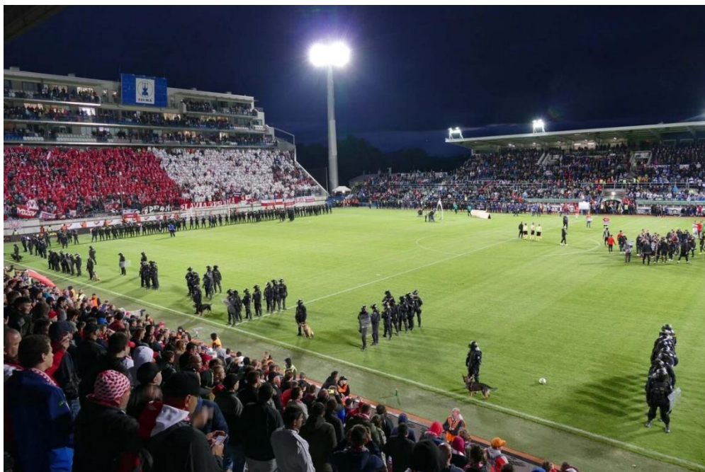
Obrázek 9 Policejní manévry při finále poháru v Olomouci 50

Ze své zkušenosti mohu potvrdit např. při finálovém utkání poháru MOL Cup, konaného v Olomouci mezi celky FC Baník Ostrava a SK Slavia Praha, došlo během závěrečných minut utkání k obklopení hřiště policisty ze speciální pořádkové jednotky a psovodů z obav vniknutí fanoušků na hrací plochu. Závěr utkání se dohrával s obklopeným hřištěm policisty, dokonce i hráči vítězné Slavie následně slavili s policisty a psovody na hrací ploše. Důležité je také zmínit, že náš sektor byl vyvýšený a nikdo se ani nepokusil v průběhu utkání na hrací plochu vniknout.