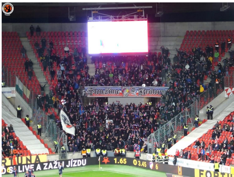
Obrázek 6 Sundaný přední plot v sektoru hostí 31