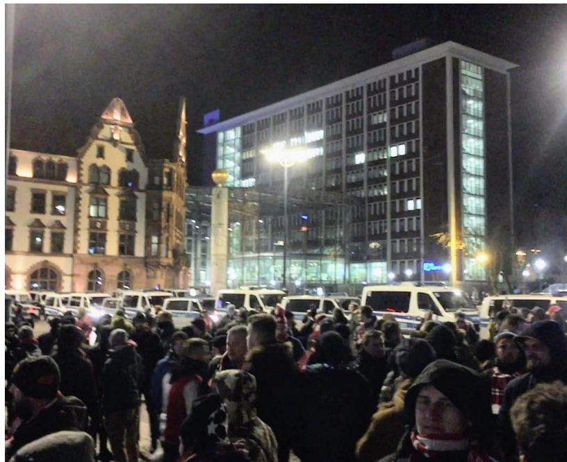
Obrázek 3 Sraz fanoušků Slavie na náměstí v Dortmundu 28

Není to pouze o počtech, je to také o chování některých policistů. Jednou z mých negativních zkušeností s Policií ČR ve vztahu k fanouškům, je návštěva hostujícího sektoru v Brně, kdy fanoušci byli natáčeni s občanským průkazem vedle obličeje příslušníkem Policie ČR. Jeden z fanoušků se zeptal na základě, jakého paragrafu a zákona a z jakého důvodu jsme natáčeni, odpovědí mu bylo: „drž hubu nebo sem nejezdí“. I tohle můžete slyšet od příslušníka Policie ČR.