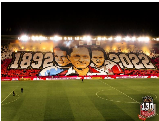
Obrázek 1 Choreografie Tribuny Sever 2

Hlavní činností této skupiny mimo fandění je tvorba choreografií, ať už ve formě kartoniád , kdy dochází ke zvedání různých kartónů, které po zdvihnutí vytvoří obrazec, nebo rozvinutí plachet nad návštěvníky tribuny. Tyto přípravy zabírají spoustu času, ať už jde o samotnou přípravu kartónů či jejich upevnění k sedačkám tak, aby tvořily výsledný obrazec, nebo malba plachet, často přes celou tribunu. Mezi fanouškovskými tábory napříč celou ČR, ale i ve světě probíhají neoficiální soutěže o lepší, komplexnější či složitější provedení choreografie. Na následujícím obrázku můžeme vidět propojení právě plachty, kartoniády a použití pyrotechniky, která byla použita ještě před začátkem utkání, aby nedošlo k přerušení probíhajícího utkání. Jde o druhou největší choreografii v historii Tribuny Sever. Byla uskutečněna k výročí 130 let klubu, kdy choreografie měřila 88 metrů na délku a 28 metrů na šířku.