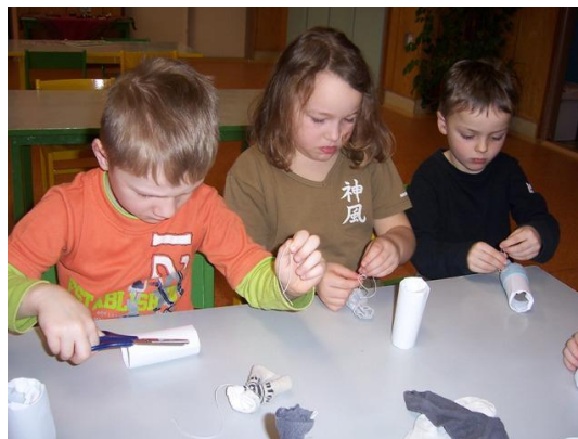
(balení, lepení, stříhání – výroba sněhuláka)