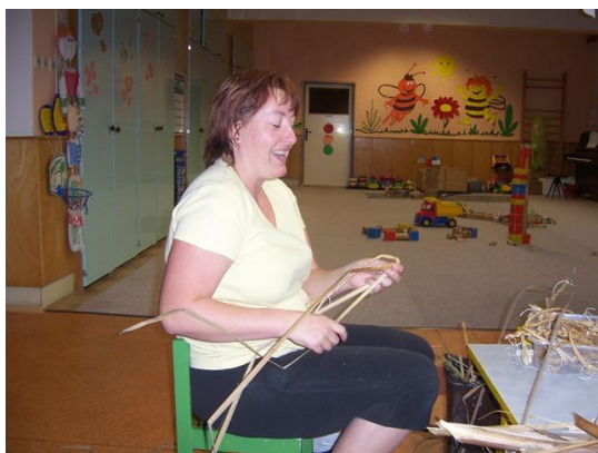
(pletení copánků z orobince)