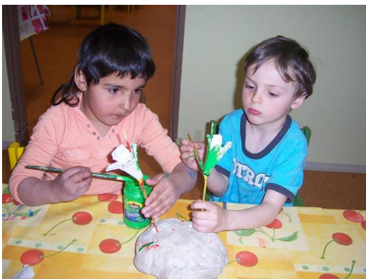
(malování rozstříhaných plát od vajíček)