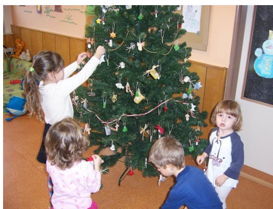
(zdobení vánočního stroměčku)