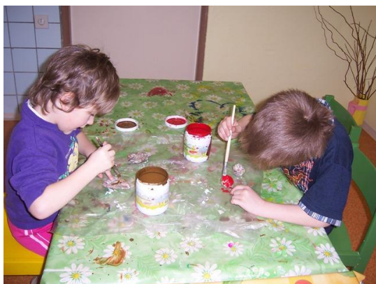
(barvení tuží detailů masek)