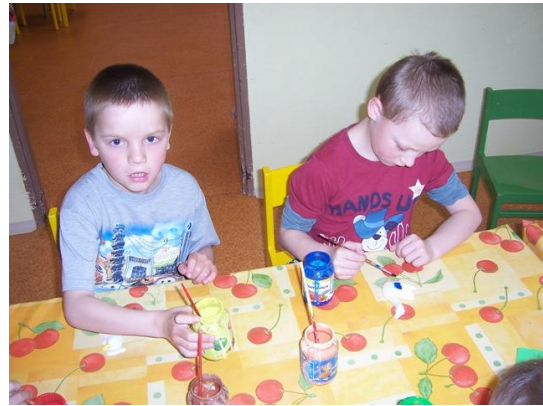
(malování sádrových odlitků, plat od vajec)