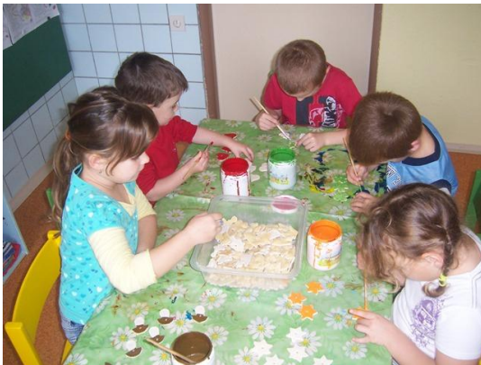
(zdobení tuží upečených výrobků)