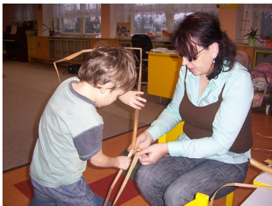
(pletení copánků z orobince)