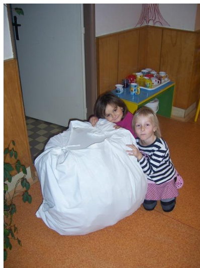
(spodní koule sněhuláka)