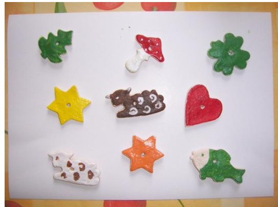
(hotové výrobky k zavěšení na vánoční stromeček)