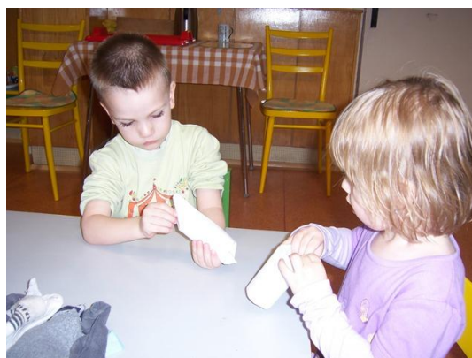
(balení papírové ruličky do bílého papíru)