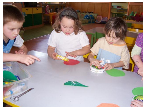
(lepení papíru na krabičku)