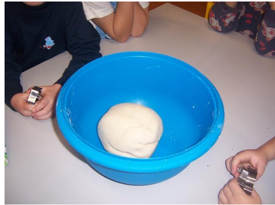
(připravené slané těsto)