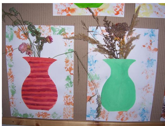
(vázy s přírodninami)