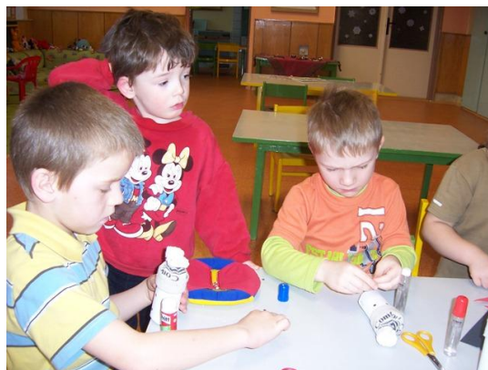
(balení, lepení, stříhání – výroba sněhuláka)