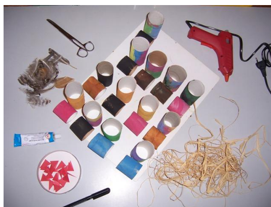
(potřebný materiál k dokončení ptáčků)