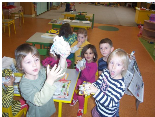
(mačkání novinového papíru)