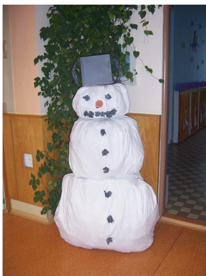
(sněhulák před dokončením)