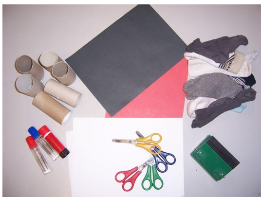
(materiál, který budeme potřebovat)