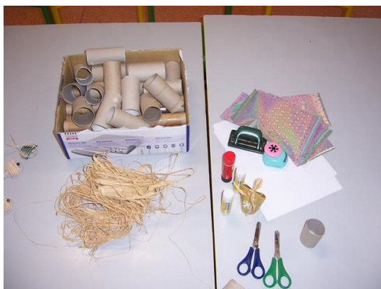
(materiál, který budeme potřebovat)