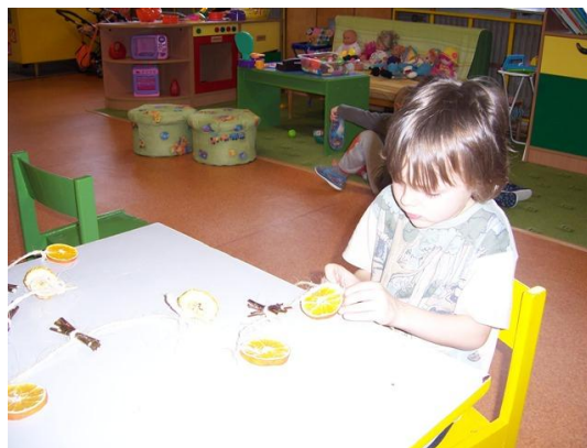
(vázání přírodnin na provázek)