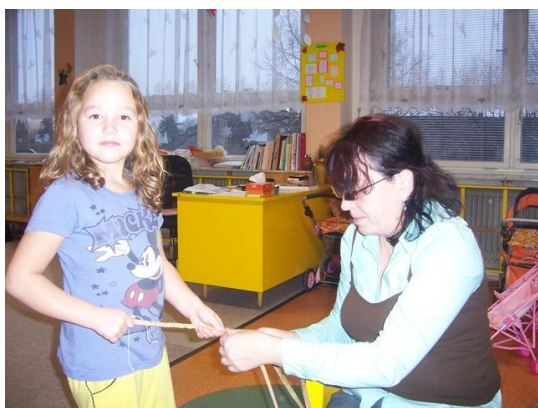
(pletení copánků z orobince)