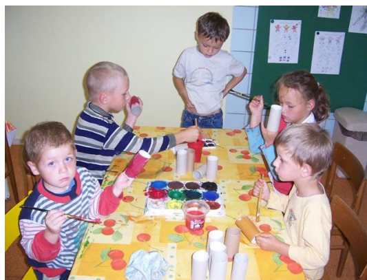
(malování papírových ruliček vodovými barvami)