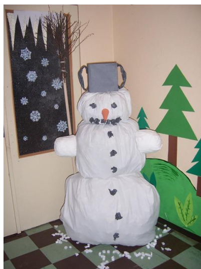
(sněhulák – výzdoba MŠ)