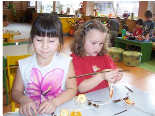
(vázání přírodnin na provázek)