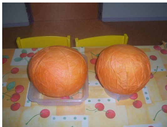
(suché dýně , připravené k dokončení)