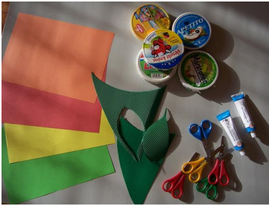
(materiál, který budeme potřebovat)