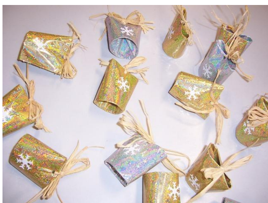
(hotové výrobky připravené k zavěšení)