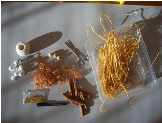
(materiál, který budeme potřebovat)