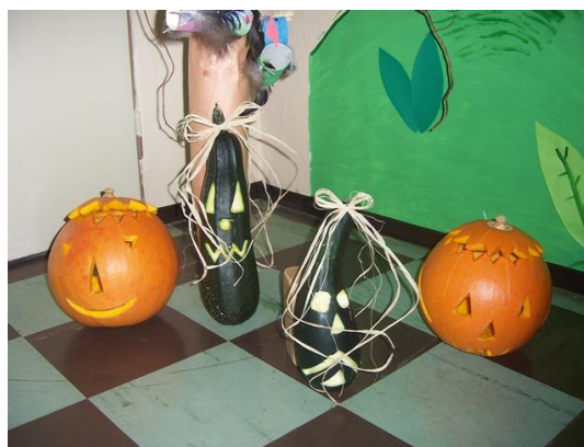
(dekorace z čerstvých dýní a cuket)