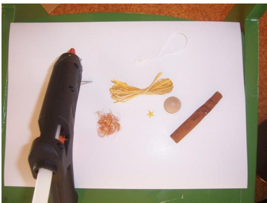
(potřebný materiál na jednoho andílka)