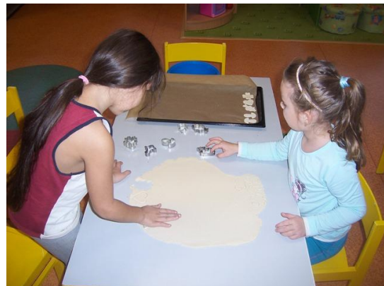
(vykrajování pomocí formiček)