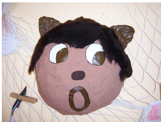
(hotová maska medvěda)