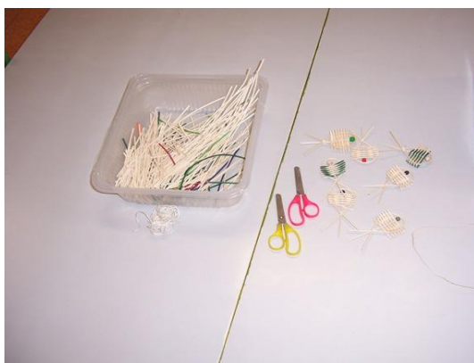
(materiál, který budeme potřebovat)