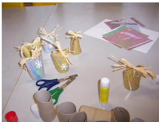
(nedokončené i dokončené výrobky)