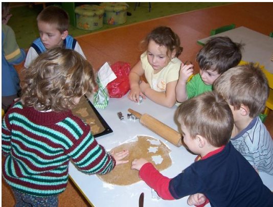
(vykrajování pomocí formiček)