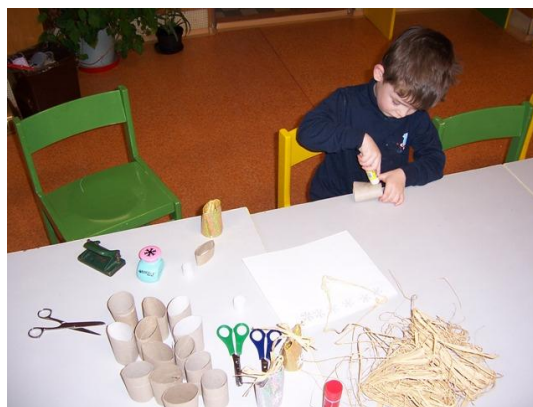
(práce s materiálem, lepení)