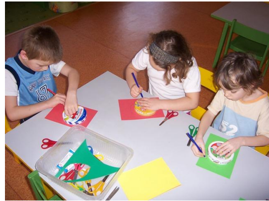
(obkreslování krabičky od sýrů)