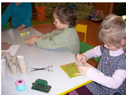
(práce s materiálem, lepení, balení)