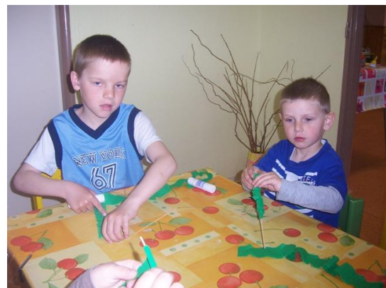
(namotávání krepeového papíru na špejli)