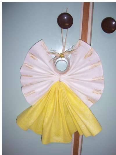
(hotoví andílci, připraveni k zavěšení)