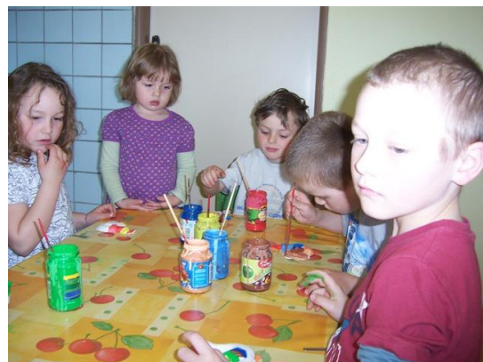
(malování sádrových odlitků)