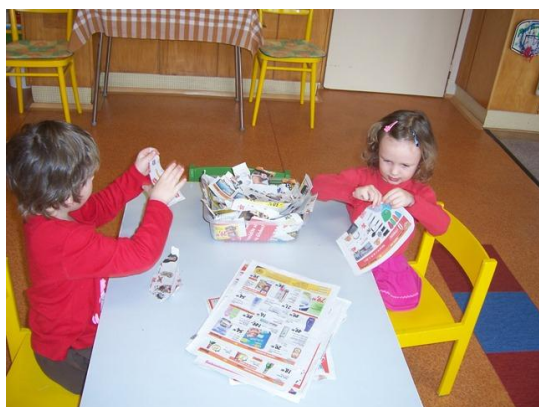
(trhání novin na proužky)