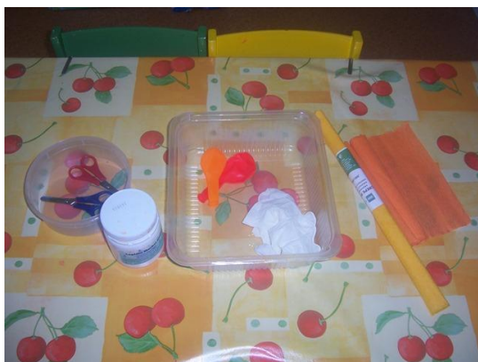
(materiál, který budeme potřebovat)