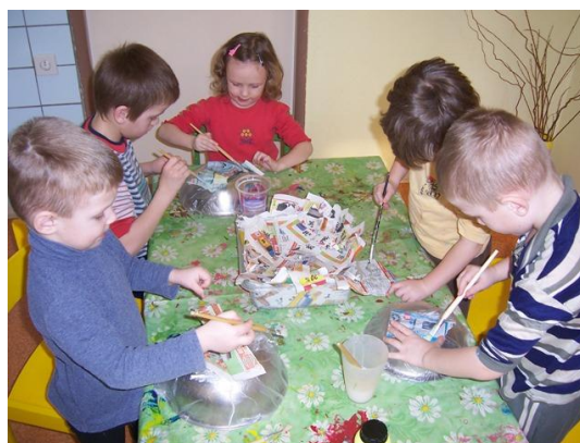
(natírání novin lepidlem, vrstvení)