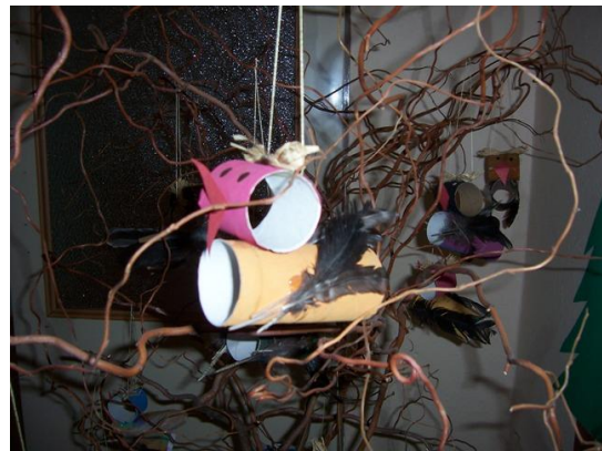
(výstava ptáčků – dekorace MŠ)