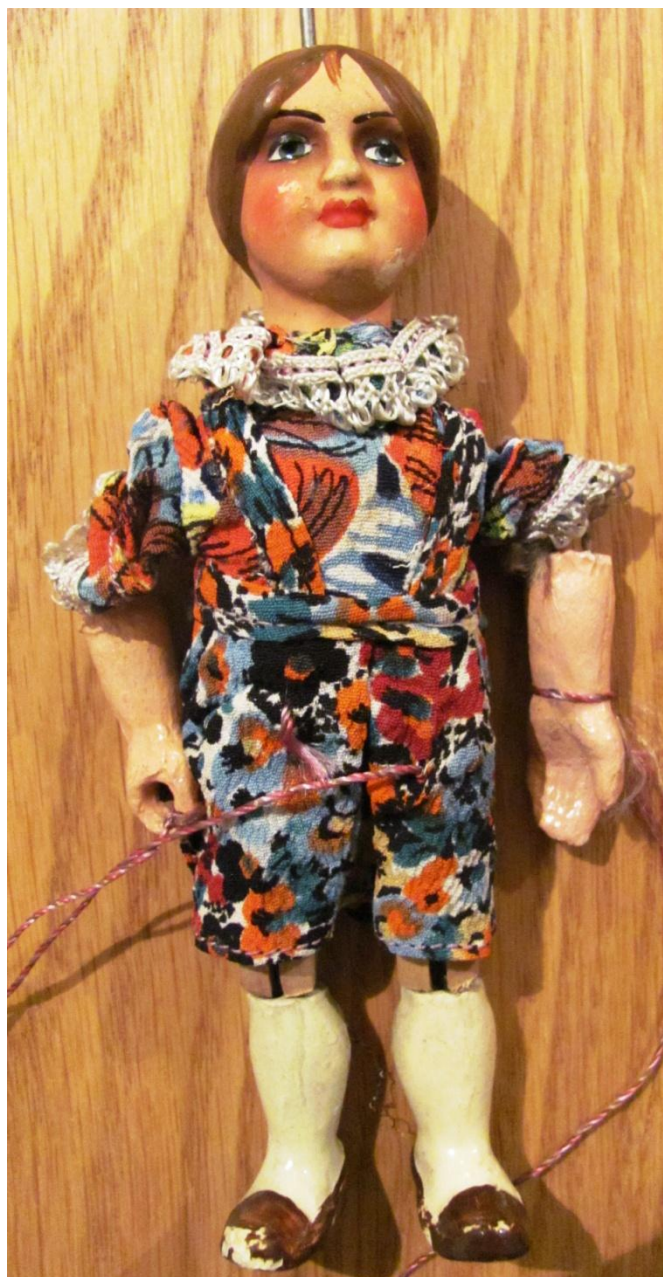
Alšovka, postava dítěte