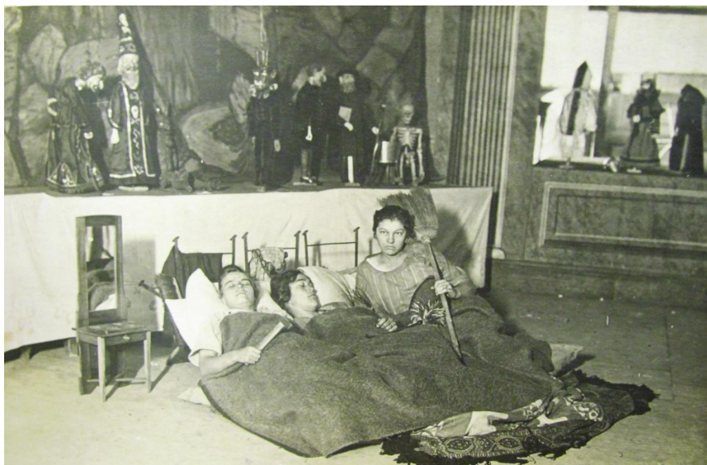
Členové hejčínského loutkářského souboru hlídají výstavu (tamtéž)