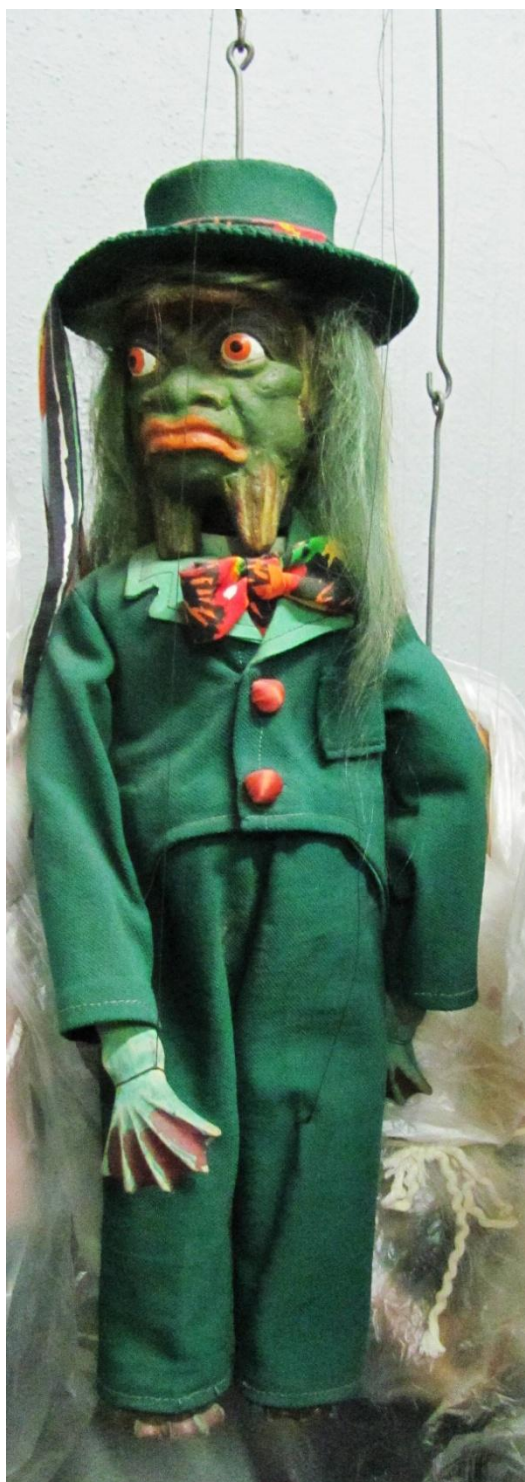
Postava vodníka, původní marioneta z 20. let 20. století (tamtéž)