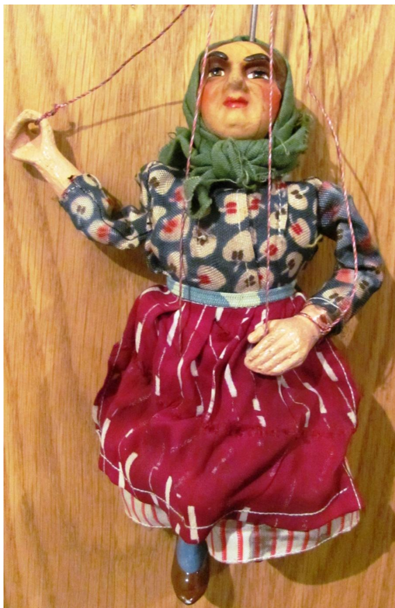
Alšovka, postava venkovanky