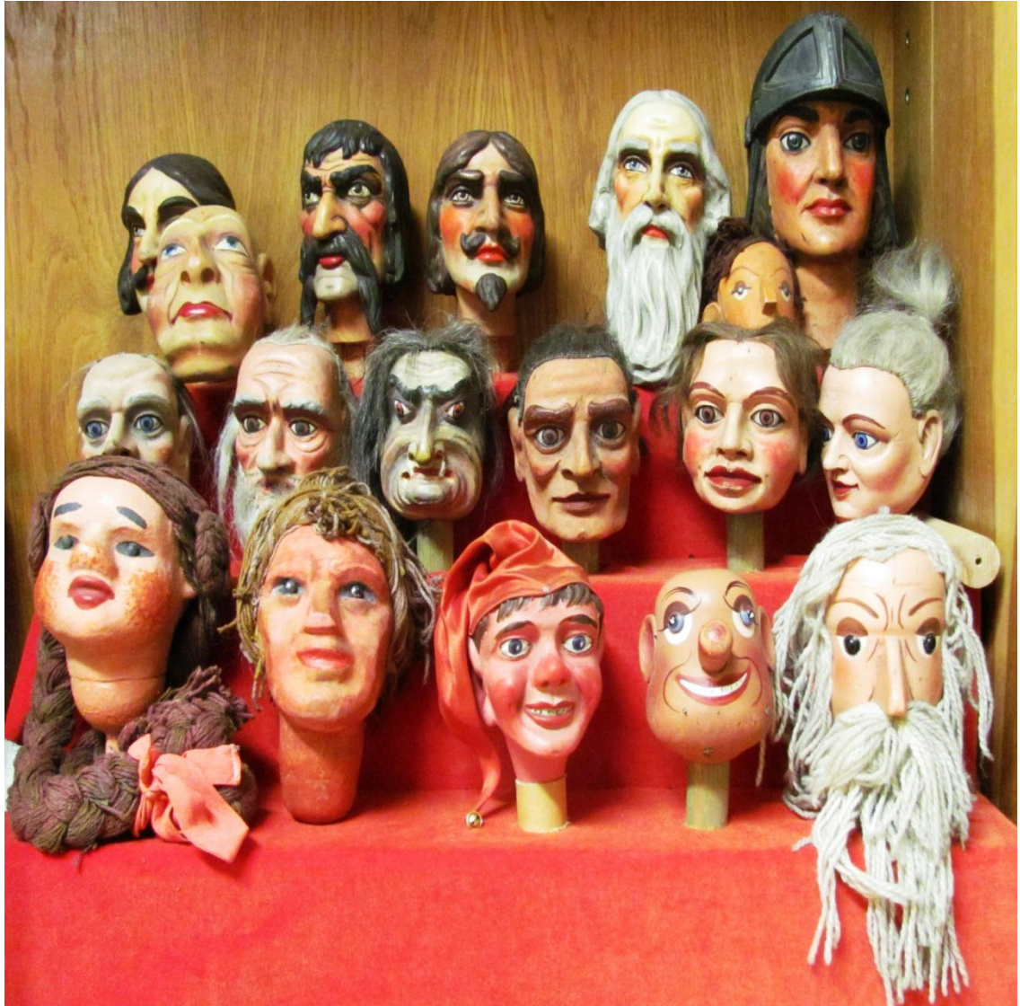
Výměnné hlavy k loutkám, pocházející z 20. let 20. století