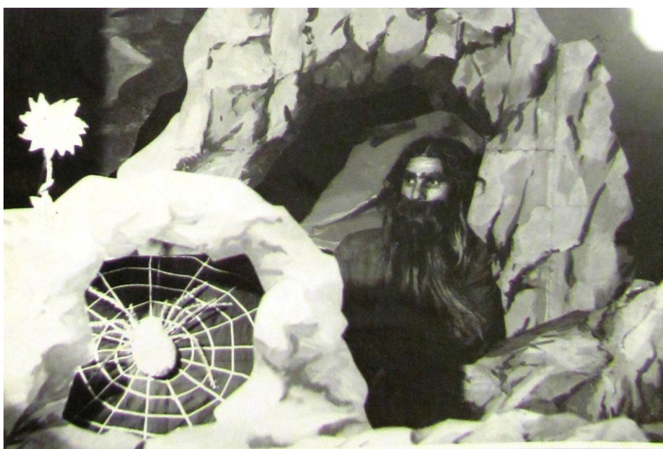
Scéna se živou loutkou z představení Stříbrný pavouk, premiéra 4. 12. 1938 (tamtéž)