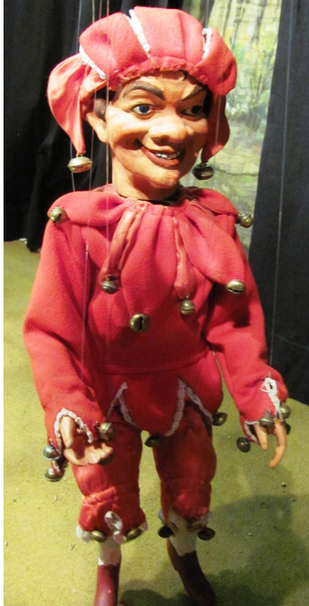
Postava Kašpárka, původní marioneta z 20. let 20. století (tamtéž)