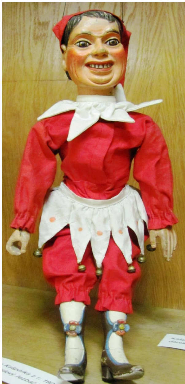
Loutka původního Kašpárka z 20. let 20. století, řezbovaná lidovým marionetářem Václavem Finkem