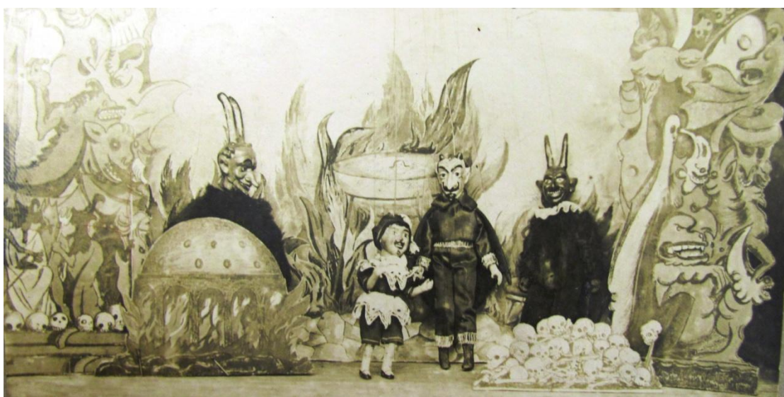
Peklo, scéna ze zahajovacího představení Doktor Faust souboru Národní jednoty v Hejčíně, Alšovy loutky (tamtéž)