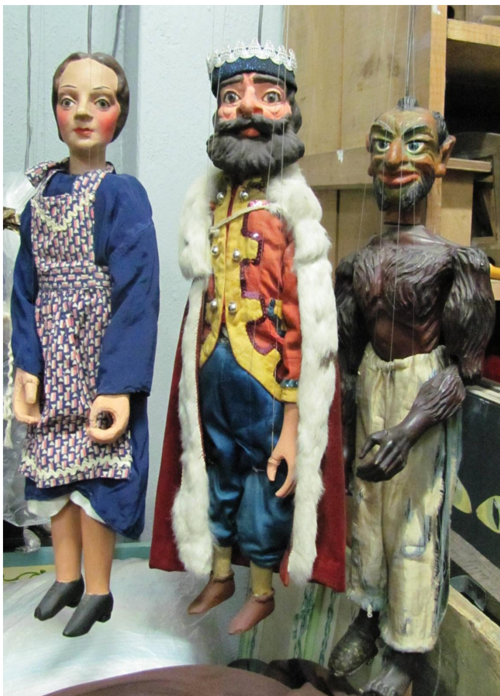
Postava selky, krále a čerta, původní marionety z 20. let 20. století (tamtéž)