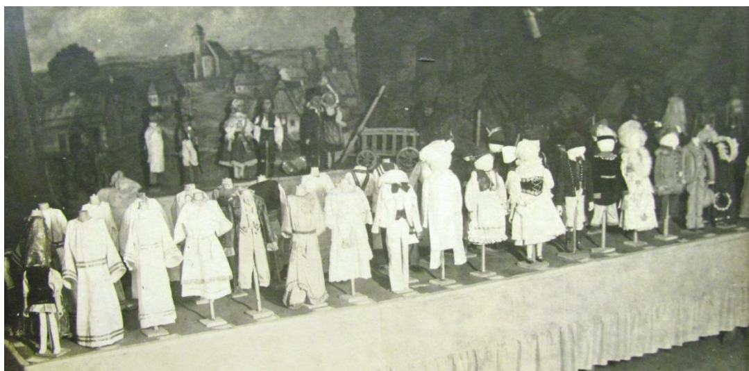
Kostýmy loutek, hejčínská výstava