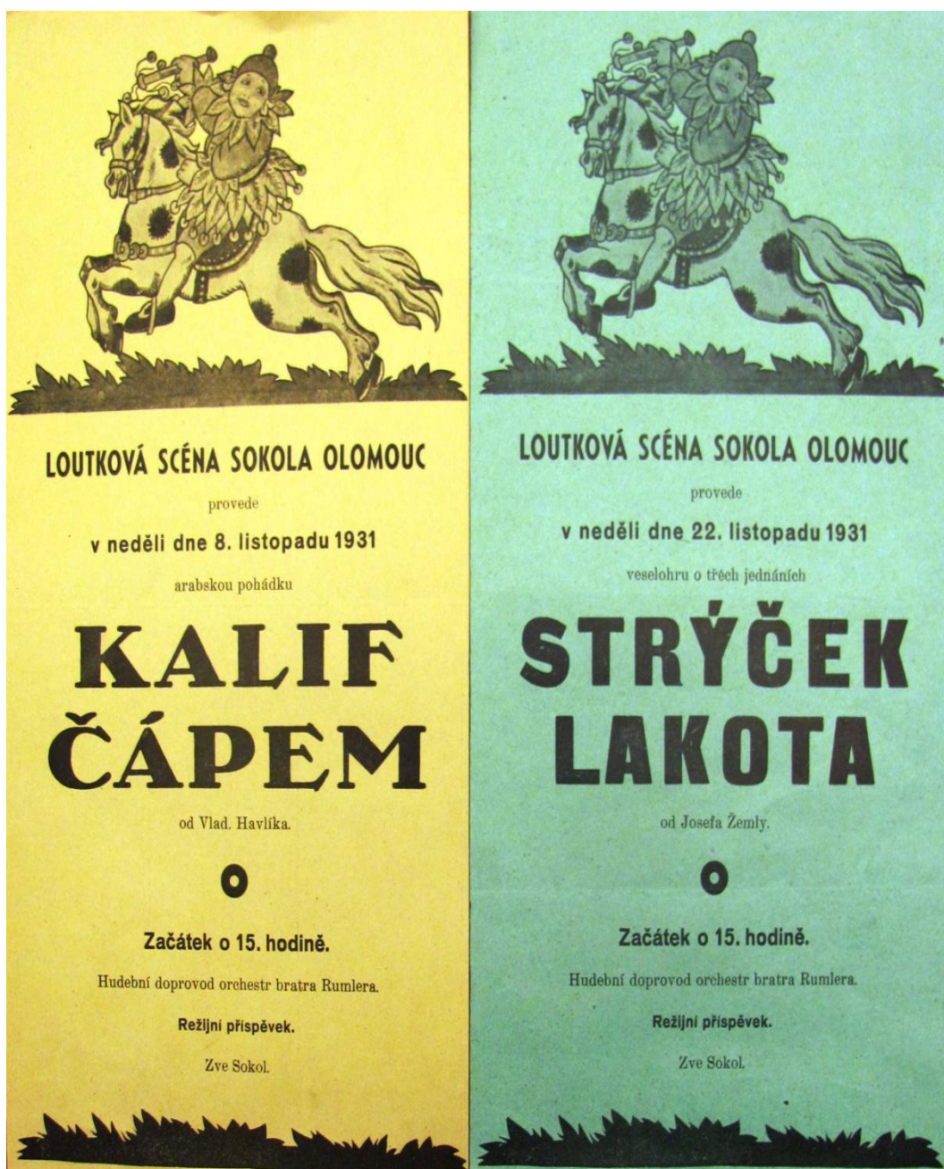
Plakáty k představením sokolského loutkového divadla jednoty Olomouc z listopadu 1931 (Fond Tělocvičná jednota Sokol Olomouc, SOkA Olomouc, zn. M6-50, kart. 15)