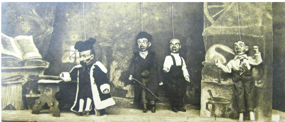
Faustova studovna, scéna ze zahajovacího představení Doktor Faust, premiéra 4. 1. 1920 (fotografie převzatá z kroniky Kašpárkovy říše, uložena v archivu)