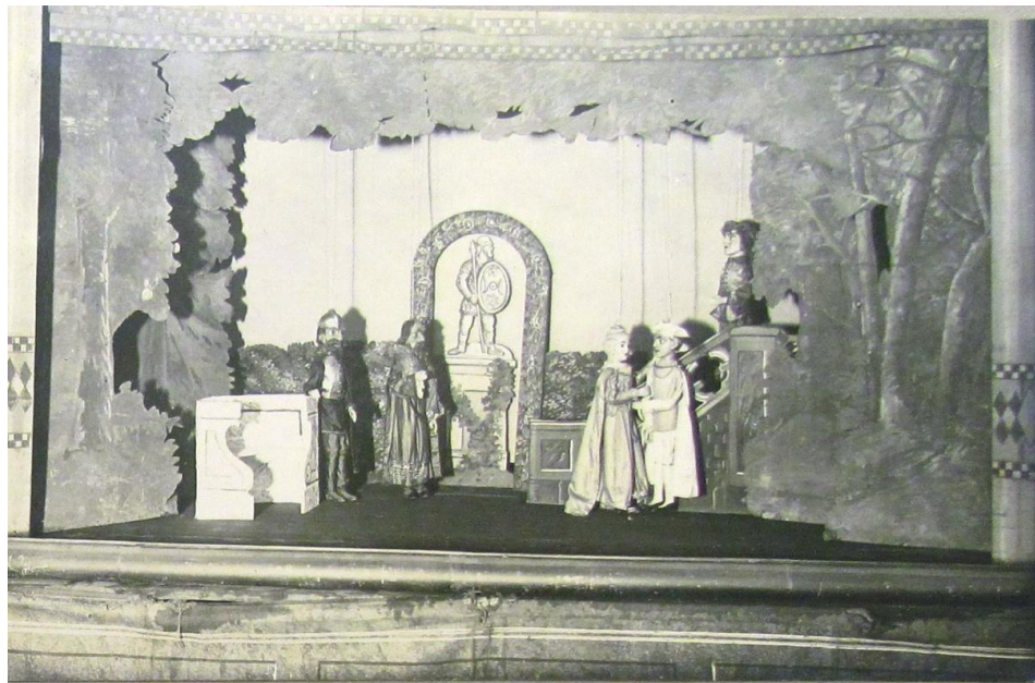
Scéna z představení Bruncvík, kníže české, premiéra 25. 4. 1926 (tamtéž)