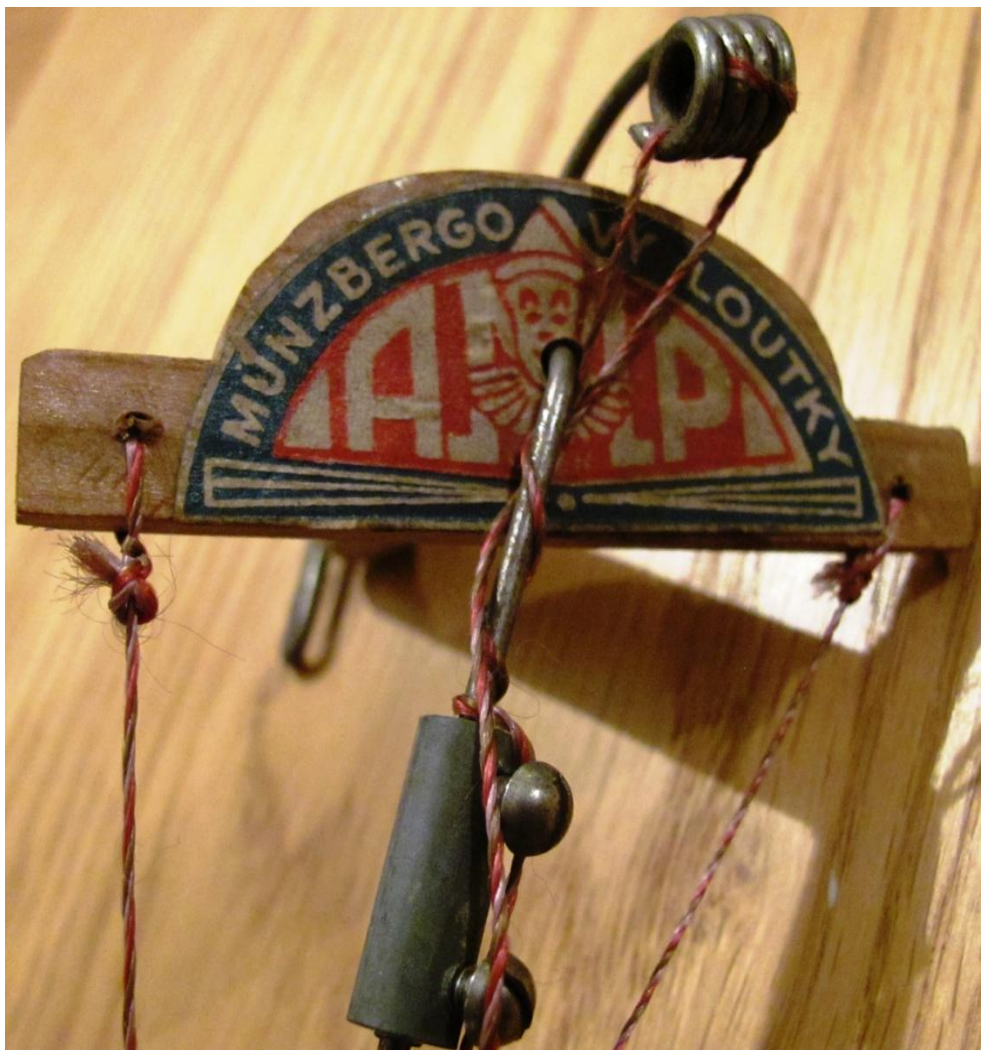
Vahadlo alšovek s Münzbergovou firemní nálepkou