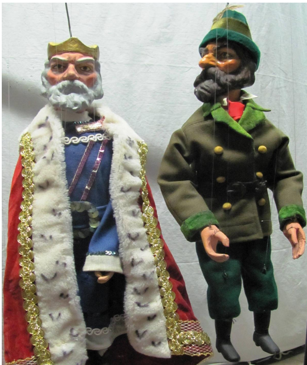
Postava krále a myslivce, původní marionety z 20. let 20. století (Loutkové divadlo Chválkovice-Olomouc)