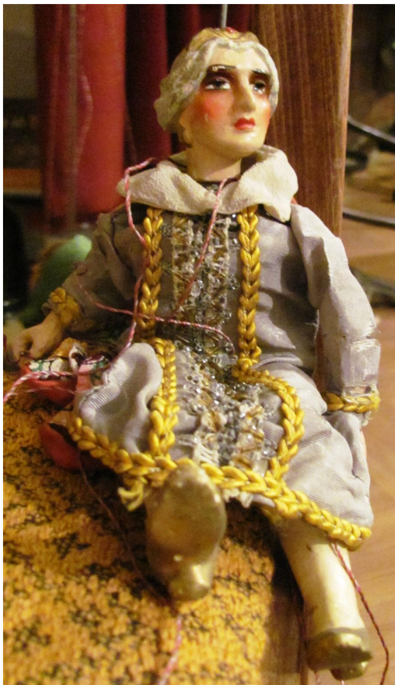
Alšovka, postava šlechtice (archiv Husova sboru, fotografie autorky)