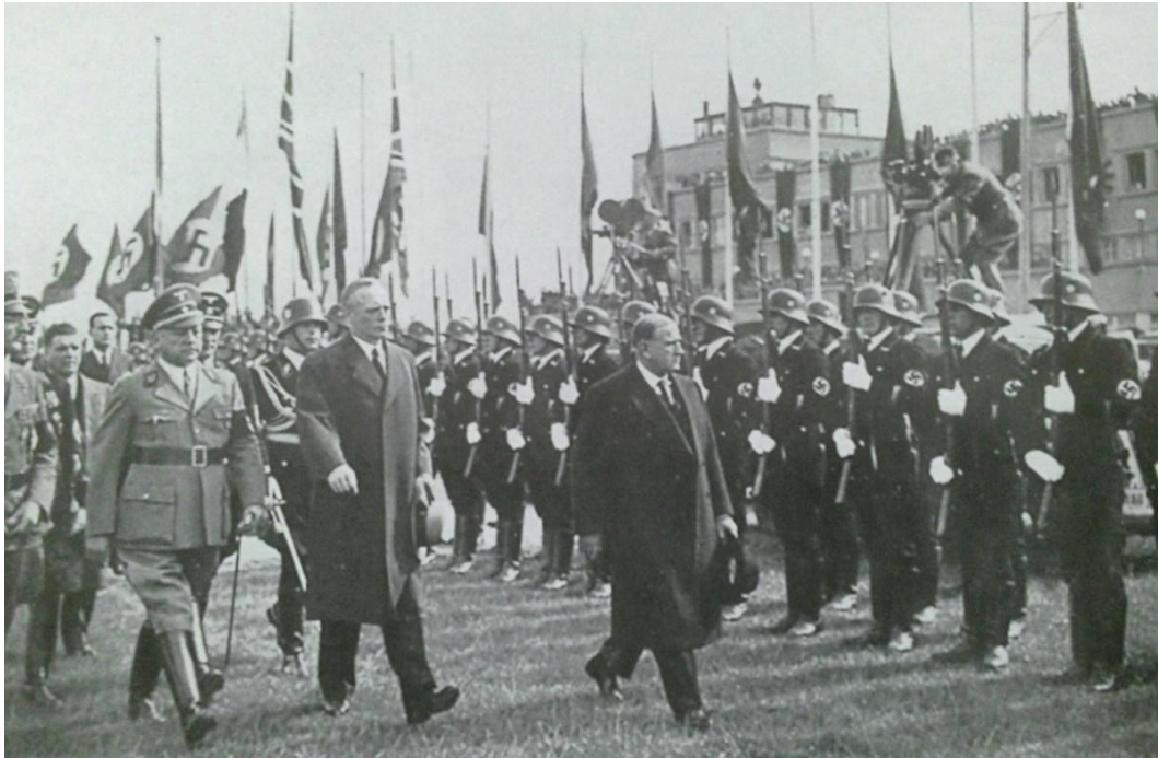
Obrázek č. 3: Francouzský ministerský předseda É. Daladier na mnichovském letišti.