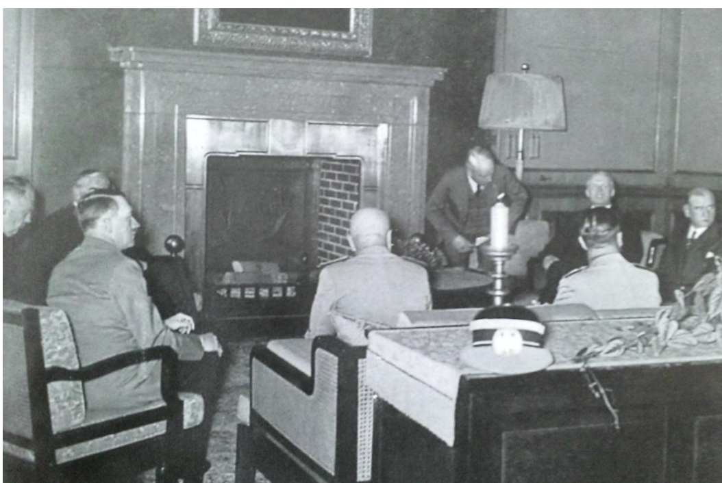
Obrázek č. 6: Představitelé čtyř velmocí během schůze.