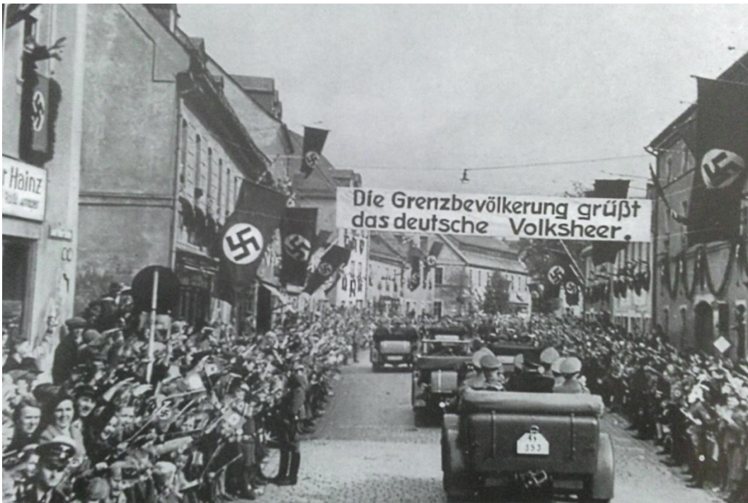
Obrázek č. 8: Vítání německých jednotek v Sudetech.