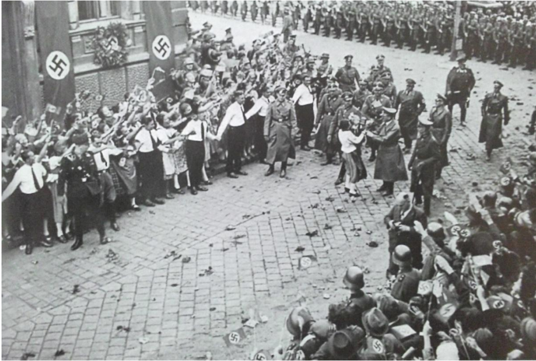
Obrázek č. 9: Hitler prochází Chebem za fašistického pozdravu „Sieg Heil“ od sudetských obyvatel.