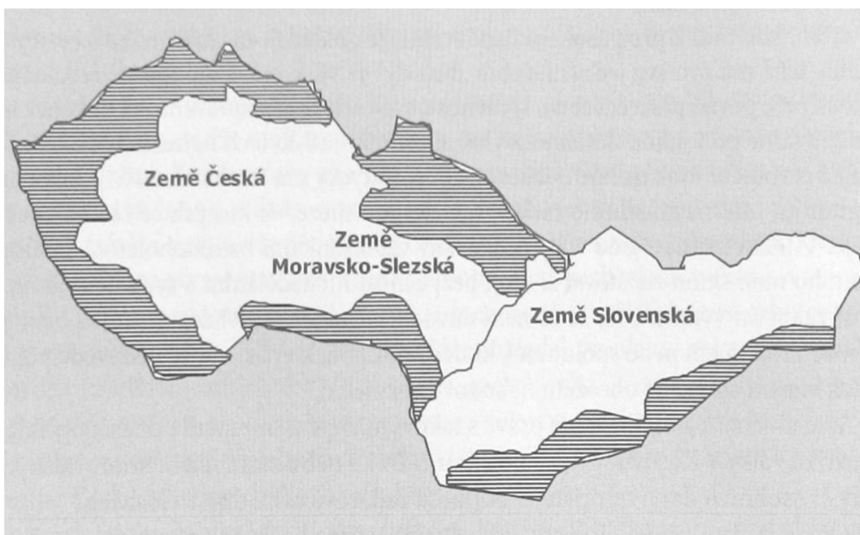
Mapa č. 1: ČSR po Mnichovské dohodě.