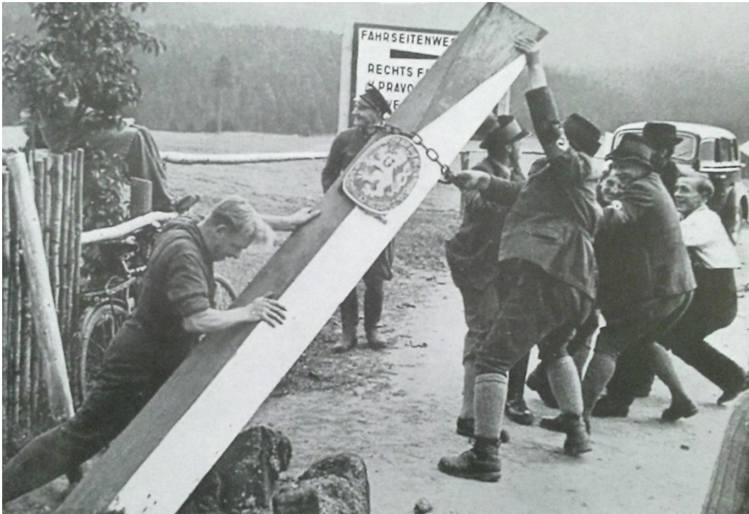
Obrázek č. 7: Obyvatelé Sudet shazují hraniční přechod.