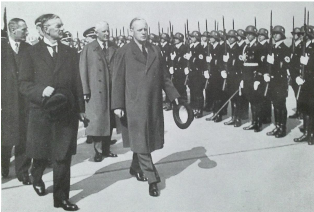
Obrázek č. 4: Britský ministerský předseda N. Chamberlain a německý ministr zahraničí J. von Ribbentrop na mnichovském letišti.