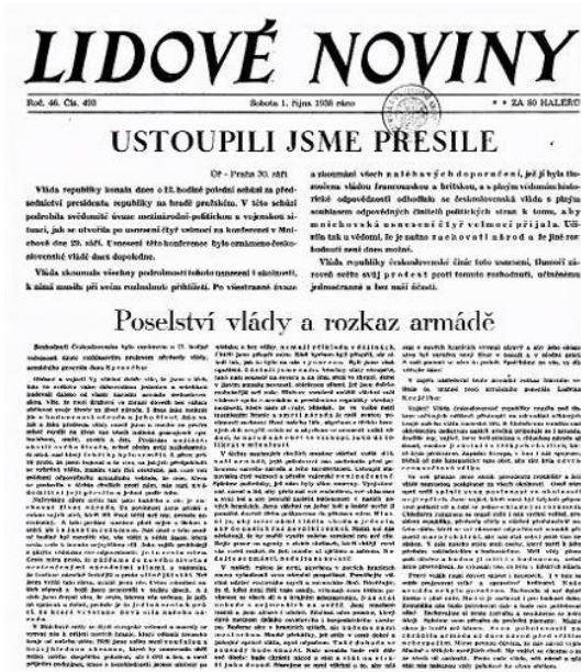
Obrázek č. 1: Titulní strana Lidových novin z 1. 10. 1938.