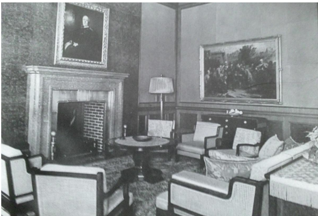
Obrázek č. 5: mnichovská kancelář Adolfa Hitlera, ve které byla dohoda podepsána.