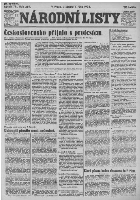
Obrázek č. 2: Titulní strana Národních listů z 1. 10. 1938.