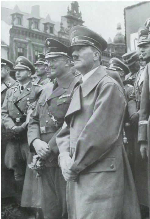
Obrázek č. 10: Hitler a Konrad Henlein v Chebu.