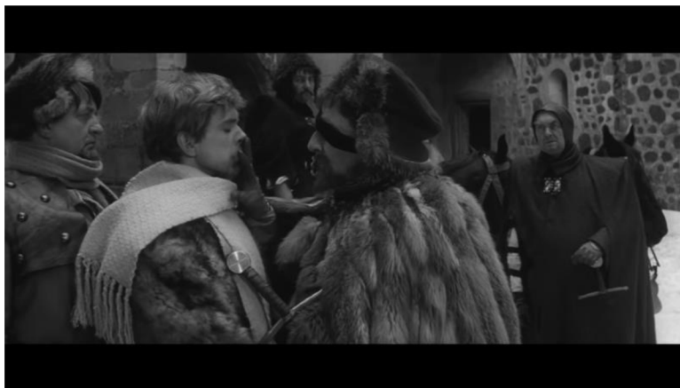
Obrázek č. 5 – scéna Janova zatčení v závěrečné části filmu, vzájemná paralela mezi těmito postavami vytvořena vzájemným zrcadlením (1:36:13)