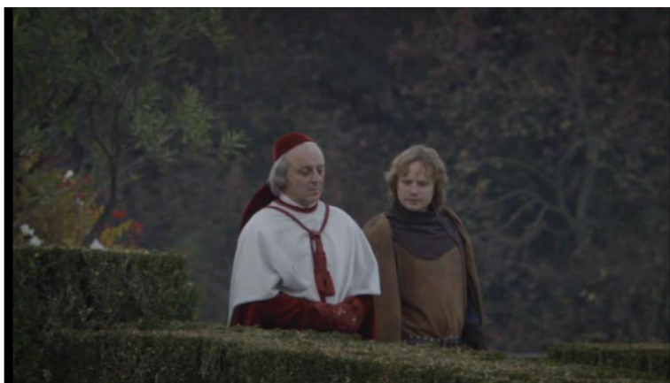
Obrázek č. 14 – nevýrazný kostým postavy Karla IV. (1:28:12)

jednotlivé dialogy a slova, která mu jsou vkládána do úst, jako jeho dialog při navracení hradů s panem Kostkou.