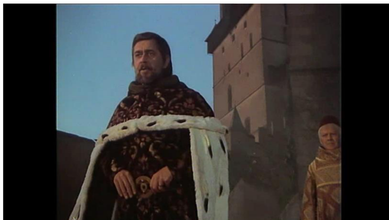
Obrázek č. 9 – scéna ze závěrečného monologu Karla IV. (1:18:17)

Ačkoliv se tedy Noc na Karlštejně odehrává již v pozdějším období po Vita Caroli , stále je znát její vliv v Karlově obrazu. Lze ho nálezt v samotných dialozích, ve vystavění narativní linky pak i samotného kompozičního rámce v podobě především osobnostních rysů popsáných v knize. Jsou to tak dílčí prvky, které však výrazně modelují jeho vykreslení ve filmu.