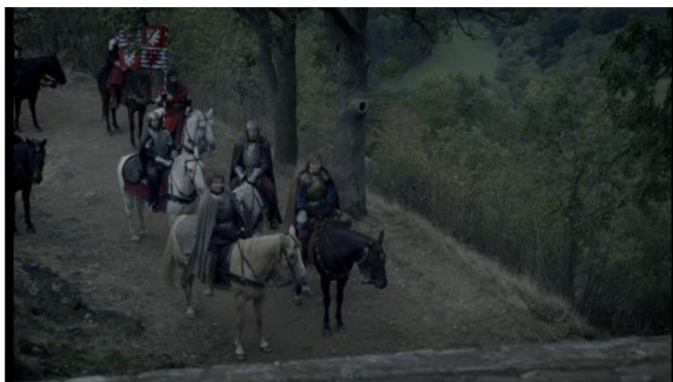
Obrázek č. 12 – jako Karlův pobočník je Bušek vždy ve větší družině nejbliže Karlovi (55:25)

V období, kdy ještě sledujeme malého Karla, jde vedle Jana za bavorským králem. Je tak ve středu dvou postav, během příchodu ho ale jeho otec odvede a sám převezme jeho centralizovanou pozici a do místnosti místo Karla vstoupí první on. K tomuto momentu se jako diváci vracíme ke konci stopáže, kdy zde dochází k poslednímu dialogu mezi těmito dvěma postavami. Karel je již zvolen římským císařem. Společensky je tedy výš než jeho otec a přesouvá se tak do vyšší osy, kdy je Jan nucen k němu vzhlížet. Jejich poslední scéna je uzavřena Karlovým gestem, Jan pouští Karla jako prvního ven z vojenského hradu, načež Karel odmítá a vycházejí oba bok po boku. Toto gesto tak vystihuje Karlův moudrý charakter v tomto snímku. Vzájemná osobnostní diference mezi osobnostmi otce a syna tak i zde nepropisuje jejich vztah pouze do příběhové linky, ale i do inscenačních postupů a Vita Caroli tak prostupuje filmem v naraci i ve stylistických prvcích. Protikladné ztvárnění tak opět dopomáhá modelovat Karlův charakter, kdy jsou jeho vlastnosti více eskalovány v moment, kdy dochází k porovnání s otcem.