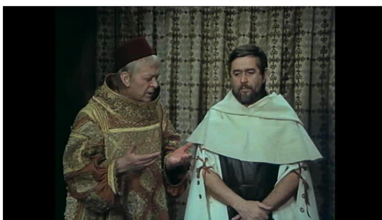
Obrázek č. 8 – Karel v kontrastu s kostýmem Arnošta z Pardubic působí prostým dojmem (1:02:42)

Vlastnosti představované ve Vita Caroli se v tomto snímku otiskly výrazně. Jeho popsaná státnická rozvážnost a skromnost, provází v tomto pojetí vyobrazení Karla od začátku, kdy se objeví na plátně a je prototypem nositele těchto vlastností. Odráží se to tedy jak v jeho zjevu, tak i ve funkci, jakou postava plní ve vyprávění, kterým je film provázán. Tato verze postavy se především předlohou spravedlivého, skromného a bohamilného vládce a splňuje tak Karlův vykreslený předobraz.