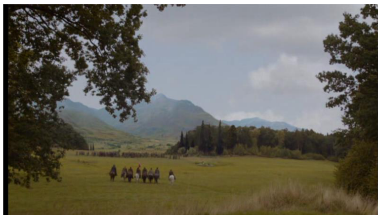
Obrázek č. 16 – závěrečná scéna snímku, kdy Karel mizí v davu (1:41:10)