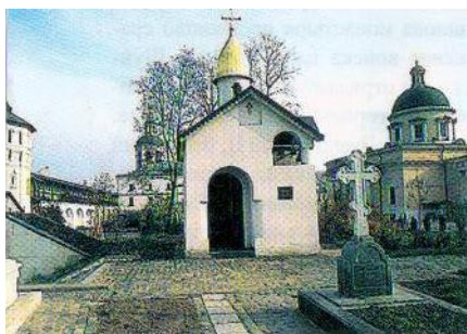
kostel Svatých otců sedmi ekumenických katedrál