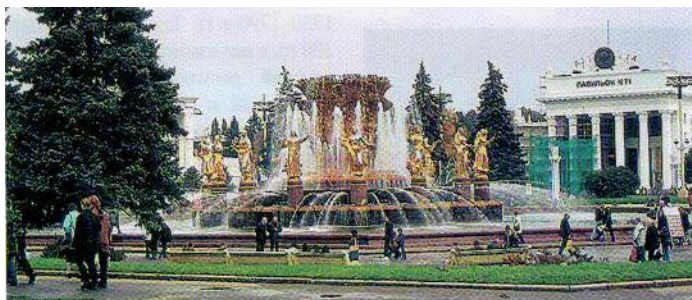
Fontána družby národů (VVC)

byla zorganizována také Celosovětská průmyslová výstava. V roce 1959 se obě výstavy spojily v jednu – Výstavu úspěchů národního hospodářství (VDNCh SSSR). Po rozpadu SSSR se začaly výstavní pavilony republik využívat pro jednorázové výstavy a prodejní stánky. V roce 1992 komplex získal nový statut – Celoruské veletržní centrum (Vserossijskij vystavočnyj centr - VVC).