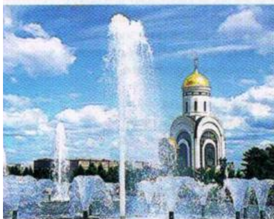
Храм Св. Георгия Победоносца на Поклонной горе

ков Отечественной войны 1812 г., картины художников XIX–XX вв. на тему военных событий начала XIX в.