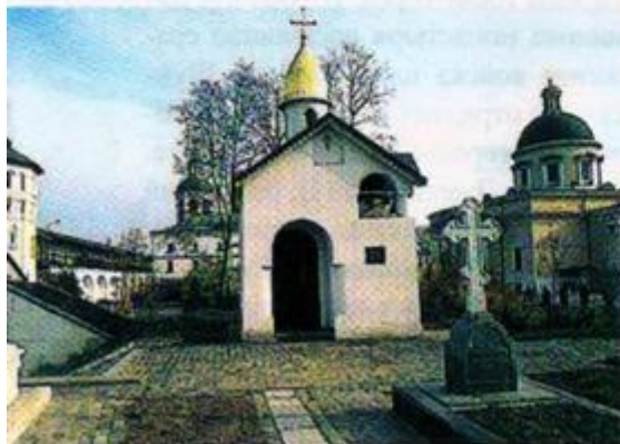
Храм Святых Отцов Семи Вселенских Соборов

Первый каменный собор обители – двухъярусный храм Святых