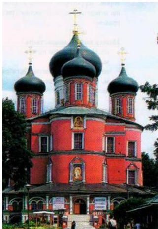
Velká katedrála Donského kláštera

Nekropole Donského kláštera na starém hřbitově je, co se týká bohatství a nádhery pamětních staveb, jediná v Moskvě. Podle vzpomínek N. V. Karamzina to byl aristokratický hřbitov, „San Germainské předměstí mrtvé Moskvy“. Hřbitov se začal utvářet ke konci XVIII. století. Uznávané kulturní a církevní osobnosti pochovávali zejména v Malém chrámu nebo v kostele Archanděla Michaela (rodinné hrobce Golícynových). V polovině XIX. století vznikla ještě řada rodinných hrobek. Autoři mnohých náhrobních kamenů byli věhlasní umělci jako I. Martos, V. Demut – Malinovskij, I. Vitali. Na klášterním hřbitově jsou pochováni básníci A. P. Sumarokov a M. M. Čeraskov, filozof P. J. Čaadaev, spisovatelé V. F. Odoevskij a V. A. Sologub, architekt A. Bové, historik V. O. Ključevskij, otec letectví N. E. Žukovskij a mnoho jiných.