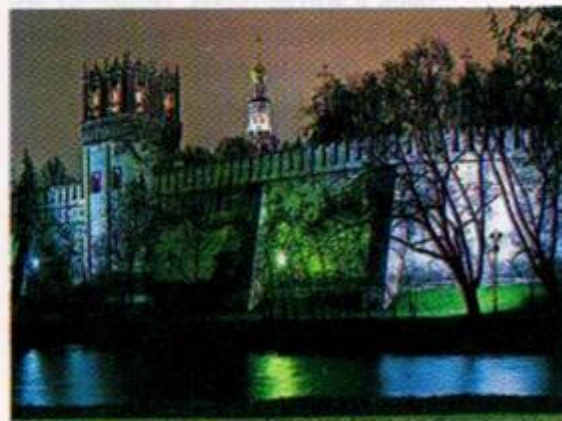
Стена Новодевичьего монастыря

Извне к южной монастырской стене примыкает Новодевичье кладбище , организованное в конце XIX в. по инициативе игуменьи. Здесь похоронены многие видные русские и советские писатели, артисты, государственные и партийные деятели, военачальники.