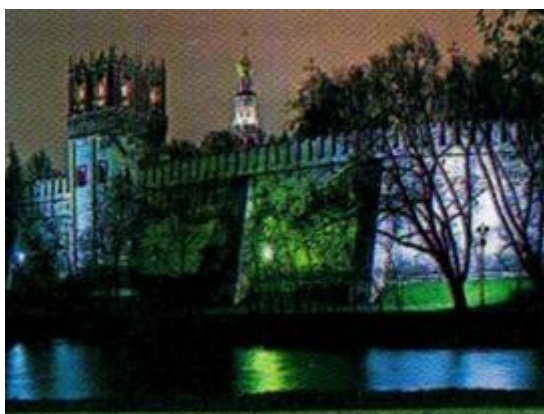
Hradba Novoděvičího klášteru

Zvenčí s jižní klášterní hradbou hraničí Novoděvičí hřbitov, zřízený koncem XIX. století z podnětu abatyše. Jsou zde pochováni mnozí významní ruští a sovětsí spisovatelé, umělci, státní a straničtí funkcionáři, velitelé vojsk.