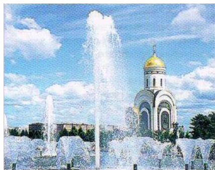
Chrám sv. Jiřího Vítězného na Poklonné hoře

V Parku Vítězství se nachází: hlavní památník – symbolický obelisk (výška – 142,5 m) s bronzovým basreliéfem a bohyní vítězství Niké, chrám sv. Jiřího Vítězného, Památeční mešita, Památeční synagoga, katolická kaple.