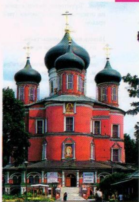
Большой собор Донского монастыря

Достопримечательности вне Садового кольца