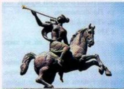
Скульптура на здании Центрального музея ВОВ