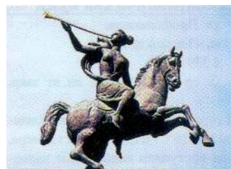
Plastika na budově Ústředního muzea Velké vlastenecké války