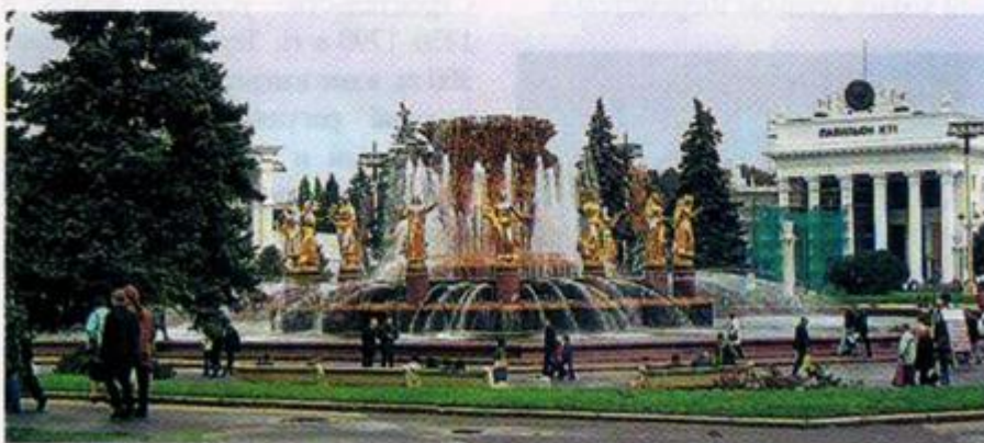
Фонтан «Дружба народов» на ВВЦ

Сейчас в зоопарке 988 видов, 6517 экземпляров животных, из них: млекопитающие – 158 видов, 1062 экз.; птицы – 255 видов, 1417+655 экз.; рептилии – 194 вида, 601 экз.; амфибии – 42 вида, 289 экз.; рыбы – 236 видов, 1439 экз.; беспозвоночные – 103 вида, 1044 экз.