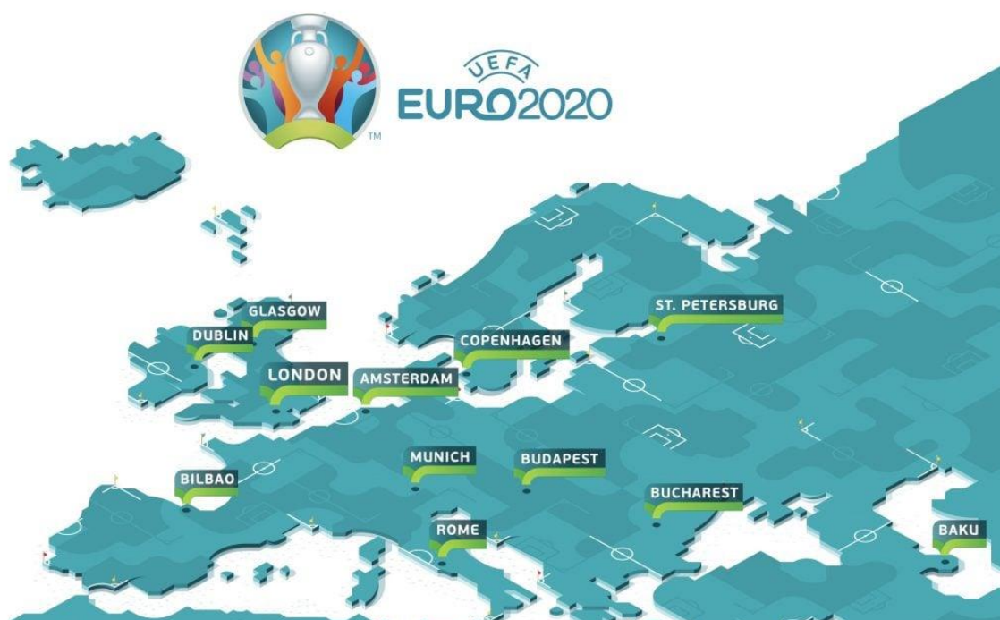
Obrázek č. 2 Mapa pořadatelských měst