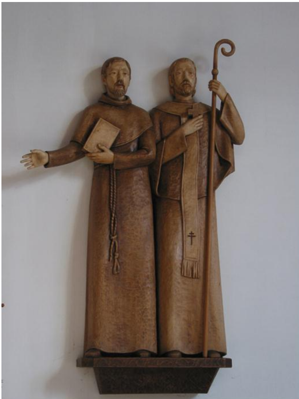
Příloha 1 - Interiér chrámu svatých Cyrila a Metoděje, svatý Cyril a Metoděj, dřevěné sousoší.