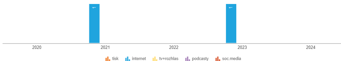
Obrázek 2 Analýza pojmu leadership AND řeholnice v Anopressu

tato nová abatyše absolvovala kurz zaměřený na leadership na benediktinské univerzitě Sant'Anselmo v Římě. 139 Dále toto téma v článku rozváděno není. Druhý článek zmiňoval leadership pouze okrajově v souvislosti s papežem Benediktem XVI.