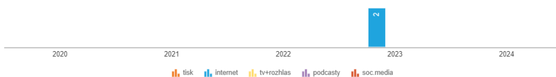
Obrázek 3 Analýza pojmu leadership AND synodalita v Anopressu

Poslední klíčová slova k analýze jsem zvolila leadership AND synodalita . Byl nalezen jeden článek zveřejněný ve dvou různých zdrojích, a to na webových stránkách Arcibiskupství olomouckého a na portále Cirkev.cz. Pojednával o přítomnosti českých delegátů na Evropském synodálním setkání. Téma leadershipu zde nebylo v popředí zájmu.