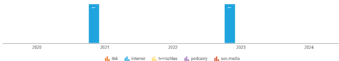
Obrázek 2 Analýza pojmu leadership AND řeholnice v Anopressu

tato nová abatyše absolvovala kurz zaměřený na leadership na benediktinské univerzitě Sant'Anselmo v Římě. 139 Dále toto téma v článku rozváděno není. Druhý článek zmiňoval leadership pouze okrajově v souvislosti s papežem Benediktem XVI.