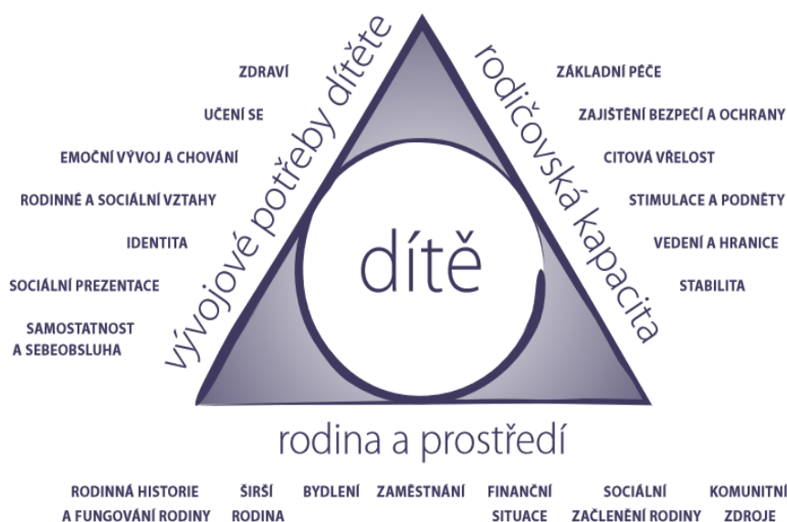
Obrázek č. 1: Vyhodnocovací rámec potřeb dítěte.

Dle autorů dokumentu jsou všechny tři oblasti zásadní pro zdravý vývoj dítěte a je nutné, aby byly prozkoumány. Musí se ovšem brát zřetel na skutečnost, že rodiny hodnocené jako problémové často přichází ze sociálně vyloučené oblasti. V předešlé kapitole jsme si ukázali, že ubytovna touto lokalitou v mnoho případech skutečně je. Hodnotitel by měl tento fakt brát na vědomí a uzpůsobit tomu výzkum v rodině a jeho výsledky (Racek, Solařová a Svobodová, 2014, s. 11).