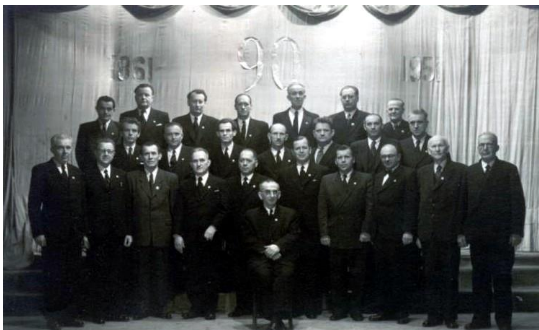
Č. 12 Mužský sbor poděbradského Hlaholu (1951).