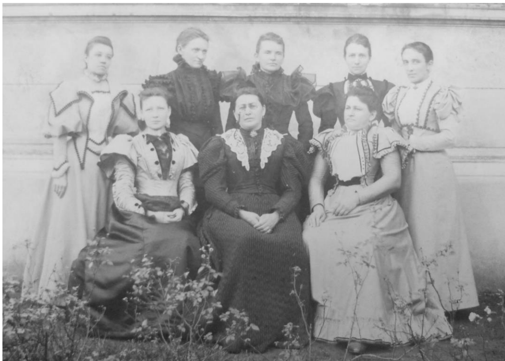
Č. 1 Výbor Ženského zpěváckého spolku (1896).