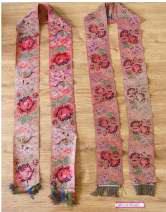
Č. 13 Spolkové šerpy.