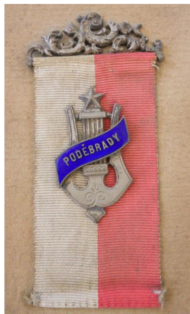
Č. 14 Spolkový odznak z roku 1897.