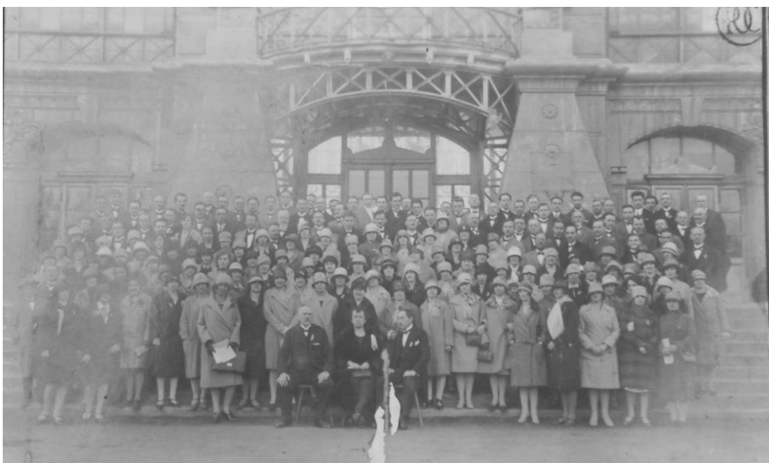
Č. 7 Členstvo Smetanovy pěvecké župy polabské na pěveckém festivalu v Praze (1928).