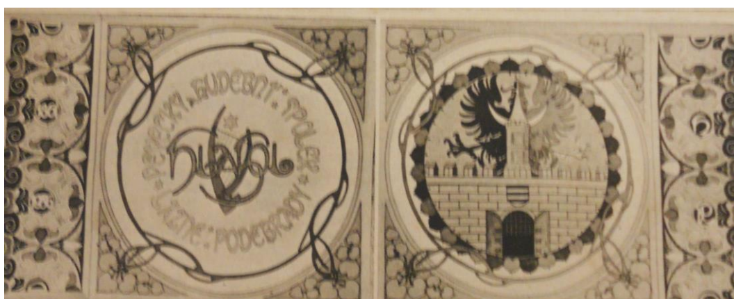
Č. 9 Nový prapor spolku zhotovený podle návrhu Alfonse Muchy ve vyšivačských dílnách Jedličkova ústavu v Praze (1936).