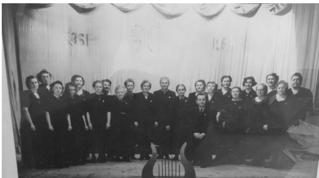
Č. 11 Ženský sbor poděbradského Hlaholu (1951).