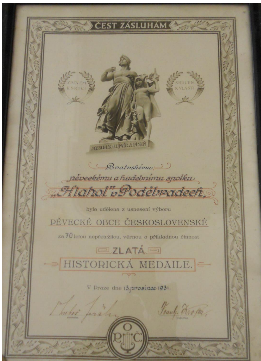
Č. 8 Udělení Zlaté historické medaile od Pěvecké obce československé (1931).