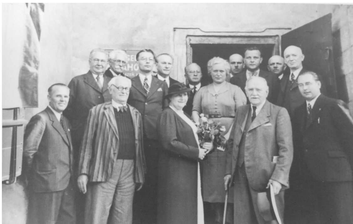
Č. 10 Návštěva J. B. Foerster (vpředu s hůlkou) v Poděbradech (1939).