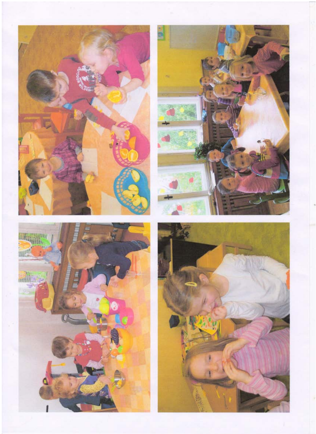
Deti pri konzumácii ovocia a príprava šalátov.