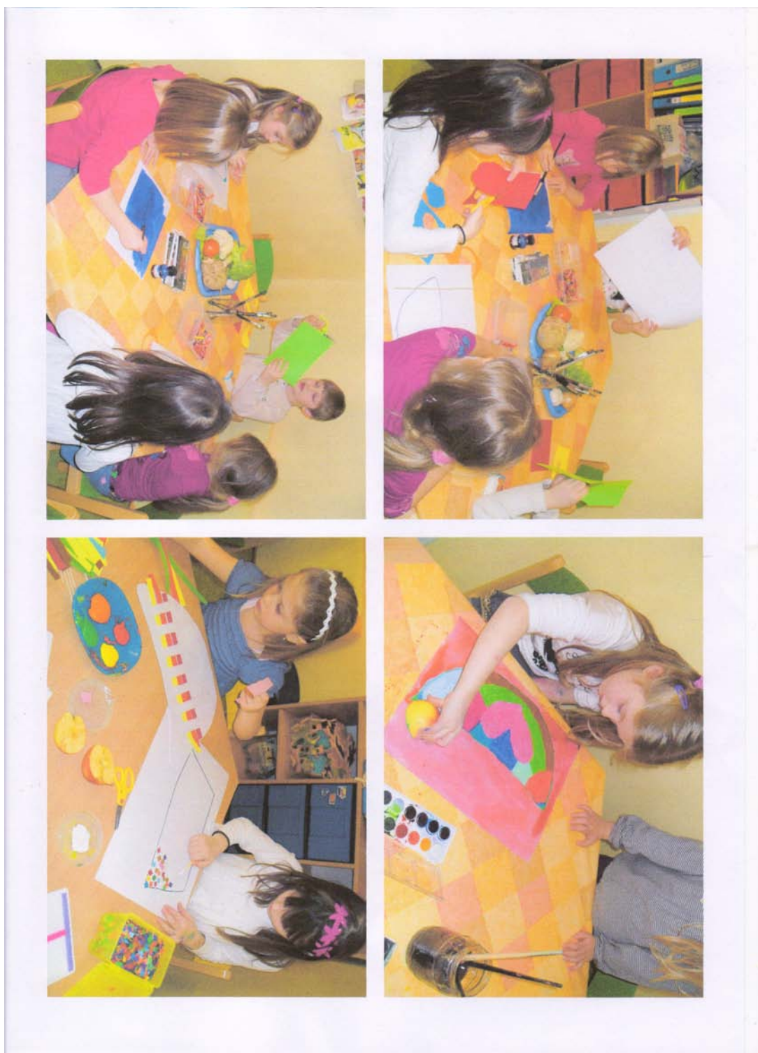
Deti maľujú na výtvarnej výchove ovocné misy.