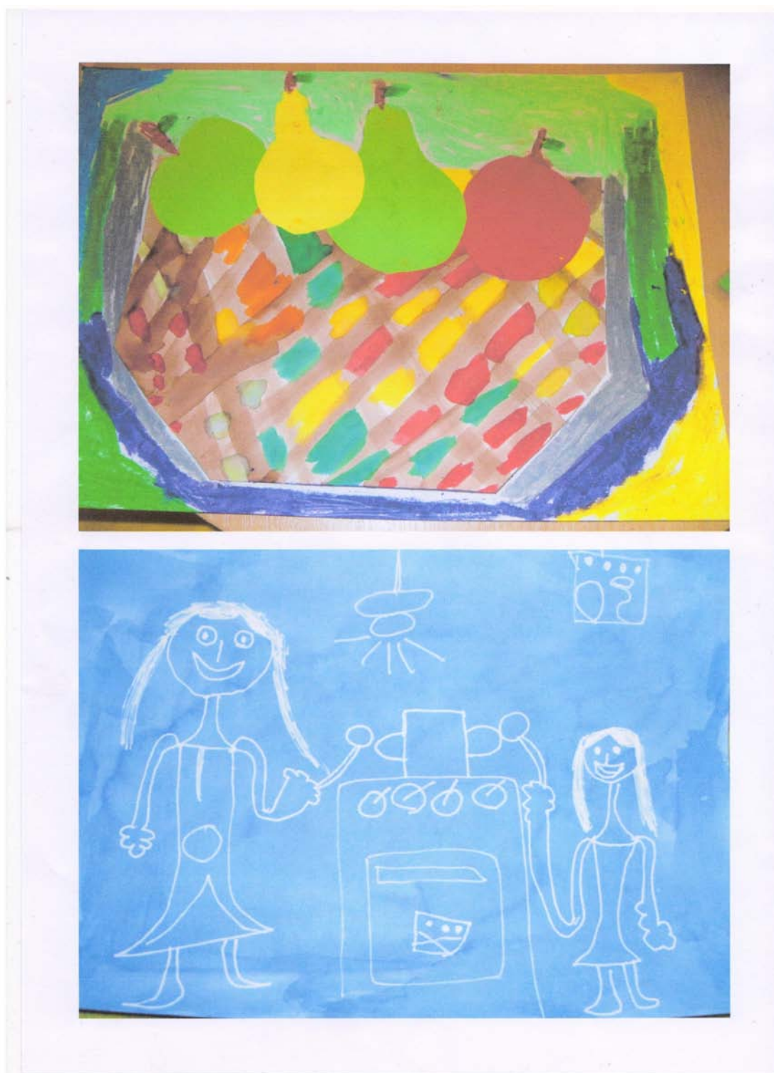
Dokončené výkresy detí na danú tému.