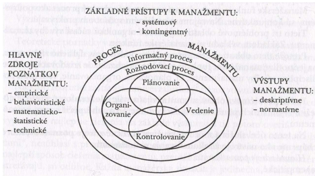
Obrázok č.1 Podstata teórie manažmentu