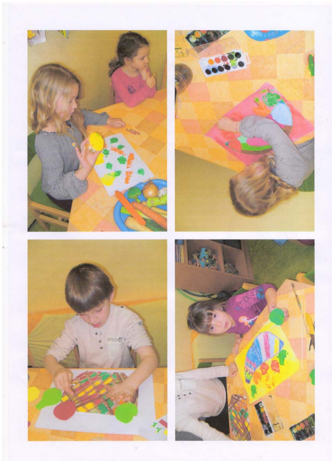
Deti po vyučovaní pracujú na kolážach s motívom ozdravej stravy.