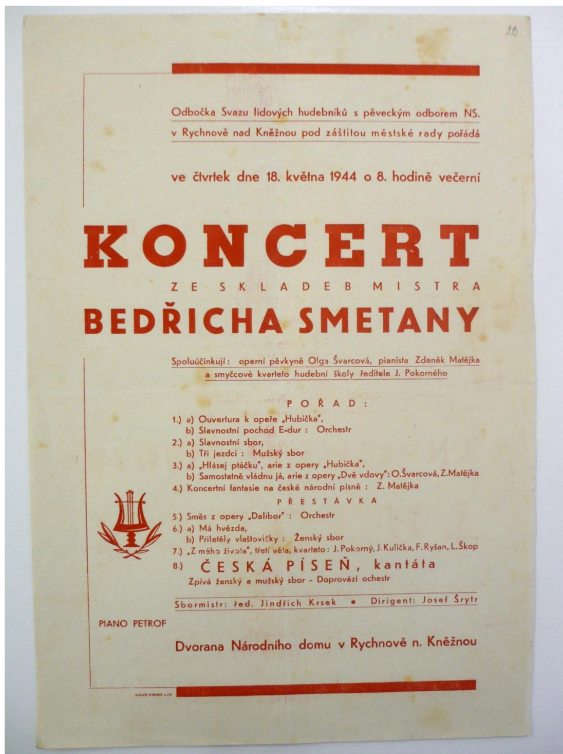
Státní okresní archiv Rychnov nad Kněžnou, Fond DF Rychnov nad Kněžnou – Tělocvičná jednota Sokol, inv. č. 46/160, kart. 55, Koncerty, hudební slavnosti, 1886 - 1945