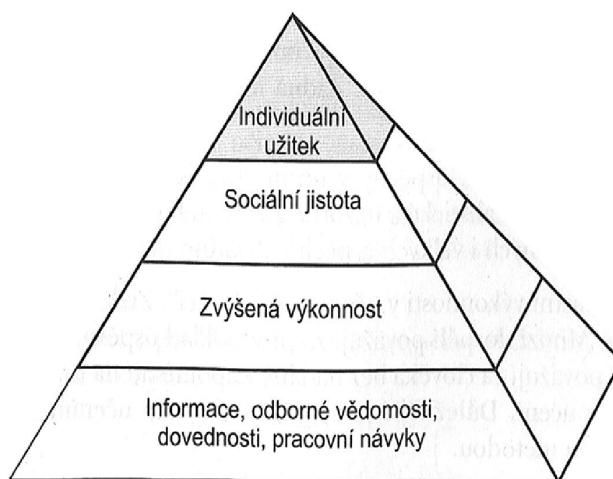
Obrázek 1: Pyramida motivace učení