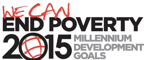
Obrázek 2 Grafické znázornění kampaně MDG's

Nejvíce výrazným cílem, který se stal i „tvář“ kampaně a materiálů byl cíl číslo jedna, který se zabíral Odstraněním extrémní chudoby a hladu. Ovšem to neznamenal, že by ostatní cíle neměly váhu. (19)(20)(21)