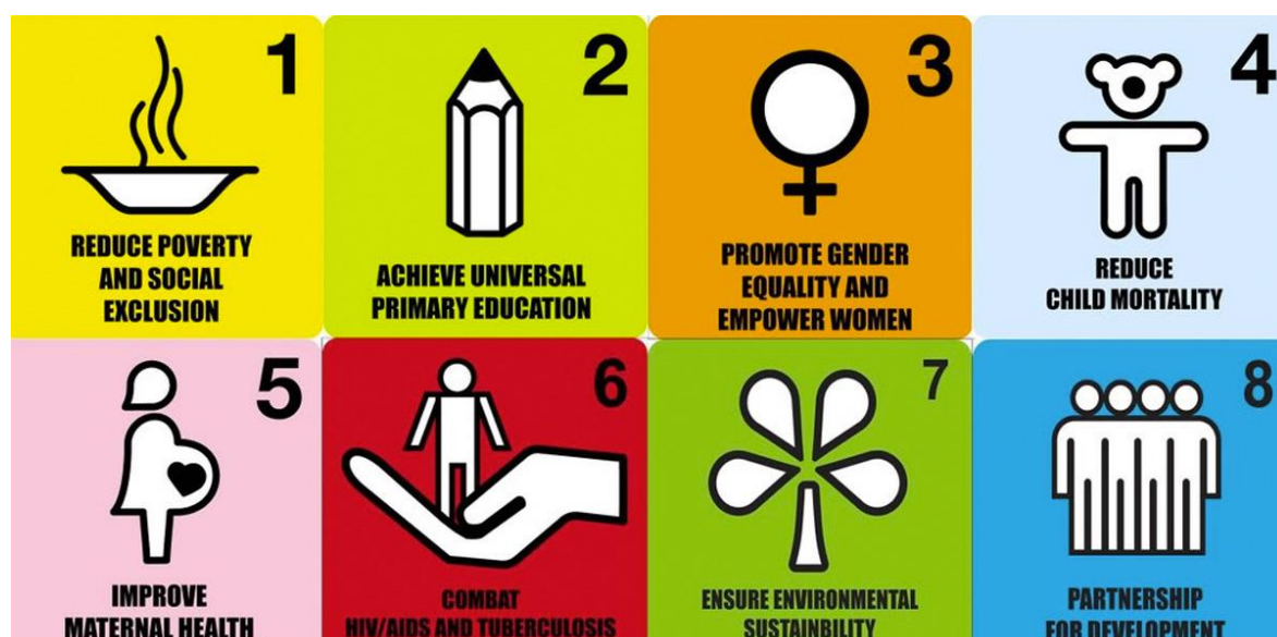
Obrázek 3 Grafické znázornění rozvojových cílů tisíciletí