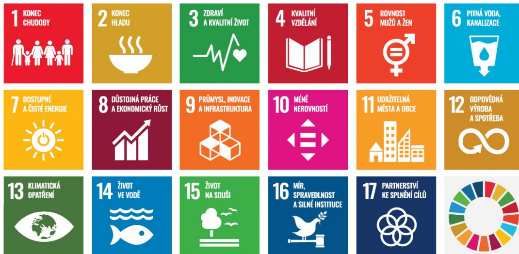
Obrázek 6 Cíle udržitelného rozvoje