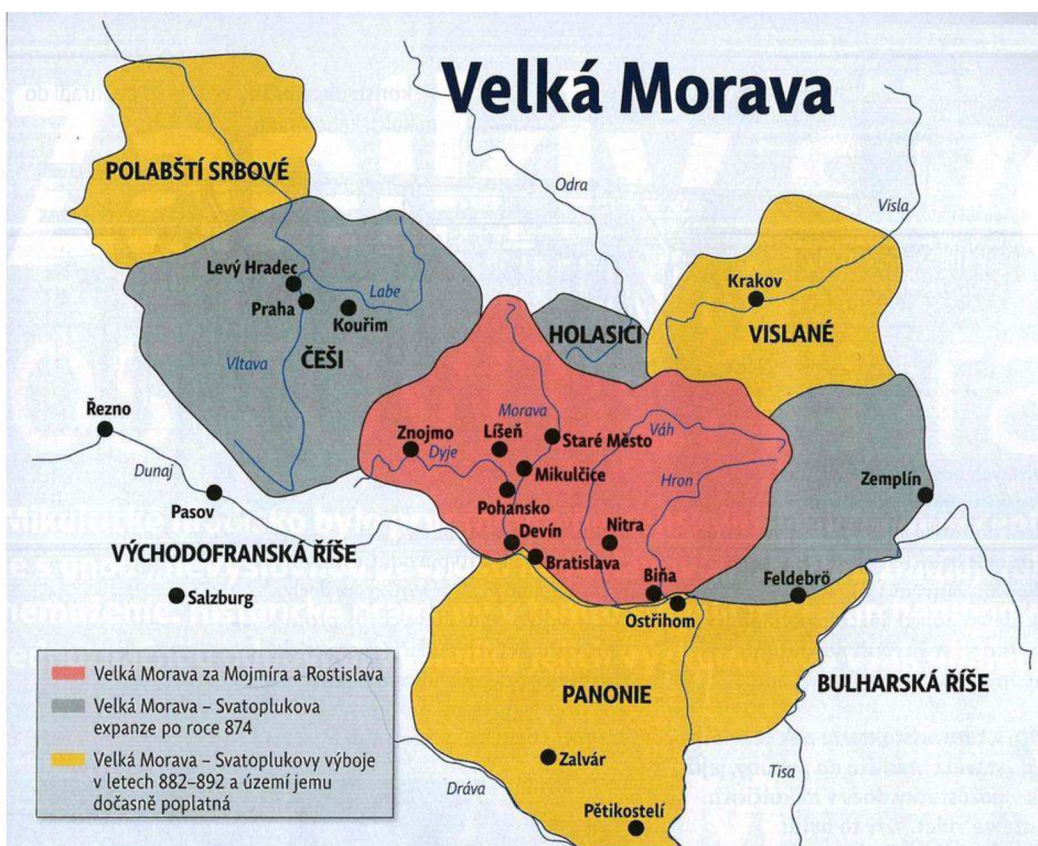
Obrázek 1 Velkomoravská říše