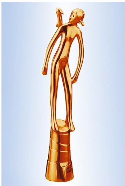
Obrázek č.2: Zlaté jablko - divácká cena