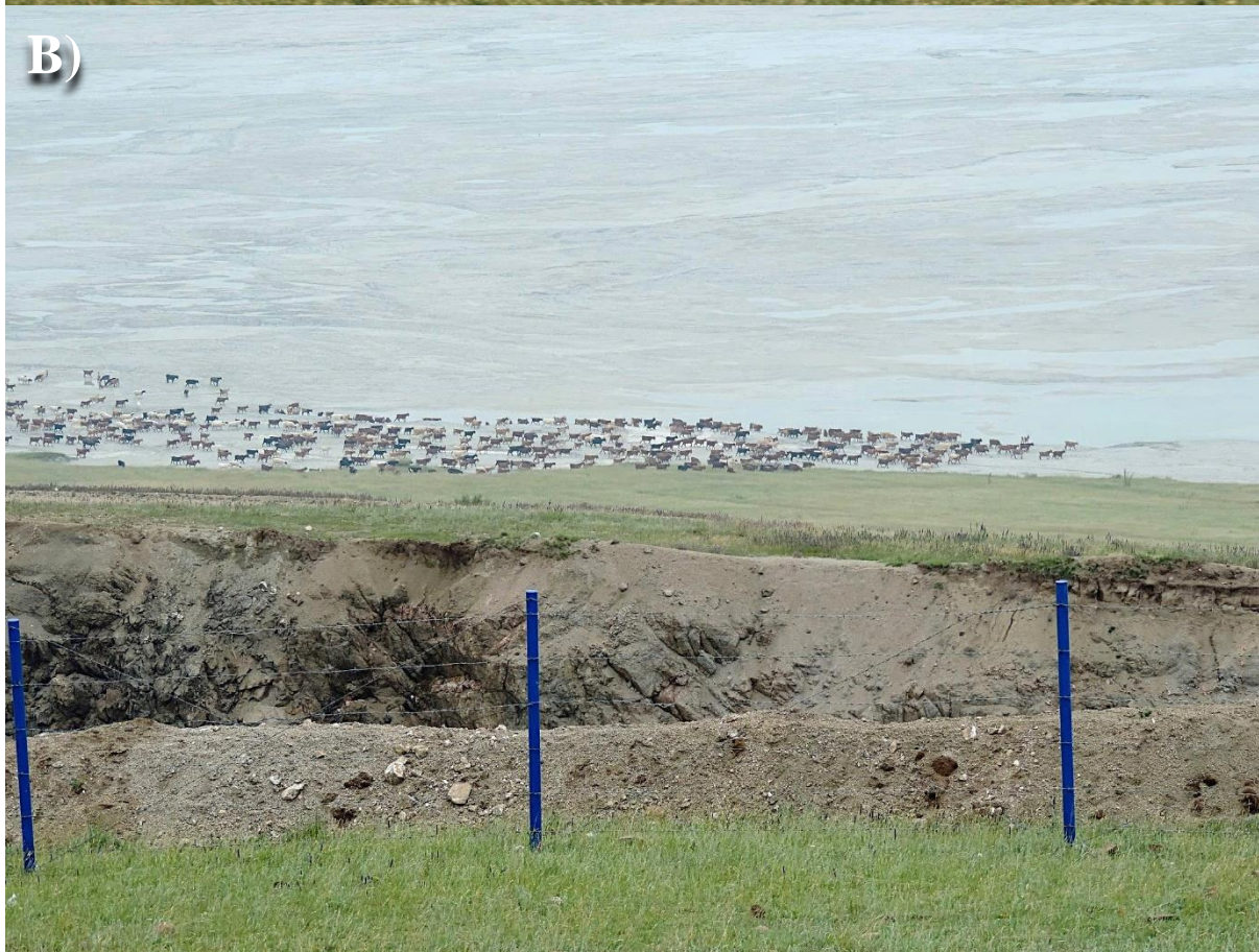
Obrázek 2. A) Pastva dobytka pod haldou těžebního odpadu s viditelnými aktivními stezkami dobytka na haldě poblíž města Shariin Gol. B) Napájení drobného dobytka v odkalovací nádrži za ochranným plotem poblíž města Erdenet s Cu-Mo dolem.