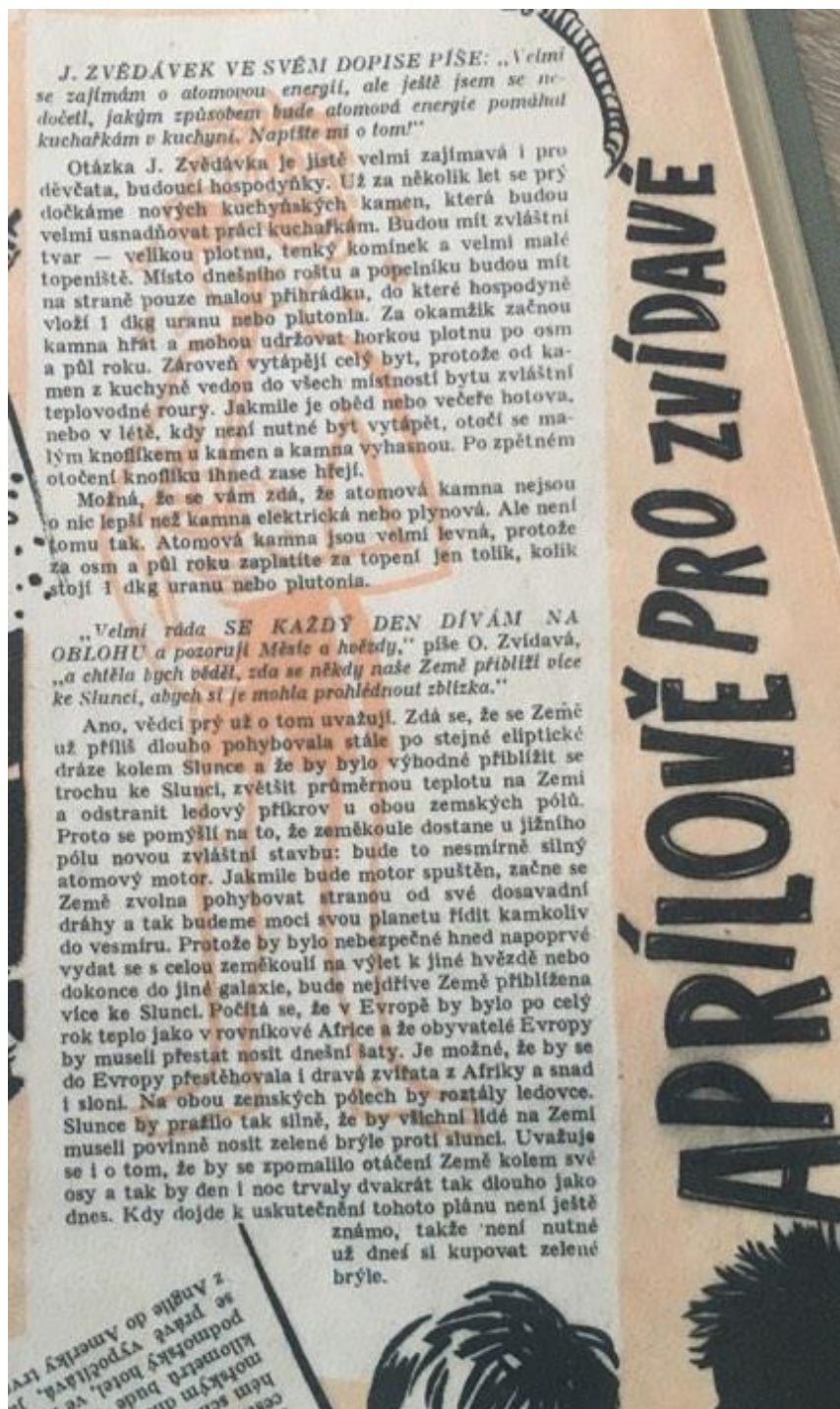
Obrázek č. 1- Dubnové dotazy spadající pod rubriku Aprílově pro zvědavé Aprílově pro zvidavé 87