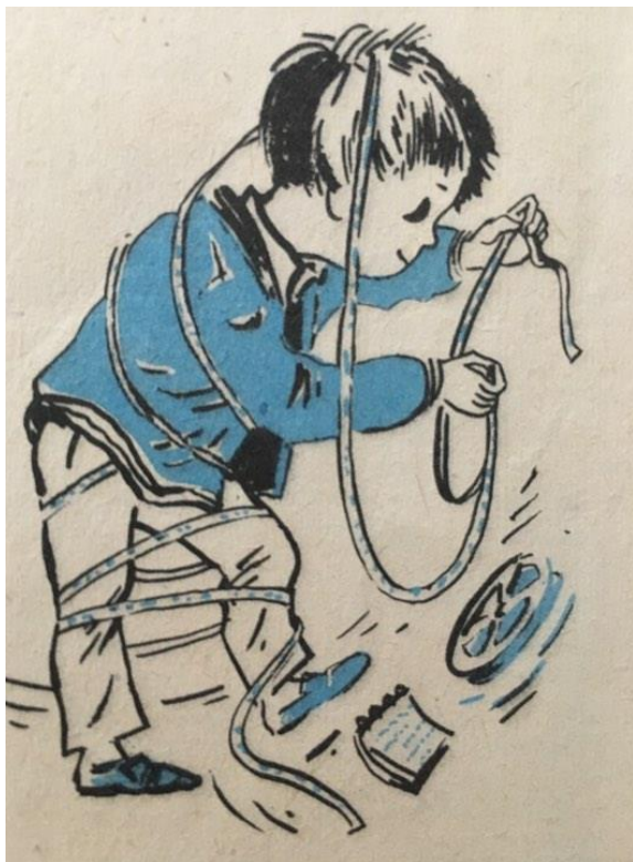
Obrázek č. 4- Příklad černobílého obrázku s tyrkysovými prvky 90