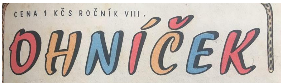
Obrázek č. 8- grafická transformace názvu časopisu 95