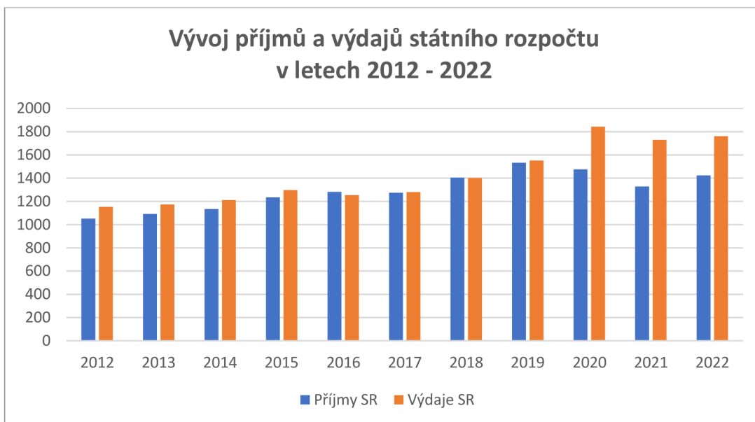
Obrázek 3 Tabulka: Vývoj příjmů a výdajů státního rozpočtu