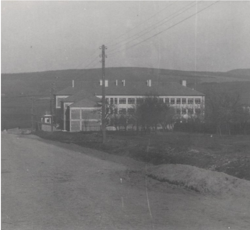
Příloha 7 - pohled od kostela na školní budovu po dokončení