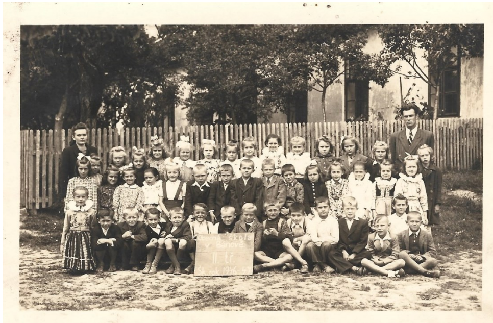
Příloha 5 – Žáci II. třídy Obecné školy v Bánově ve školním roce 1946-1947