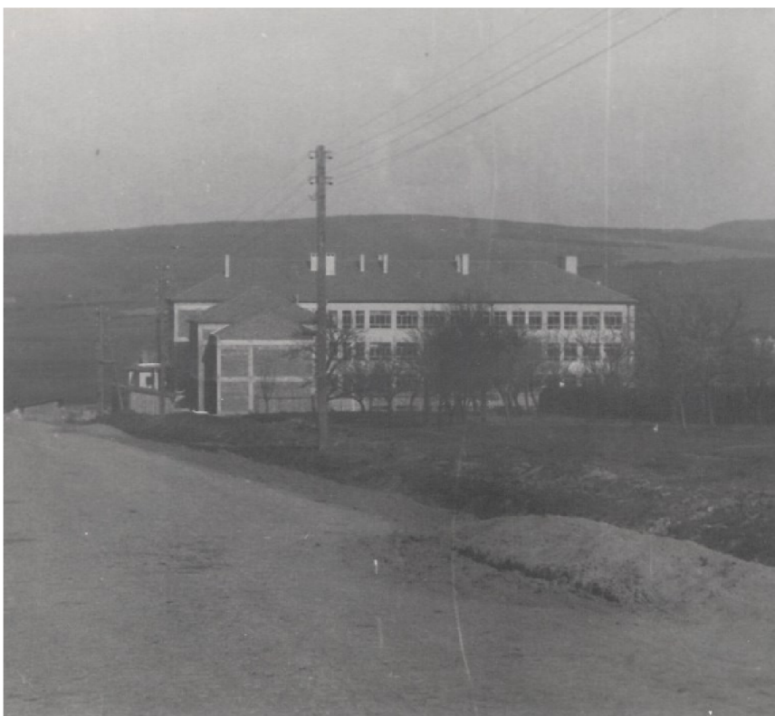
Příloha 7 - pohled od kostela na školní budovu po dokončení