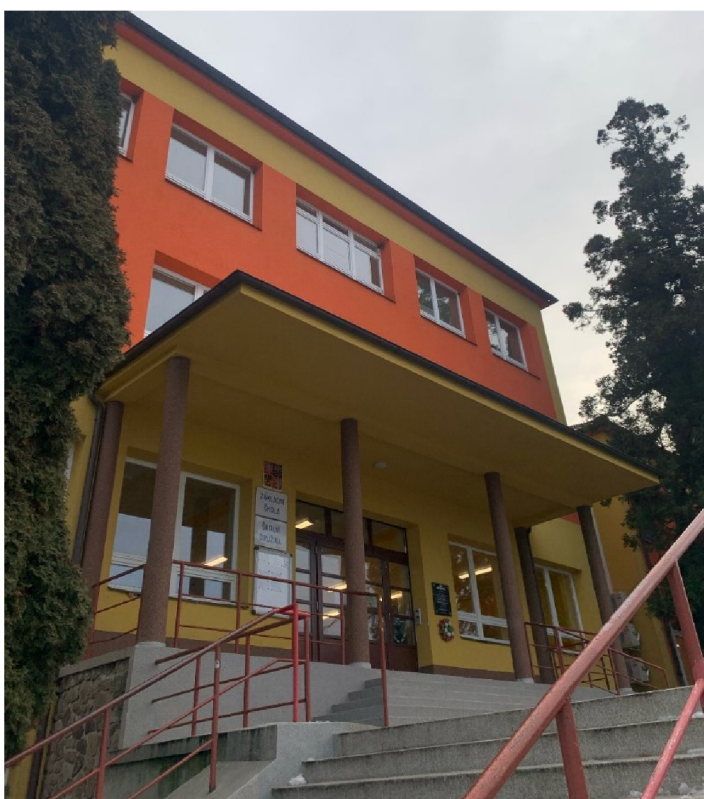
Příloha 8 - Současná podoba Základní školy Josefa Bublíka Bánov