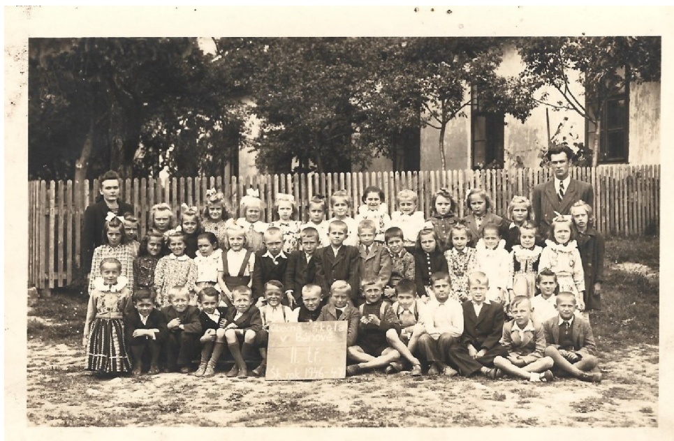
Příloha 5 – Žáci II. třídy Obecné školy v Bánově ve školním roce 1946-1947