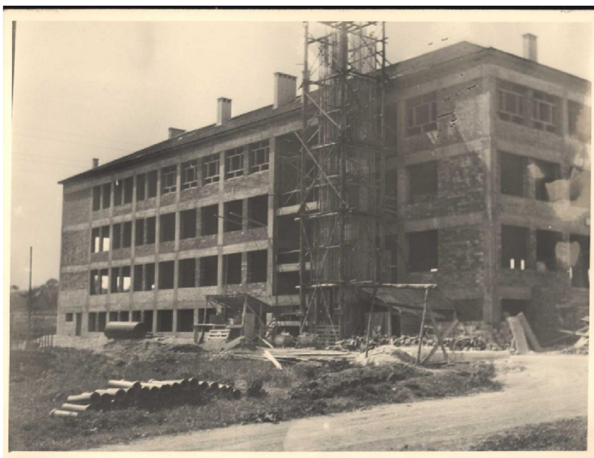
Příloha 6 - stavba nové školní budovy, cca rok 1950