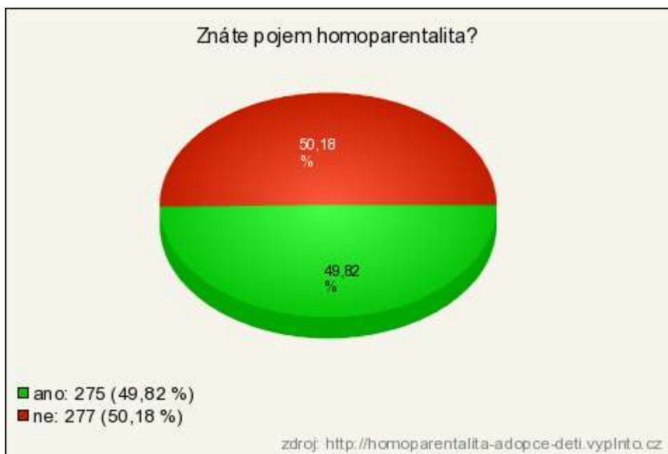
Graf 5: Znalost pojmu homoparentalita