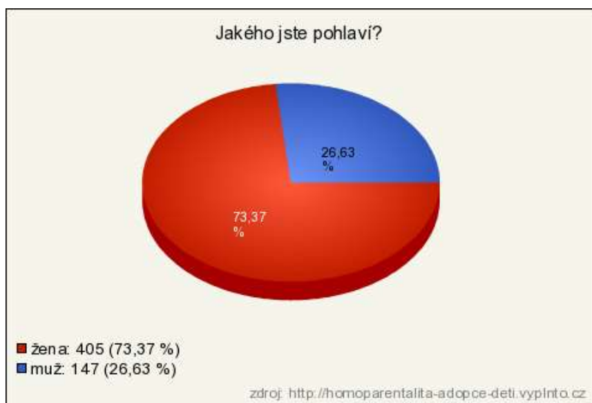
Graf 1: Pohlaví respondentů