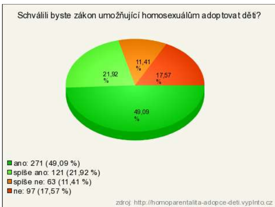
Graf 4: Adopce dětí homosexuály