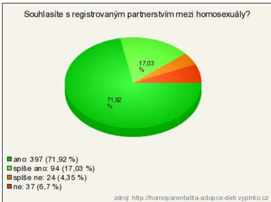
Graf 3: Registrované partnerství mezi homosexuály