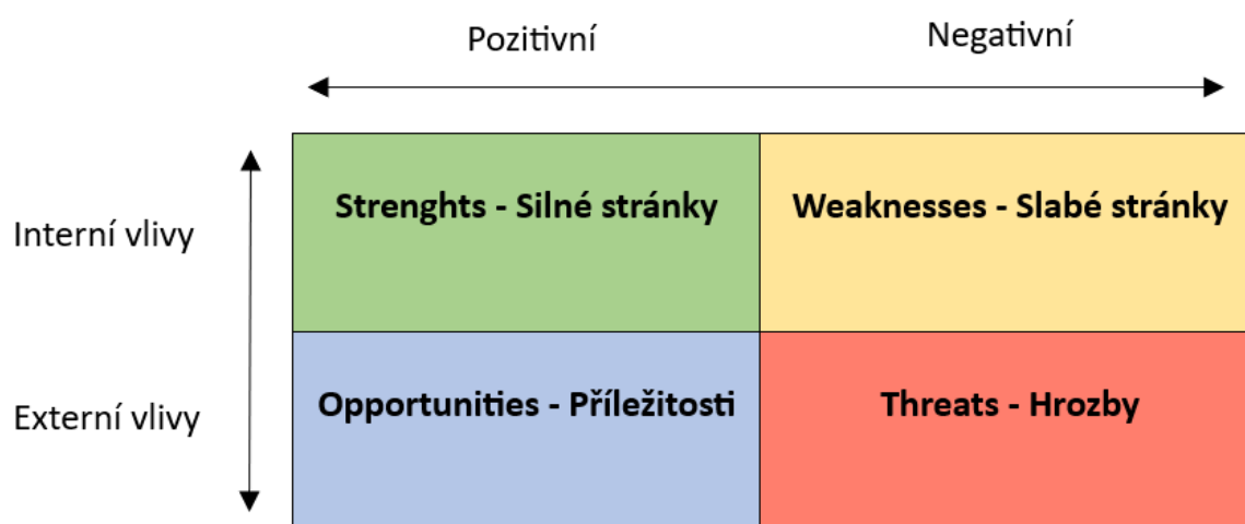
Obrázek 2 – SWOT analýza

Pomocí SWOT matice, která zahrnuje silné a slabé stránky podniku, hrozby a příležitosti, můžeme srovnávat vnější hrozby a příležitosti s vnitřními silnými a slabými stránkami organizace. Tímto porovnáním příležitostí a hrozeb se silnými a slabými stránkami organizace vznikají čtyři potenciální strategické alternativy.