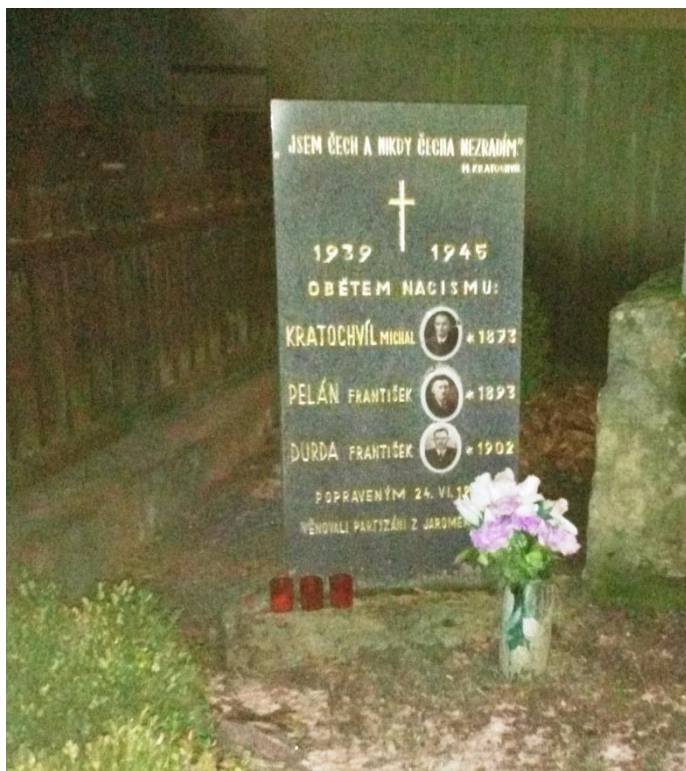
Příloha č. 16: Pomník v Myslibořicích Na Ostrých