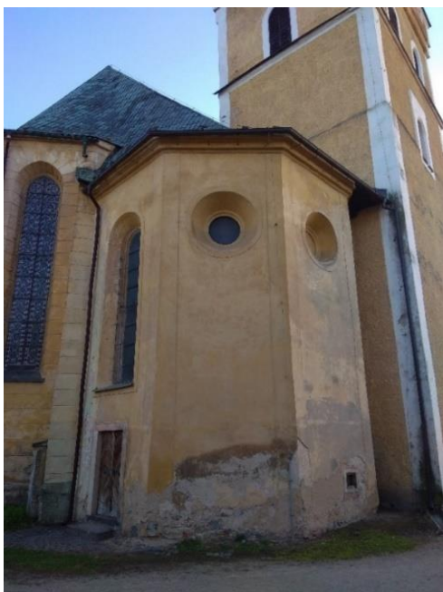
Obr. 11: Frýdlant, kostel Nalezení sv. Kříže, pohřební kaple Redernů, exteriér