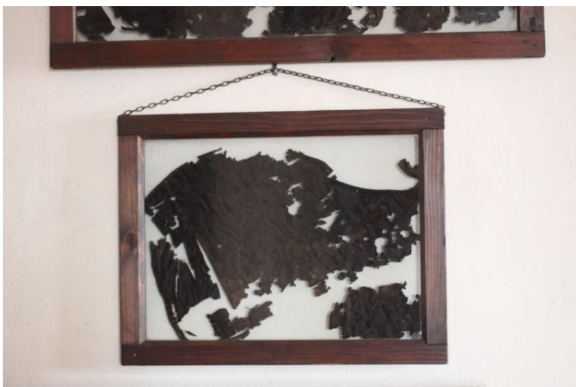
Obr. 16: Zbytek smutečního oděvu Melchiora z Redernu, zámek Frýdlant