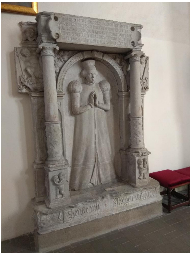
Obr. 35: Náhrobek Anny z Redernu, po 1566, Frýdlant, kostel Nalezení sv. Kříže

Sloupy tvoří spojující prvek celého monumentu a ohraničují slepou arkádu, ve které je umístěna postava Anny z Redernu. Edikulové schéma po stranách lemují dvojice nižších pilířů, nad jejichž hlavicemi jsou napojené reliéfní desky s putti držícími symboly pomíjivosti; putti na levém soklu 217 drží lidskou lebku a putti na opačném soklu přesýpací hodiny. Na boční straně soklů jsou nenápadné kartuše. Dříky jsou ve spodní části zdobené geometrickým probíjeným dekorem s motivem hlavy 218 a diamantováním, opět evokující nizozemské vzory. Výše už sloupy nenesou žádný dekor a jsou ukončeny iónskými hlavicemi 219 . Prostor arkád za sloupy je bohatě členěn. V úrovni soklu je na boční straně zřetelný zřejmě motiv zkřížených kostí. Pilíře archivolty v pozadí sloupů zdobí dva reliéfy postav v edikulách. Na levé straně je to