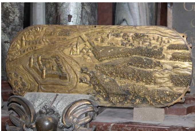
Obr. 45: Mauzoleum Melchiora z Redernu, 1605–1610, Frýdlant, kostel Nalezení sv. Kříže, reliéf bitvy u Siseku