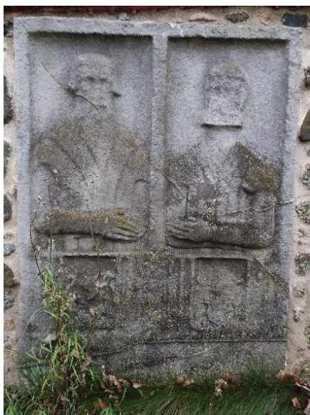
Obr. 16: Epitaf neznámých, pískovec, Ves, hřbitovní zeď u kostela sv. Vavřince