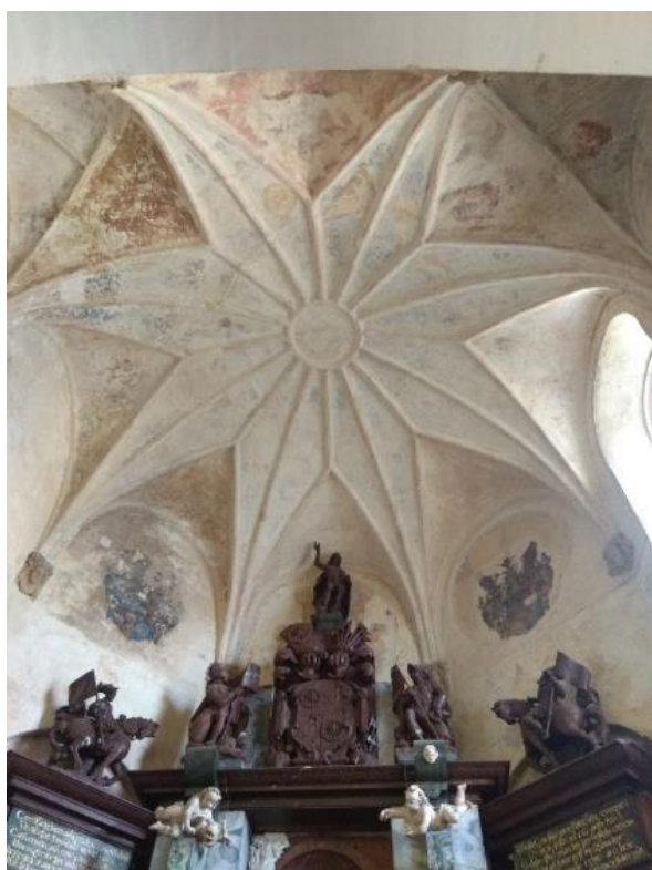
Obr. 12: Frýdlant, kostel Nalezení sv. Kříže, klenba pohřební kaple

V 80. letech 18. století byla východní stěna kaple prolomena, aby vznikl samostatný boční vchod a také byla dvě kruhová okna zazděna a třetí rozšířeno. 195 Podlaha kaple byla roku 1908 předlážděna. Kryptu kryl původně mramorový náhrobní kámen s vytesanými erby (zřejmě erb Redernů a Šliků) a s nápisovým polem, bohužel byl však sešlapán natolik, že už tyto detaily není možné rozpoznat.