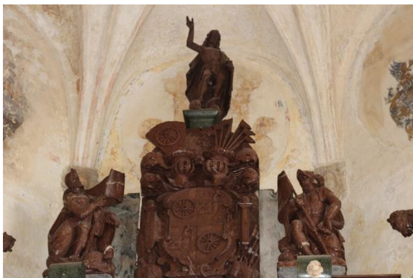
Obr. 48: Mauzoleum Melchiora z Redernu, 1605–1610, Frýdlant, kostel Nalezení sv. Kříže, detail kartuše s redernským erbem a sochou Zmrtvýchvstalého Krista, po stranách Jozue (vlevo) a Gedeon (vpravo)

Poslední část mauzolea tvoří erb se sochou Krista a starozákonní proroci nad římsou. Kartuše s redernským znakem se nachází ve střední části náhrobku, osově nad postavou Melchiora. Po stranách znaku je v reliéfu vyvedená zbroj a zbraně, společně s praporci. Nad znakem jsou dvě velké přilby, levá s pavími pery a redernským kolem a pravá s praporci na žerdích. Z kartuše vychází sloupek, na kterém stojí postava Krista, jenž pravou nohou stojí na lebce Adamově a levou nohu šlape na hada, který mu ji omotává. Vedle kartuše jsou dva proroci v brnění, držící praporce. 249 Vlevo od erbu je Jozue stojící na korunovaném panovníkovi a opírající se o štít, v jeho pravé ruce je korouhev se sluncem. Naproti němu stojí Gedeon s korouhví a trubkou v pravé ruce a vázou u jeho nohou. Nad postavou Kateřiny je David jedoucí na konci, držící prapor s harfou. Nad postavou Kryštofa II. je vyobrazen Juda Makabejský na koni a s praporcem.