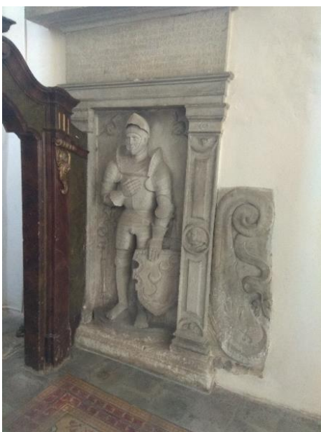
Obr. 8: Náhrodek Jeronýma z Biberštejnu, po 1549, pískovec, Frýdlant, kostel Nalezení sv. Kříže