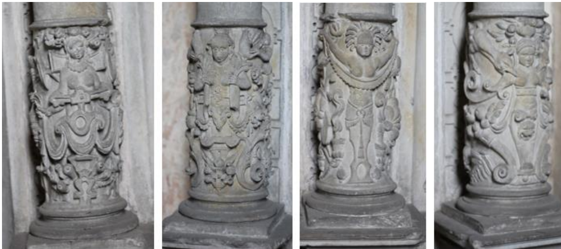
Obr. 19–22: Náhrobek Bedřicha z Redernu, jeho ženy Salomeny a jejich syna Bedřicha ml., 1565–1566, Frýdlant, kostel Nalezení sv. Kříže, dřívky s dekorativní výzdobou

Postava vlevo znázorňuje Bedřicha z Redernu v plné zbroji (na některých místech s dekorem), se štítem a zbraněmi u jeho nohou. Oproti třetí postavě, svému synovi Bedřichu ml., je zachycen znatelně starší, s plnovousem a vráskami v oblasti čela, nicméně nejedná se ještě o individualizované zachycení, pouze o rozlišení věku postav. Bedřichovy ruce jsou bohužel poškozené, původně byly v gestu modlitby. V levém cviklu edikuly je zobrazena Obezřetnost (Prudentia) s hadem omotaným kolem jedné ruky a se zrcátkem v ruce druhé. Ve druhém cviklu je Naděje (Spes); mužská postava se sepjatýma rukama, vzhlížející k oblaku. Nad Bedřichem je text: „Im M.D.L.X. IIII Iar Freitag nach Reminiscere den 3 Martii, Ist der wolgeborne und Edle Herr. Herr Fridrich von Redern Freyherr zu Friedland und Seidenbergk ko(niglich) (etc) key(serliche) Ma(jes)t(a)t Radt und Camer Presidentt in Ober und Nider Schlesien (etc.) in Gott verstorben. dem Gott gnedig sey.“ 206