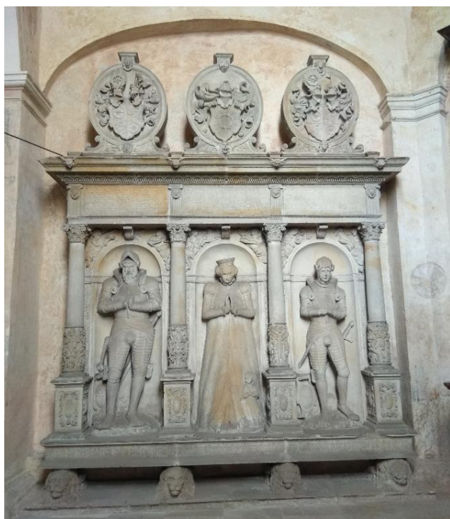
Obr. 17: Náhrobek Bedřicha z Redernu, jeho ženy Salomeny a jejich syna Bedřicha ml., 1565–1566, Frýdlant, kostel Nalezení sv. Kříže

Přístěnný náhrobek edikulového schématu evokuje svou trojdílnou kompozicí triumfální oblouk. Z nízkého soklu vyrůstají čtyři mohutné sokly se sloupy, jež vyčleňují trojici polí s nikami, kde jsou umístěny stojící postavy zemřelých příslušníků rodiny Redernů. Nad sloupy je mohutné kladí s vysokým vlysem určeným pro nápisy. Na korunní římsě jsou osazeny tři kartuše s příslušným rodovým znakem.