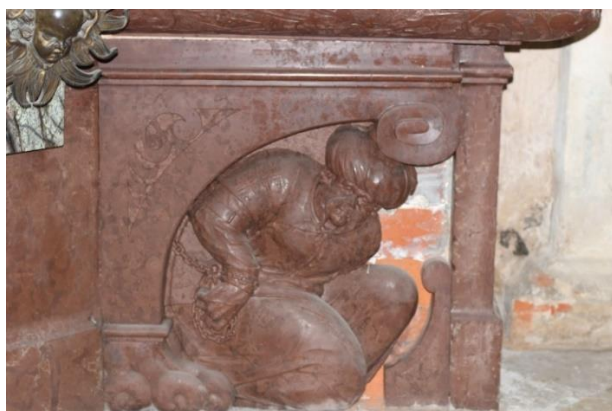
Obr. 39: Mauzoleum Melchiora z Redernu, 1605–1610, Frýdlant, kostel Nalezení sv. Kříže, reliéf spoutaného Turka v pravém rohu