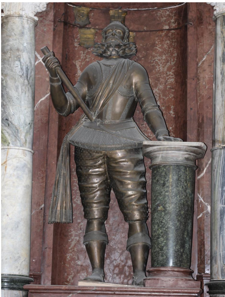
Obr. 44: Mauzoleum Melchiora z Redernu, 1605–1610, Frýdlant, kostel Nalezení sv. Kříže, postava Melchiora z Redernu