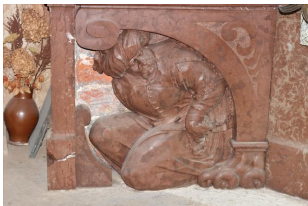
Obr. 38: Mauzoleum Melchiora z Redernu, 1605–1610, Frýdlant, kostel Nalezení sv. Kříže, reliéf spoutaného Turka v levém rohu

Úroveň soklu lemují po obou stranách spoutaní Turci s turbany na hlavě, kteří kopírují svými zády oblouky zakončené lví tlapou. Tváře pokořených Turků jsou velice živě zpracovány. Ve střední části soklu je pozlacený reliéf s označením „Papa“; jde o jeden z Melchiorových válečných úspěchů, dobytí města Pápy. Pilastry vedle reliéfu lemují postavičky bronzových andělíčích hlaviček na alabastrové podložce.