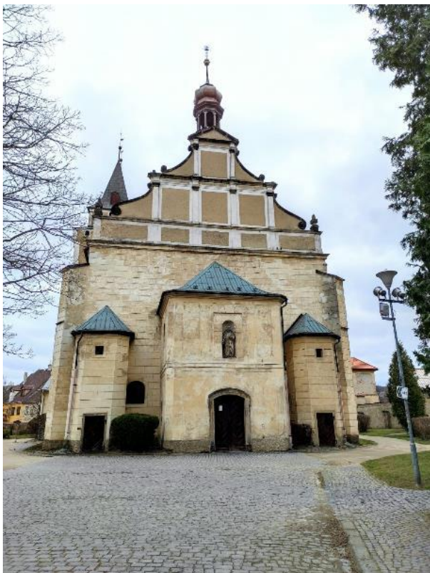
Obr. 10: Frýdlant, kostel Nalezení sv. Kříže, průčelí