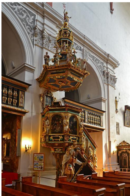
Obr. 1: Gerhard Hendrik, kazatelna, 1605, Olešnice, bazilika sv. Jana Evangelisty