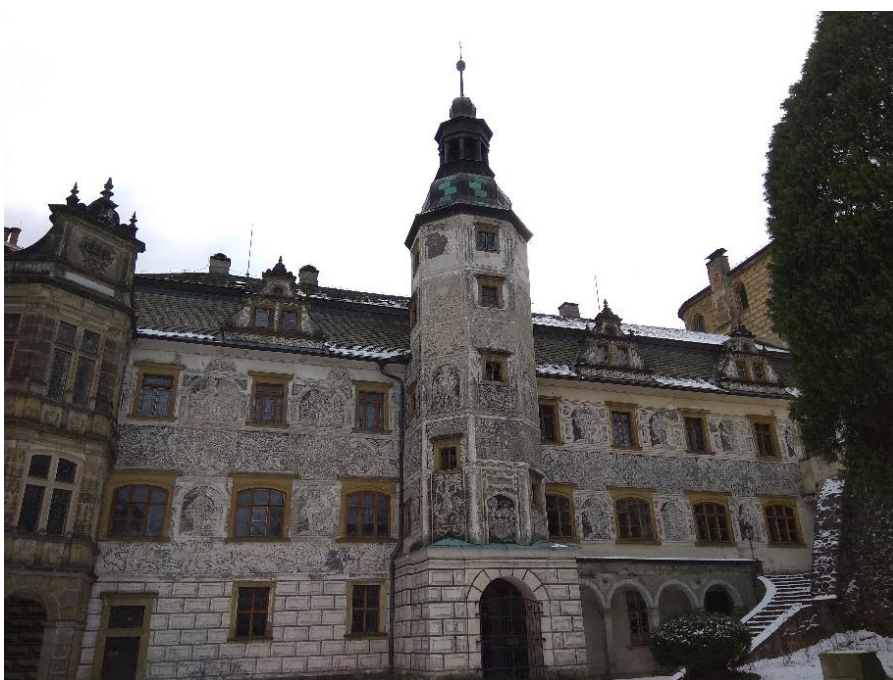
Obr. 3: Frýdlant, zámek, jižní fasáda dolního zámku s dochovanou sgrafitovou výzdobou