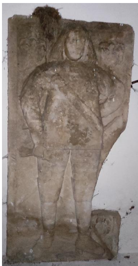
Obr. 12: Náhrobník Kašpara Kristiána ze Schweinichenu, 1644, pískovec, Andělka, hřbitovní márnice u kostela sv. Anny