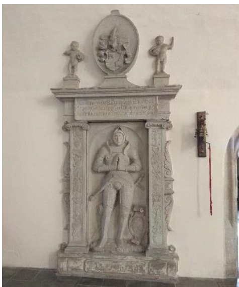
Obr. 10: Náhrobek Kryštofa z Biberštejnu, po 1551, pískovec, Frýdlant, kostel Nalezení sv. Kříže