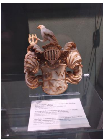
Obr. 7: Gerhard Hendrik, erb z epitafu Andrease Dudycza, 1589, alabastr, Vratislav, Městské muzeum (původně z baziliky sv. Alžběty)