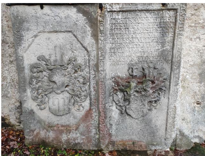
Obr. 14: Náhrobník Michaela z Eberhardtu a náhrobník Anny z Eberhardtu, pískovec, Dolní Oldříš, kostel sv. Martina