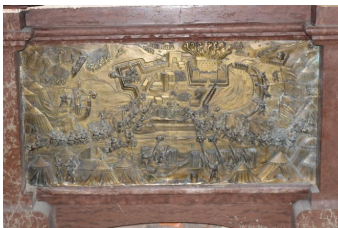
Obr. 40: Mauzoleum Melchiora z Redernu, 1605–1610, Frýdlant, kostel Nalezení sv. Kříže, reliéf s dobytím Pápy v centru soklu