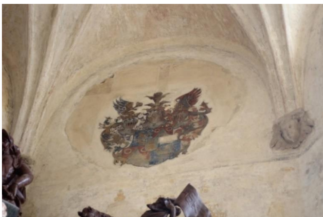
Obr. 13: Erb rodu Šliků, okolo 1600, nástěnná malba, Frýdlant, kostel Nalezení sv. Kříže, kaple Redernů