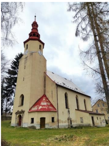
Obr. 7: Kostel Nanebevzetí Panny Marie v Nové Vsi u Chrastavy