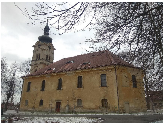
Obr. 8: Kostel sv. Kateřiny v Novém Městě pod Smrkem

Za vlády Kryštofa II. už téměř žádné stavební aktivity zaznamenány nejsou, nově zbudované šlechtické sídlo zřejmě přinášelo dostatečný komfort. Kryštof ale nechal dokončit kostel v Nové Vsi a nechal zde odlít kostelní zvon 164 .