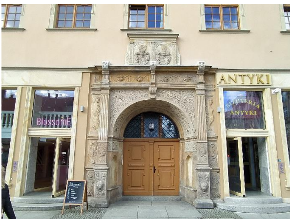
Obr. 5: Portál, Gerhard Hendrik, Vratislav, Kamienica pod Gryfami