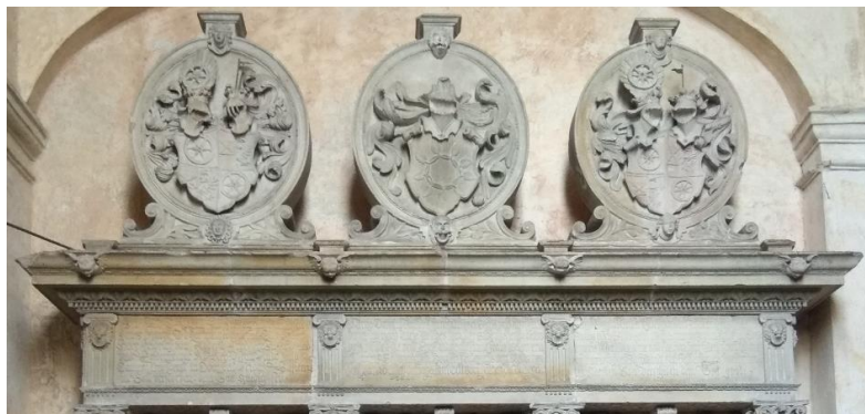
Obr. 18: Náhrobek Bedřicha z Redernu, jeho ženy Salomeny a jejich syna Bedřicha ml., 1565–1566, Frýdlant, kostel Nalezení sv. Kříže, vlys a korunní římsa s rodovými erby

Nad postavami lvů vyrůstají z kvádrových soklů, zdobených oválnými rolverkovými kartušemi v obdélníkových polích, na kterých se objevují motivy lidských lebek, třičtvrtě sloupy. Spodní části dřiků jsou bohatě zdobeny; v centru je lidská figura, na níž jsou navázány další florální, geometrické a mýtické zvířecí motivy, které celkově vytvářejí fantaskně groteskní kompozici evokující nizozemské vlivy. Za sloupy se nacházejí tři velké nehluboké niky, do nichž jsou umístěny téměř volné figurální postavy zemřelých Redernů, vždy s dvojicí ctností ve cviklech 204 . Korintské hlavice a konzoly s rostlinným motivem podpírají mohutný architráv kladí. Vlys je rozdělen na čtyři triglyfy oddělené drobnými pilastry s íónskými hlavicemi a lví hlavou s kruhem v tlamě. Metopy obsahují tři rozsáhlá textová pole, 205 která šířkou kopírují niky, v nichž jsou umístěny postavy. Korunní římsa je taktéž zaplněna dekorem a lemují ji andělčí hlavičky v ose lvích hlav. Celý náhrobek je zakončen mohutnými erby v oválných kartuších s volutami a dvěma maskaróny (pokaždé odlišnými). Na obou koncích se nachází znak Redernů, uprostřed erb se znakem pánů ze Schönaichu.