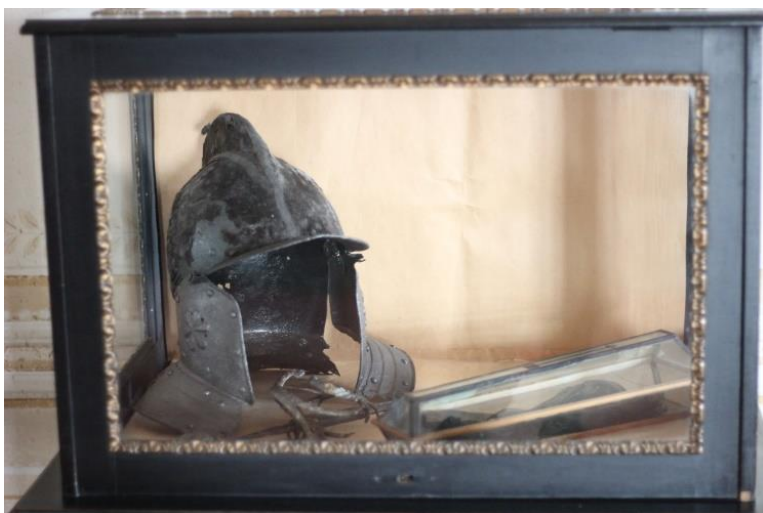
Obr. 15: Kosterní pozůstatek Melchiora z Redernu, část bodné zbraně a přilba, zámek Frýdlant