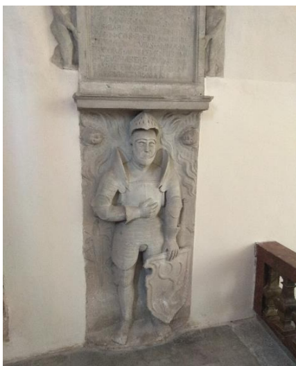
Obr. 9: Náhrobek Jana VI. z Biberštejnu, po 1550, pískovec, Frýdlant, kostel Nalezení sv. Kříže