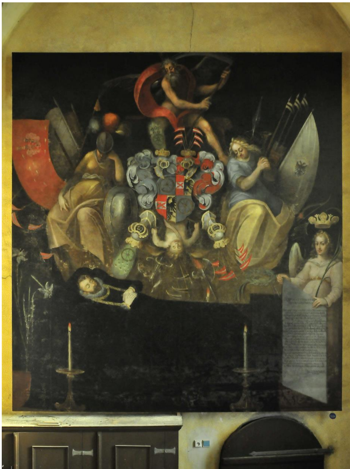
Obr. 36: Posmrtný portrét Melchiora z Redernu, 1600–1601/1601–1605, Frýdlant, kostel Nalezení sv. Kříže