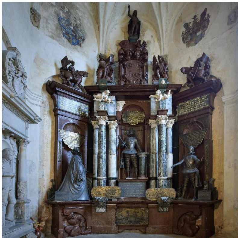
Obr. 37: Mauzoleum Melchiora z Redernu, 1605–1610, Frýdlant, kostel Nalezení sv. Kříže

Přístěnné monumentální mauzoleum je vytvořeno z několika druhů mramoru, bronzu a alabastru. Architektura náhrobku je vytvořena z červeného mramoru a je vertikálně rozdělena do tří pásů, podle postavy, která je zde zobrazena. Horizontálně je architektura členěna na sokl, střední nejvyšší část s postavami, nápisy a reliéfy, a nakonec na volné sochy starozákonních proroků, redernský erb a sochu zmrtvýchvstalého Krista.