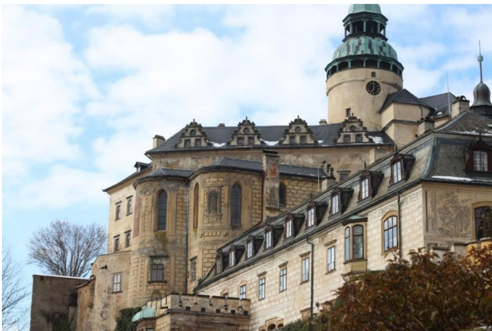
Obr. 2: Areál hradu a zámku Frýdlant - v pozadí věž Indica, v popředí dolní zámek a kaple sv. Anny