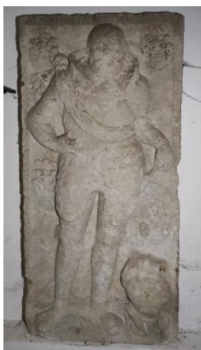
Obr. 11: Náhrobník Adama ze Schweinichenu, 1610, pískovec, Andělka, hřbitovní mármice u kostela sv. Anny