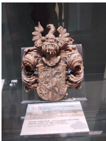
Obr. 6: Gerhard Hendrik, erb z epitafu Andrease Dudycza, 1589, alabastr, Vratislav, Městské muzeum (původně z baziliky sv. Alžběty)