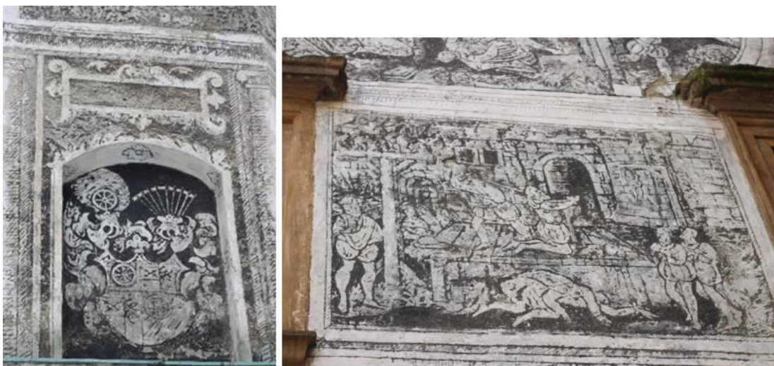
Obr. 4–5: Frýdlant, zámek, detaily sgrafitové výzdoby dolního zámku, jižní fasáda