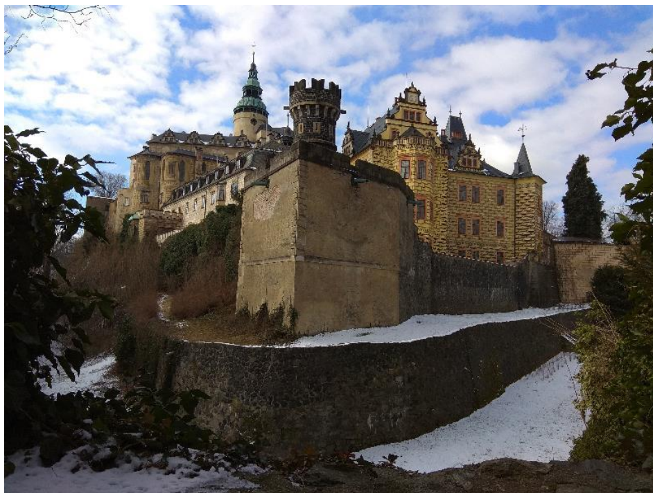
Obr. 1: Areál hradu a zámku Frýdlant, pohled z východu