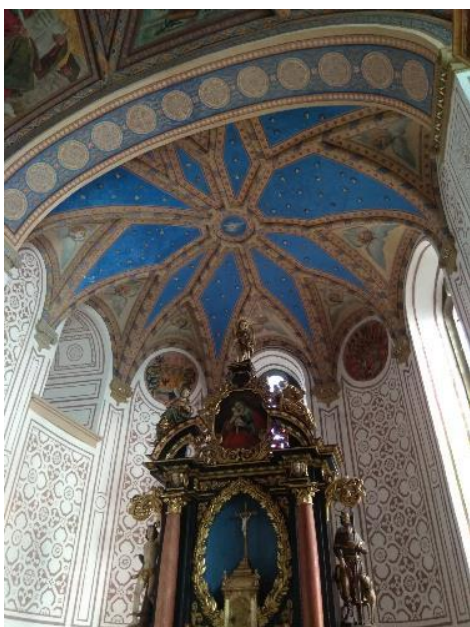
Obr. 6: Frýdlant, zámek, kaple sv. Any, klenba