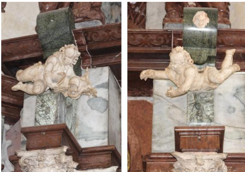
Obr. 42–43: Mauzoleum Melchiora z Redernu, 1605–1610, Frýdlant, kostel Nalezení sv. Kříže, putti držící přilbici a pozůstatek vavřínového věnce