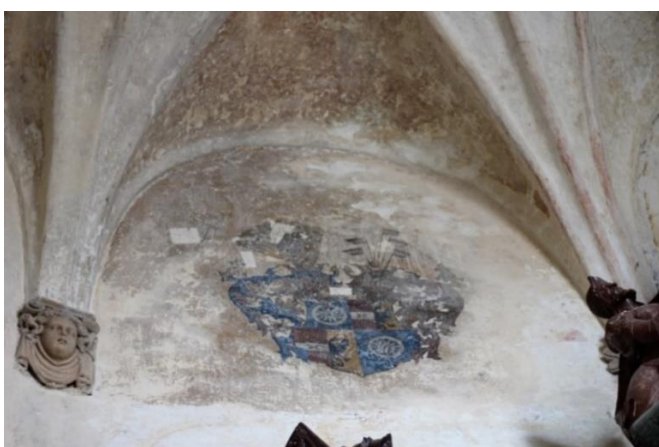
Obr. 14: Erb rodu Redernů, okolo 1600, nástěnná malba, Frýdlant, kostel Nalezení sv. Kříže, kaple Redernů

Kapli s náhrobky vyloupili a poškodili pravděpodobně už Švédové při obsazení Frýdlantu mezi lety 1634–1639 a později také prusí vojáci během války o rakouské dědictví a za Sedmileté války. 196 Rovněž krypta byla za třicetileté války vyplněna; cínové rakve byly vypáčeny, zmizely šperky a zmizela i cínová rakev, ve které byla dřevěná truhla s ostatky Melchiora. 197 Krypta byla několikrát otevřena, naposledy 2. července 1908, o čemž nás zpravuje Metzger. 198