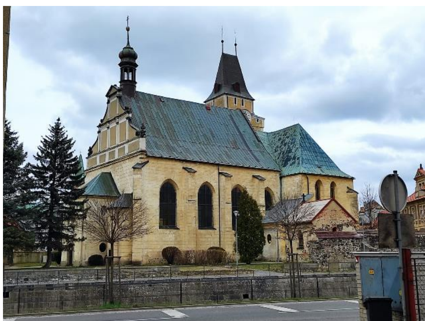
Obr. 9: Frýdlant, kostel Nalezení sv. Kříže, pohled z jihu

Kostel se nachází v těsné blízkosti řeky Smědé obtékající město Frýdlant na jihu. Kostel je situovaný poblíž centra městu; je spojen ulicemi Kostelní a Děkanská s náměstím (dnes náměstí T. G. Masaryka). Součástí areálu kostela je novogotická kaple Krista v žaláři z roku 1858, sloup se sochou Panny Marie Immaculaty vztyčený původně na frýdlantském náměstí roku 1723, 165 a hospodářská budova a budova fary, poprvé zmiňována již 1557, ale přestavěna roku 1694. 166 Kolem kostela se dříve rozprostíral městský hřbitov, 167 jenž byl ohraničený dodnes stojící kamennou zdí, na které se dochovala část zastavení křížové cesty.