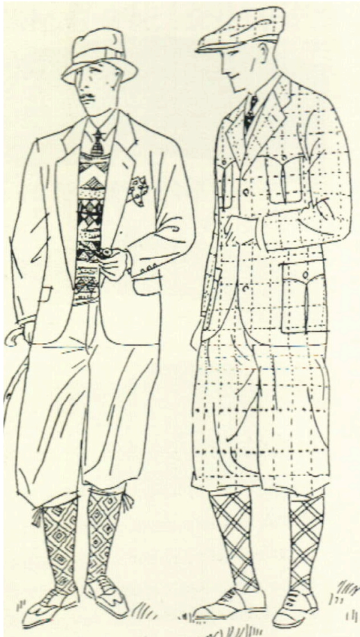
Obrázek 6: Sportovní oděv s pumpkami, 1925