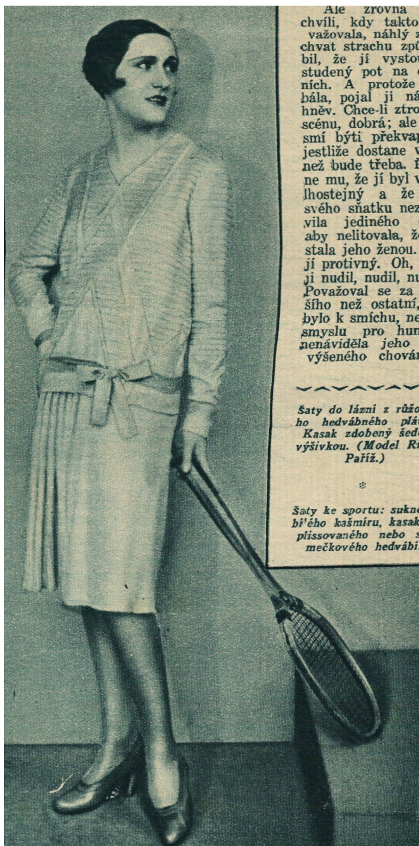
Obrázek 7: Tenisový oděv, 1928