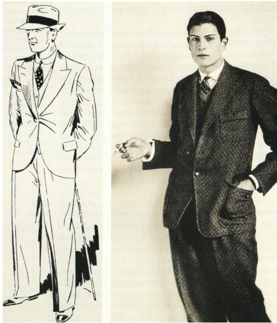
Obrázek 2: Pánský oblek, 1926

Zdroj: KYBALOVÁ, Ludmila. Od "zlatých dvacátých" po Diora . s. 88.