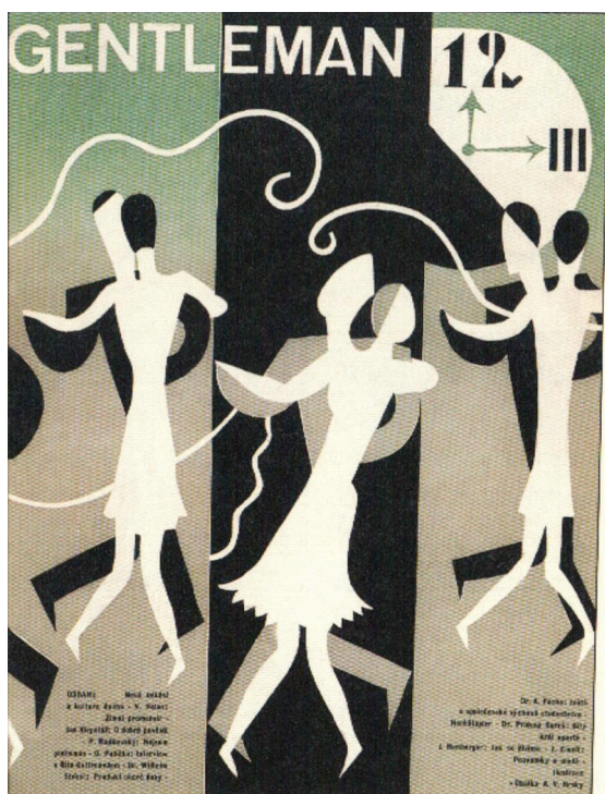
Obrázek 11: Obálka časopisu Gentleman, 1926

Zdroj: UCHALOVÁ, Eva. Česka móda, 1918-1939 . s. 46.