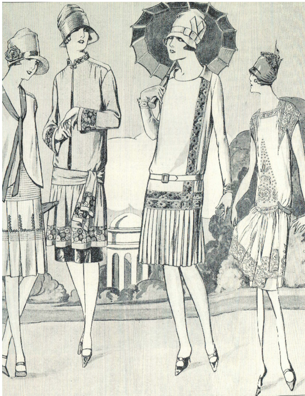
Obrázek 1: Dámský letní oděv s nízko posazeným pasem a se sukní těsně pod koleno, 1927

Zdroj: KYBALOVÁ, Ludmila. Od "zlatých dvacátých" po Diora . s. 47.