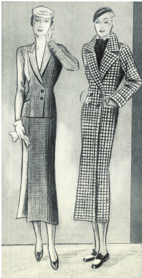
Obrázek 3: Dámský kostým s prodlouženou sukni, 1933