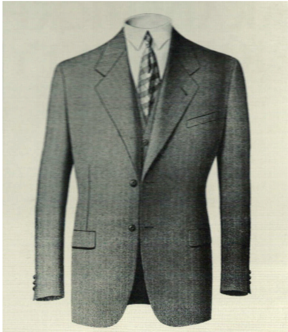
Obrázek 4: Pánské jednořadové sako, 1934