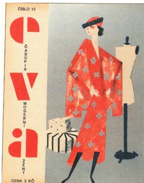
Obrázek 10: Obálka časopisu EVA, 1934