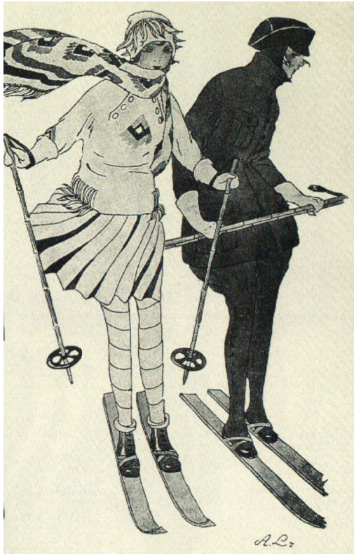
Obrázek 8: Lyžařský oděv začátkem 20. století

Zdroj: UCHALOVÁ, Eva. Česka móda, 1918-1939 . s. 57.