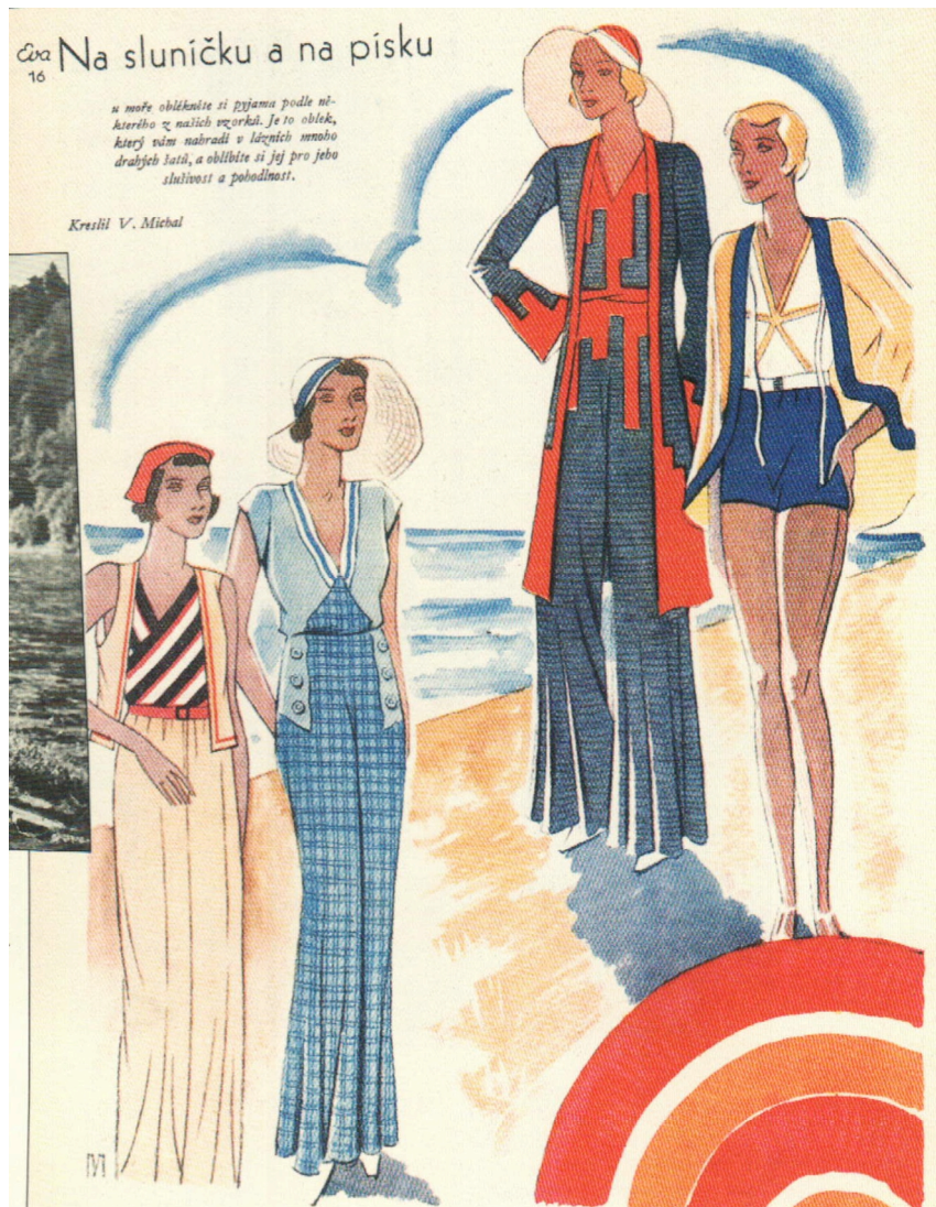
Obrázek 13: Plážová pyžama, 1931