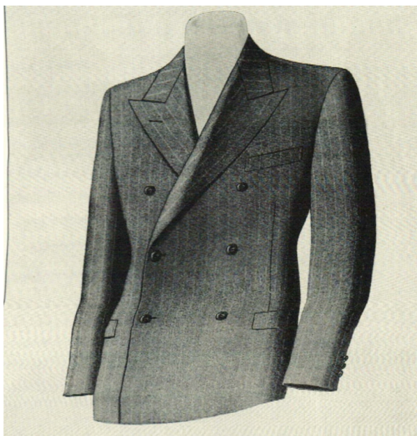
Obrázek 5: Pánské dvouřadové sako, 1934

Zdroj: UCHALOVÁ, Eva. Česka móda, 1918-1939 . s. 106.