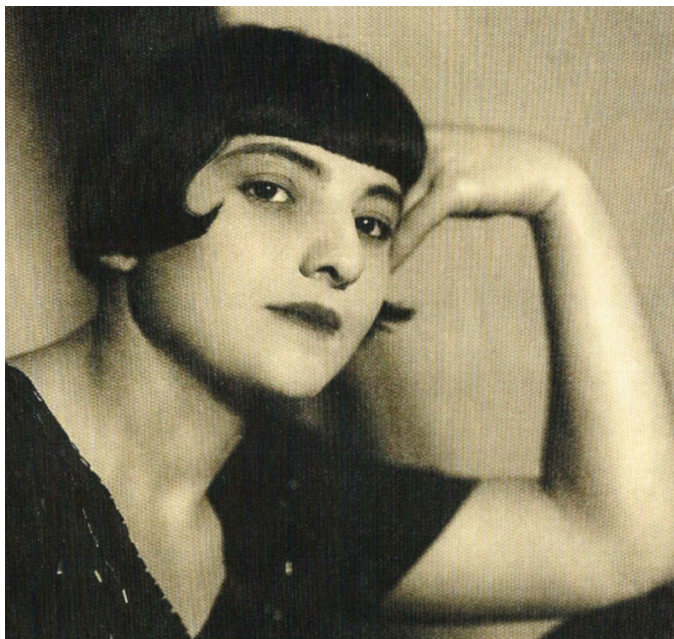
Obrázek 9: Pážecí účes z roku 1925