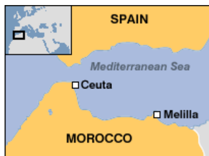
Obr. 3: Španělské enklávy Ceuta a Mellila na území Maroka. 74

a Afrikou, „bohatým Severem a chudým Jihem“. 73