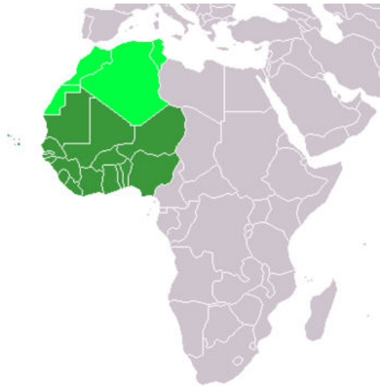
Obr. 2: Země Maghrebu a Subsaharské Afriky

K zemím Maghrebu 38 náleží Západní Sahara, Maroko, Alžírsko a Tunisko.