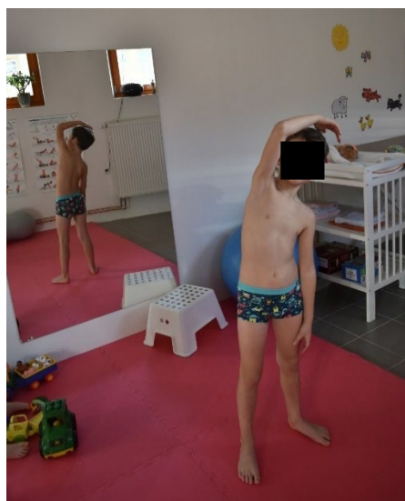
Cvik č. 11 - Protážení musculus serratus anterior