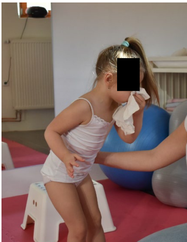
Cvik č. 18 - Návčik smrkání