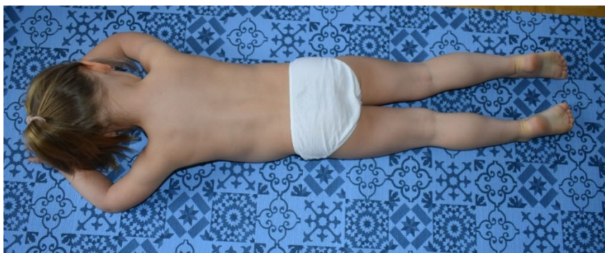
Cvik č. 9 - Tříměsíční dítě dle DNS vleže na břiše – s nádechem odlepuji hlavu od podložky a tlačím lokty do země.