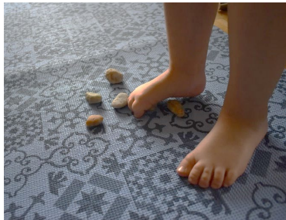
Cvik č. 14 - Senzorická stimulace plosky nohy