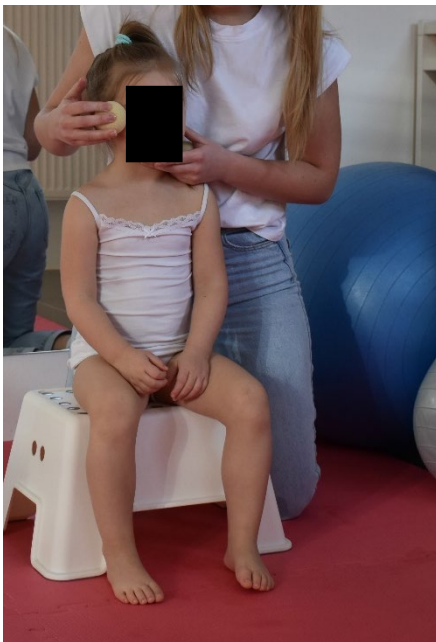
Cvik č. 16 - Míčková facilitace pro uvolnění obličejových svalů