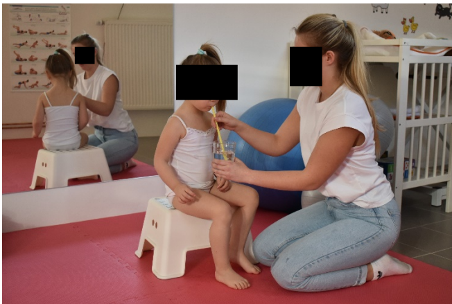
Cvik č. 15 - Nácvik prodlouženého výdechu pomocí brčka do sklenice s vodou