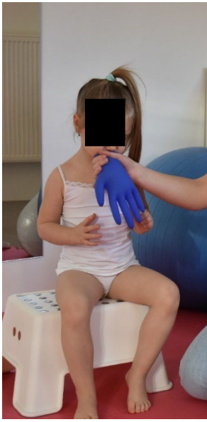
Cvik č. 17 - Návčik prodlouženého výdechu proti odporu rukavice