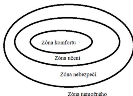
Obrázek 3 Schéma oblasti komfortu 18

Pokud se mluví o rozvoji osobnosti v kontextu zážitkové pedagogiky, je tím primárně myšlena právě práce se zónou komfortu.