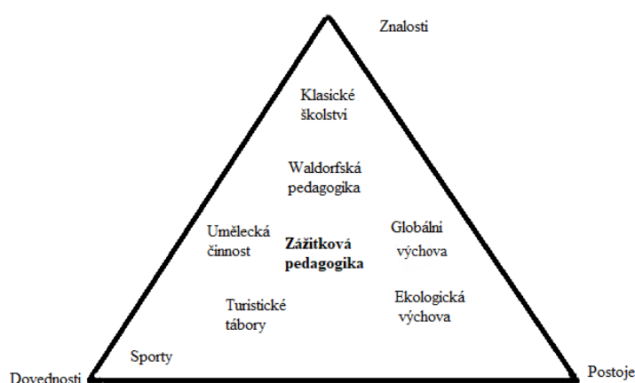
Obrázek 1 Pedagogické směry a jejich zaměření 7

Skrze výchovu a vzděláváním, můžeme pozitivně ovlivňovat tři zdroje lidského chování a jednání. Jedná se o dovednosti, postoje a znalosti. Každý z pedagogických směrů využívá jiný systém k dosažení svých cílů a tím i jejich cíle se liší dle zaměření na tyto tři faktory. (viz. Obr. 1)