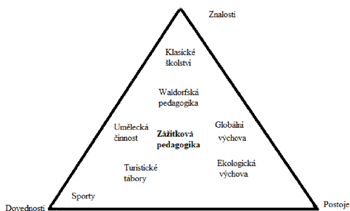
Obrázek 1 Pedagogické směry a jejich zaměření 7

Skrze výchovu a vzděláváním, můžeme pozitivně ovlivňovat tři zdroje lidského chování a jednání. Jedná se o dovednosti, postoje a znalosti. Každý z pedagogických směrů využívá jiný systém k dosažení svých cílů a tím i jejich cíle se liší dle zaměření na tyto tři faktory. (viz. Obr. 1)