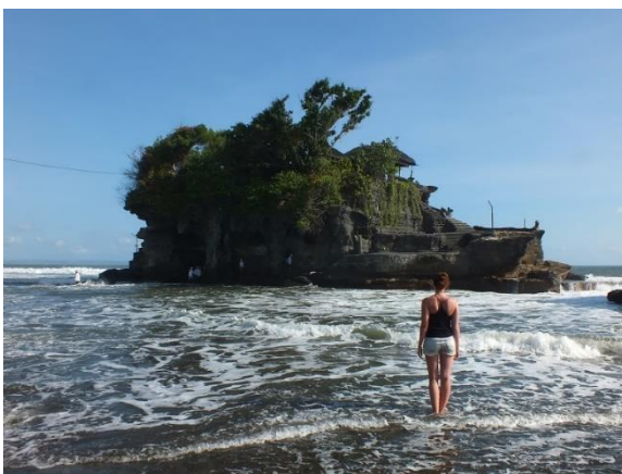
Obr. 6: Tanah Loh temple. Foto: Autor, 2016

Jednou z negativních stránek návštěvy Bali může být výskyt kapesních lupičů, na které je třeba si dávat pozor na ulicích. O Indonésii je také známé, že místní vidí v turistech zdroj příjmu, a tak jsou ceny pro cizince často naceněny, přičemž následuje dlouhé smlouvání. Místní se tím ovšem často baví a ceny nejprve zvednou právě za účelem smlouvání s cizinci, ve kterém se vyžívají. Bali je však nádherný přátelský ostrov, který je díky své výjimečnosti řazen na vrchol destinací cestovního ruchu.