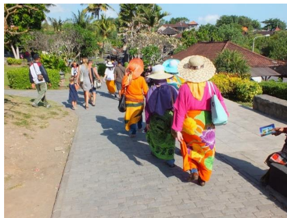
Obr. 9: Cestovní ruch na Bali. Foto: Autor, 2016