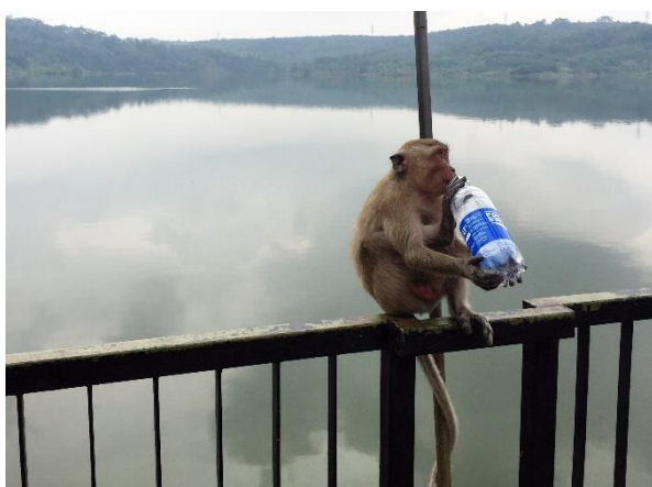
Obr. 1: Opičí rezervace na Jávě.

Podle UNWTO (2015) by měl být zvýšen důraz také na sociokulturní autenticitu navštěvovaných komunit, což přispívá k zachování kulturní rozmanitosti a mezikulturnímu porozumění. Nakonec by měly být v rámci cestovního ruchu zajištěny takové hospodářské operace, které poskytují výhody všem zúčastněným stranám a pomáhají zvýšit příjmy a zaměstnanost v navštěvované oblasti (UNWTO, 2015).