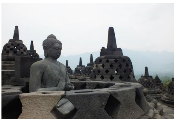
Obr. 4: Borobudur.

Jedním z důležitých bodů jsou ceny. Indonésie je poměrně levnou destinací, avšak většinou cenu zájezdu tvoří letenka, která při včasné koupi přijde zhruba na 20.000 Kč. Na druhou stranu, ceny ubytování a stravování jsou na Jávě nízké. Není problém ubytovat se ve slušném hotelu v turistických centrech jako jsou Jakarta nebo Yogyakarta, ani v méně známých městech jako je například Semarang. Lowcost cestovatelé poté mohou zvolit hostely nebo homestay. Ceny jídla jsou zde také velice příznivé, se snídaní, obědem i večeří je možno vejít se do 150 Kč. Zato na vstupech jakéhokoliv charakteru si cizinci připlatí někdy i trojnásobek ceny pro místní. Po návštěvě Jávy se ovšem mohou cestovatelé chlubit, že zažili „pravou“ Indonésii.