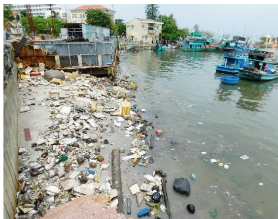
Obr. 2: Městský přístav ve Vietnamu.