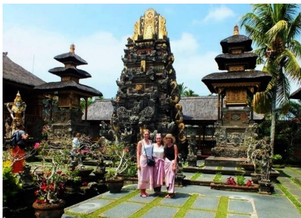
Obr. 8: Zahalené turistiky v hinduistickém chrámu.

Jak již bylo zmíněno, Balijsci si na kulturu potrpí. Ač se odpovědi respondentů zprvu lišily, došli vždy ke stejnému závěru. Obě české respondentky uvedly, že kulturně-historické památky slouží jako turistické atrakce, ačkoli v několika z nich stále žijí mniši. Se stejným názorem přišel také český cestovatel, podle něhož slouží většina hinduistických chrámů k původním účelům, i když tam mají turisté přístup, za předpokladu uctivého chování a vyzutých bot. Vstup do chrámů bývá bezplatný, nebo za symbolickou částku indonéských rupií. Indonéské respondentky se k tomuto názoru také přidaly a doplnily, že si místní potrpí na čistotu míst spjatých s vírou a ceremoniály všeho druhu. I když se na první pohled může zdát, že jde místním jen o čistou víru a udržení tradic, je nutno připočíst fakt, že se jedná o velký magnet pro turisty, což si Balijsci dobře uvědomují a snaží se tak z turismu vytěžit maximum.