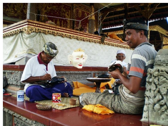
Obr. 7: Výroba masek pro hinduistický ceremoniál.