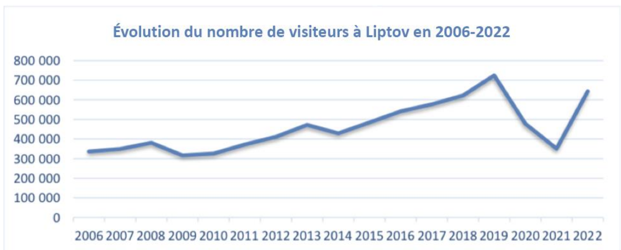
Graphique 1: Évolution du nombre de visiteurs en 2006-2022 (Source: https://www.visitliptov.sk/ , 2022)

Pour conclure, le tourisme dans la région de Liptov s'est progressivement rétabli après la pandémie de covid-19, mais la croissance attendue cette année pourrait être affectée par la crise énergétique, la hausse de l'inflation et la baisse du pouvoir d'achat de la population. Les coûts élevés de l'énergie ont entraîné la fermeture de certaines installations d'hébergement dans les endroits éloignés des stations de ski pendant la saison d'hiver 2023. Le conflit militaire en Ukraine constitue également une menace pour le développement du tourisme. Vu que l'Ukraine est le pays voisin de Slovaquie les clients des marchés plus éloignés préfèrent choisir des destinations plus éloignées du conflit militaire. Malgré l'impact négatif de l'environnement extérieur, la région de Liptov enregistre une augmentation du nombre de visiteurs de Hongrie, de Lituanie, de Pologne, de Roumanie, mais aussi du Royaume-Uni.