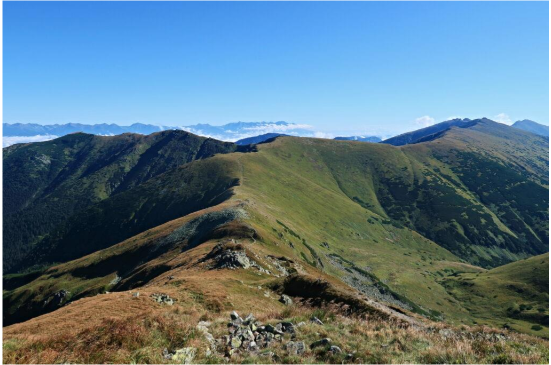
Image 4: Le parc nation des Basse Tatras