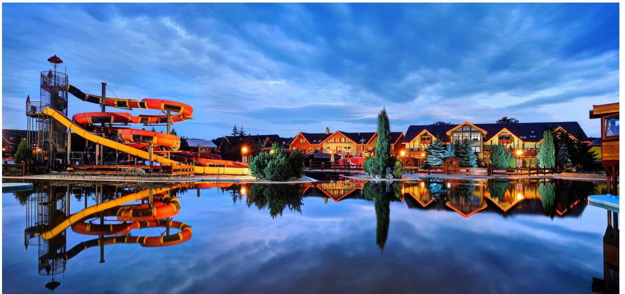
Image 6: Aquapark Bešeňová

Bešeňová offre aux visiteurs une combinaison de loisirs, de détente et de divertissements aquatiques. Avec des piscines thermales, ses attractions aquatiques, ses installations de bien-être et son environnement familial, il constitue un excellent moyen de se détendre et de vivre une expérience mémorable à Liptov.