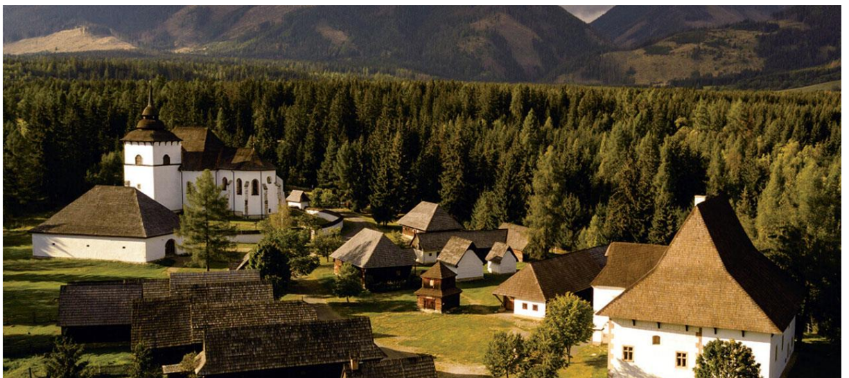
Image 9 : Musée de Pribylina

Le musée accueille également diverses expositions ethnographiques et manifestations culturelles qui mettent en valeur l'artisanat traditionnel, les coutumes populaires et les spectacles. Les visiteurs peuvent assister à des démonstrations de savoir-faire traditionnels tels que la poterie, le tissage ou la forge. Des festivals folkloriques et des événements culturels ont lieu tout au long de l'année, donnant l'occasion de découvrir les traditions et les célébrations locales.