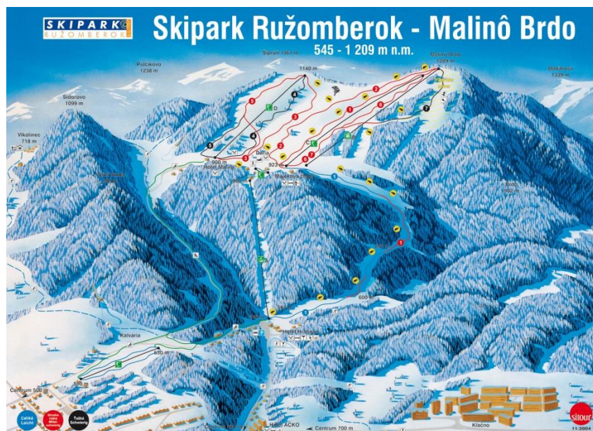
Image 1: La station de ski de Malinô Brdo