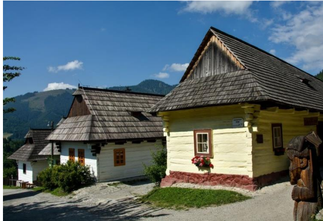
Image 7: Vlkolínec

La visite de Vlkolínec offre une occasion unique de remonter le temps et de découvrir les traditions rurales et le patrimoine architectural de la Slovaquie.