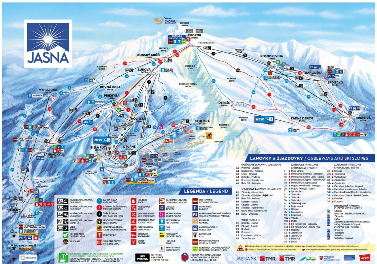
Image 3: La station de ski Jasná Nízke Tatry

Outre les sports d'hiver, Jasná Nízke Tatry propose des activités récréatives pendant les mois d'été la randonnée. Le VTT et l'exploration de la beauté naturelle des Basses Tartes sont des options populaires.