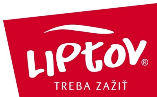
Image 10: Logo de cluster Liptov