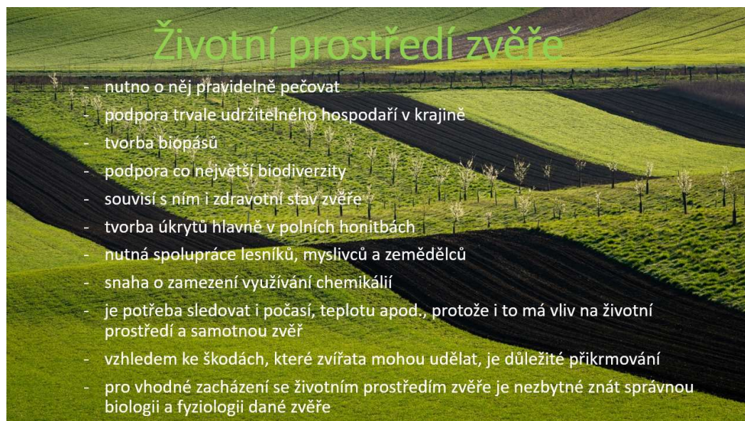
Obrázek č. 3: Krátká prezentace z brainstormingu

Brainstorming (Obr. č. 3): Žáci se rozdělí do skupin po 5. Stanoveným tématem tentokrát je životní prostředí zvěře. Žáci ve skupině sepisují vše, co vědí nebo co si myslí, že o daném tématu ví. Vzhledem k jejich počtu dostanou žáci pro brainstorming desetiminutový interval. Následuje prezentace textu/myšlenek před celou třídou.