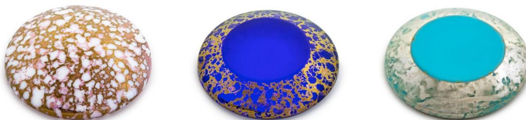
a. Cabochon round

Materiál pochází ze skloviny z Preciosa Ornela. Průměr je 40 mm, výška 1012 mm a váha je 2225 g. (pulirna.com 2022)