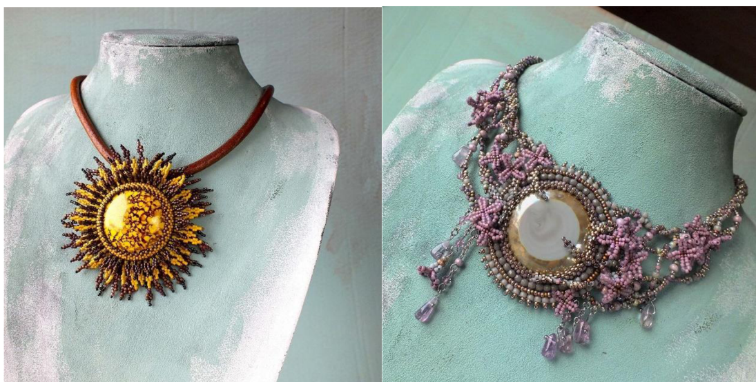
Obrázek 111: Vzor pro použití Cabochonu round

Například Nela Kábelová z Moravy vyrábí a dává k dispozici mnoho návodů, jak kameny obšívát, a právě ona vytvořila jako vzorek pro použití Cabochonu tyto dva šperky: