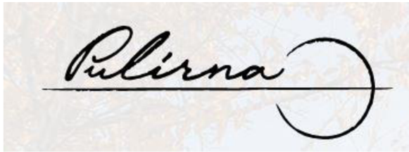
Obrázek 133: Nové logo firmy – Pulirna