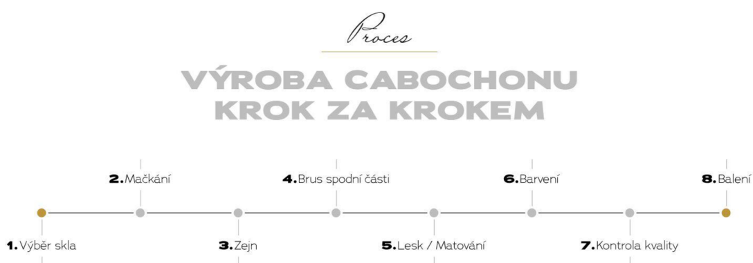
Obrázek 122: Popis výrobního procesu Cabochonu round

Jeho výrobní proces je poměrně zdlouhavý a složitý, jak lze vidět na popisu výrobního procesu vyobrazeného na obrázku č. 12, ale jen díky tomu je pak výsledek jedinečný.