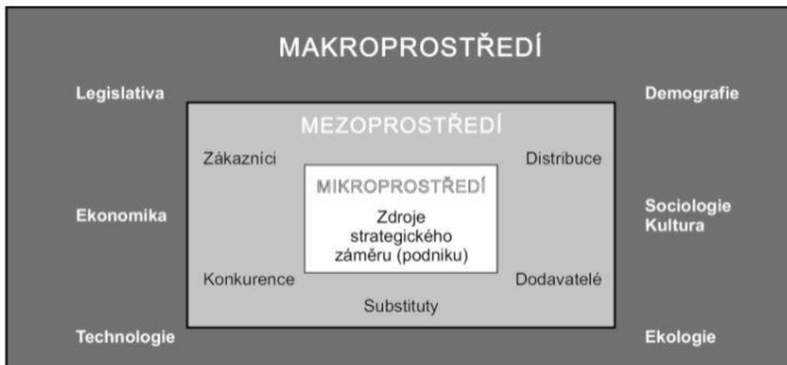
Obrázek 2: Podnikatelské prostředí

K analýze prostředí se používá jedna z neznámějších metod a sice SWOT analýza (Strengths, Weaknesses, Opportunities, Threats). SWOT analýza je univerzální metodou, neboť analýza silných a slabých stránek se používá pro analýzu interního prostředí a příležitosti a hrozby k analýze externího prostředí. (Fotr a spol. 2020)