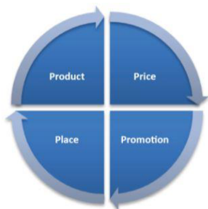
Obrázek 5: Marketingový mix 4P

Tedy marketingová strategie se týká obecných politik pro produkt, cenu, komunikaci a distribuci , jak znázorňuje obrázek č. 5. (Westwood 2020)