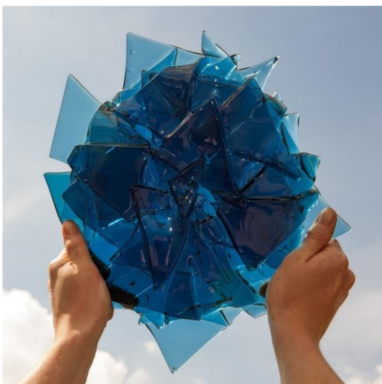
Obrázek 9: Skleněná plastika

Výroba je založena především na tradičních postupech ale i nových technologiích a hlavně pečlivosti, se kterou je každý jeden produkt vyráběn. (jkglass.cz 2013)