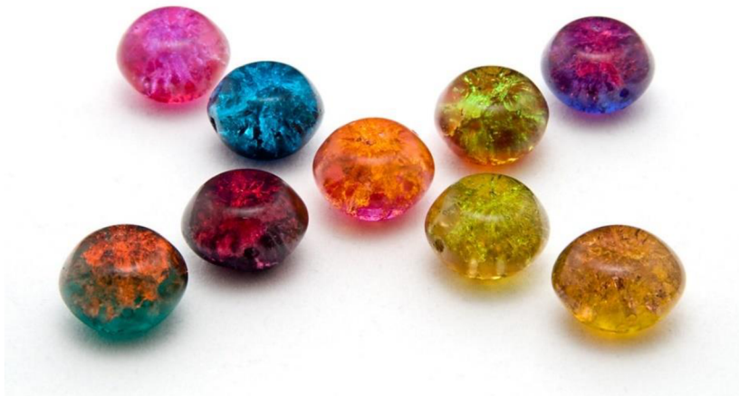
Obrázek 8: Práskané perle

Rodinná firma JKglass nacházející se v malé vesničce jménem Nová Ves se zabývá tepelným zpracováním skla a bižuterie již po 3 generace. Poskytuje jak pouze zušlechťovací služby například v podobě tepelného leštění skla, tak i prodej hotových výrobků, které nakoupí jako polotovar, zušlechtí a nabídne k prodeji. Její specialitou jsou především “ Práskané perle “, které jsou zobrazeny na obrázku č. 8, díky kterým má firma své stálé a dlouholeté zákazníky. Dále se firma věnuje například temperaci skleněných výrobků a částečně i výrobě skleněných plastik.