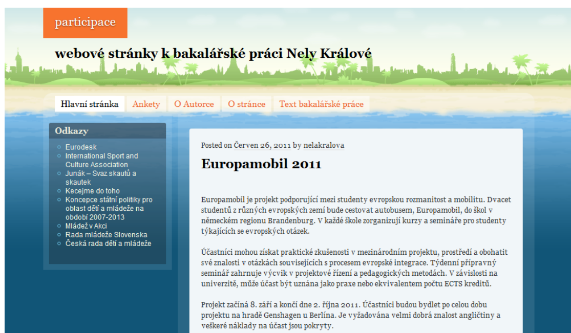
Obr. 1: Náhled webových stránek participace.wordpress.com

Webové stránky slouží jako zdroj inspirace a jsou zde zveřejněny konkrétní nabídky k účasti mladých lidí. Zájemci se také mohou dozvědět více informací ze seznamu odkazů týkajících se problematiky nebo se zapojit do ankety.