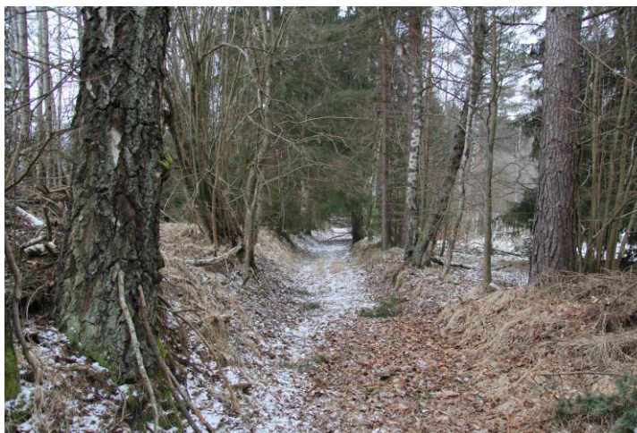
Pozůstatky Zlaté stezky u Blažejovic