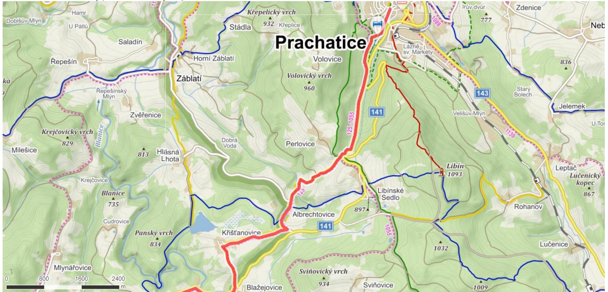
Prachatická větev Zlaté stezky (Prachatice – Blažejovice)