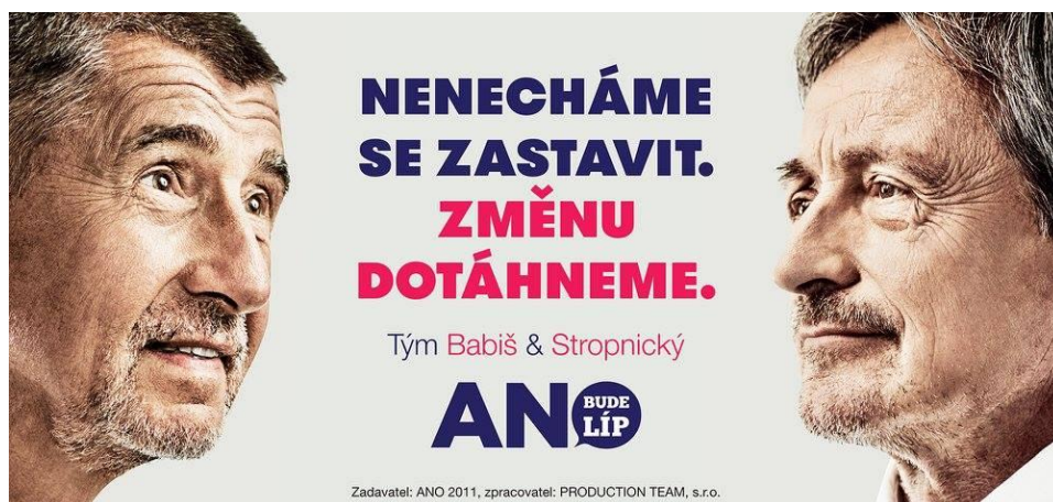
Obrázek 3: Hnutí ANO v rámci volební kampaně v roce 2017