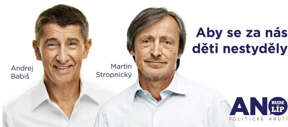
Obrázek 1: Hnutí ANO v rámci volební kampaně v roce 2013

ztráty zaměstnání, proto hledají politický subjekt, který jim dá naději na řešení jejich problémů a pomůže jim se s nimi vypořádat. Použitím množného čísla „my“ je naznačeno, že se členové ANO prezentují jako ti z lidu, nikoliv politici, kteří, jak je z výroku patrné, neumějí problém nezaměstnanosti řešit. (ANO 2011, 2013a)