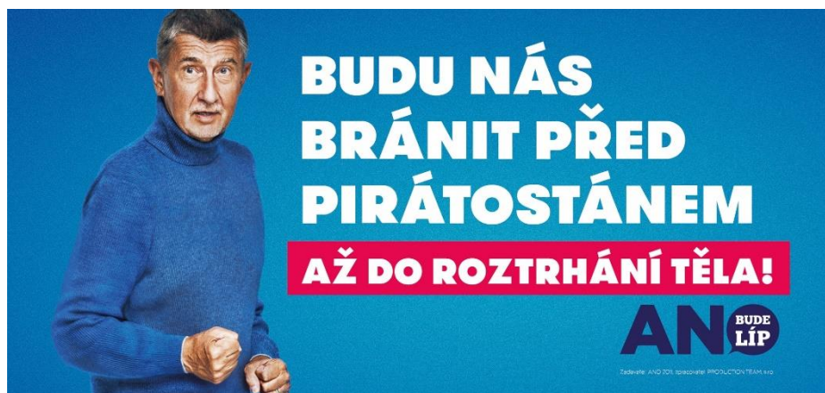
Obrázek 5: Hnutí ANO v rámci volební kampaně v roce 2021