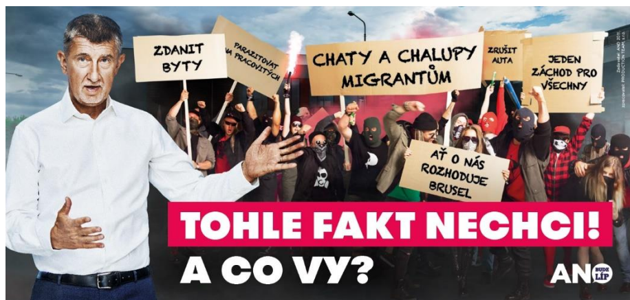
Obrázek 4: Negativní kampaň hnutí ANO v roce 2021