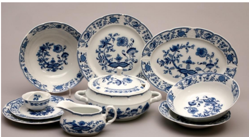
Příloha č. 18 – Objekty současného porcelánky Thun 1794, a. s. v Nové Roli