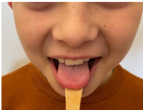
Obr. 16 Jazyk na špátli