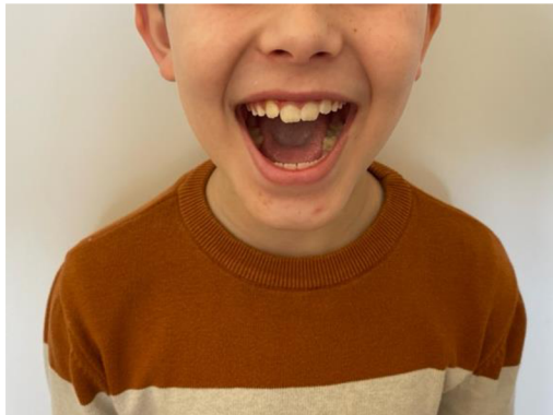
Obr. 18 Otevírání úst