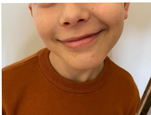
Obr. 7 Tah ústních koutků