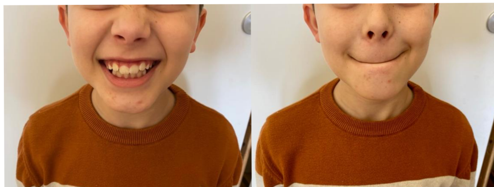
Obr. 5 Vzteklý pejsek