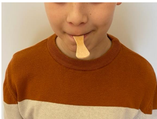
Obr. 1 Uzavírání úst