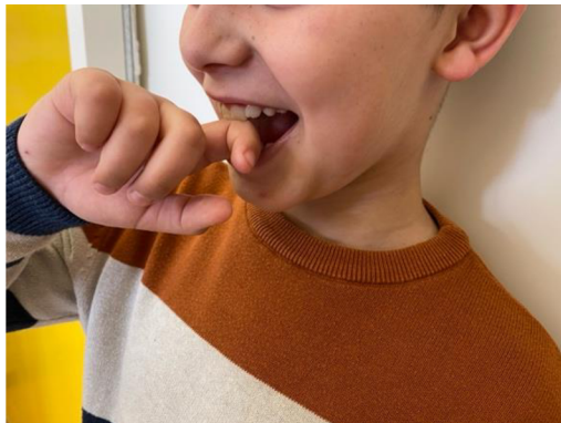
Obr. 21 Rozevření čelistí