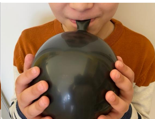
Obr. 2 Nafukování balónku