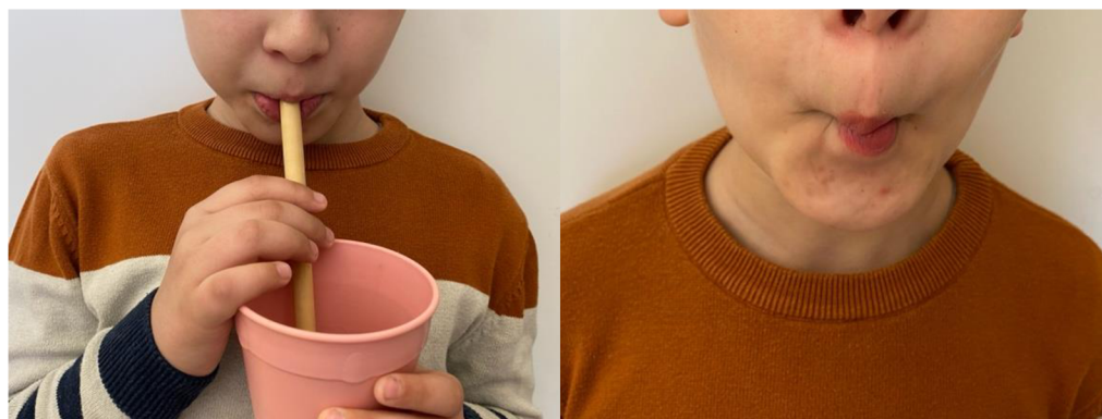
Obr. 26 Pítí z brčka