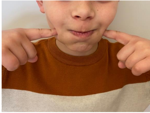
Obr. 23 Hra na balónek