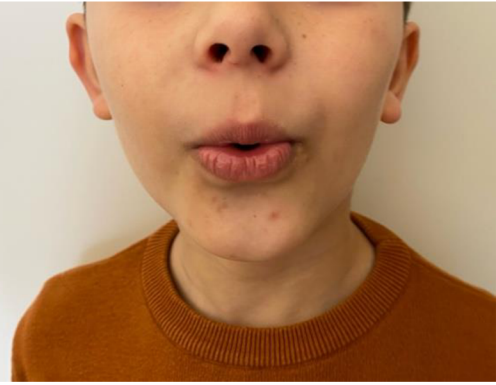
Obr. 24 Pískání