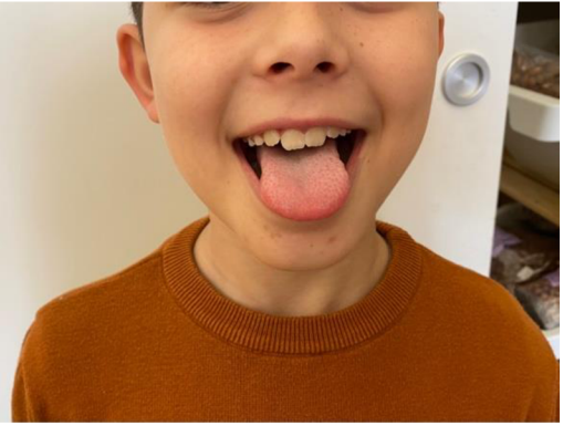
Obr. 13 Čertík