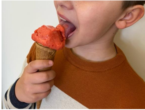
Obr. 12 Lizání zmrzliny