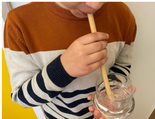
Obr. 25 Bublající potůček