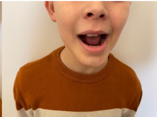
Obr. 22 Kroužení čelistí