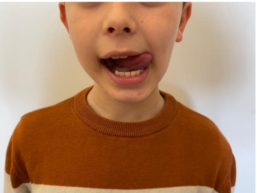
Obr. 15 Ještěrka