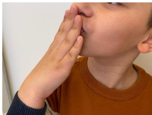
Obr. 3 Posílání pusinek