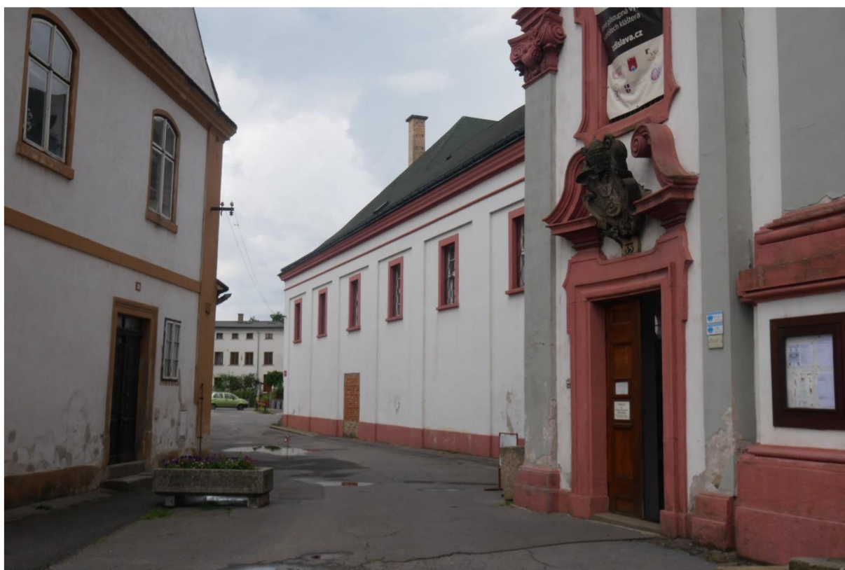
OBRÁZEK 3 – Dominikánský klášter.

c) Dole v Jablonném, uprostřed osady, kde vstanou základy nového chrámu, sroubili lešení pro síň prozatímní, rozlehlou a pustou, jež jen vzdáleně připomíná špitál Anežčin. 105