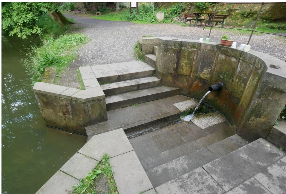
OBRÁZEK 5 – Studánka.