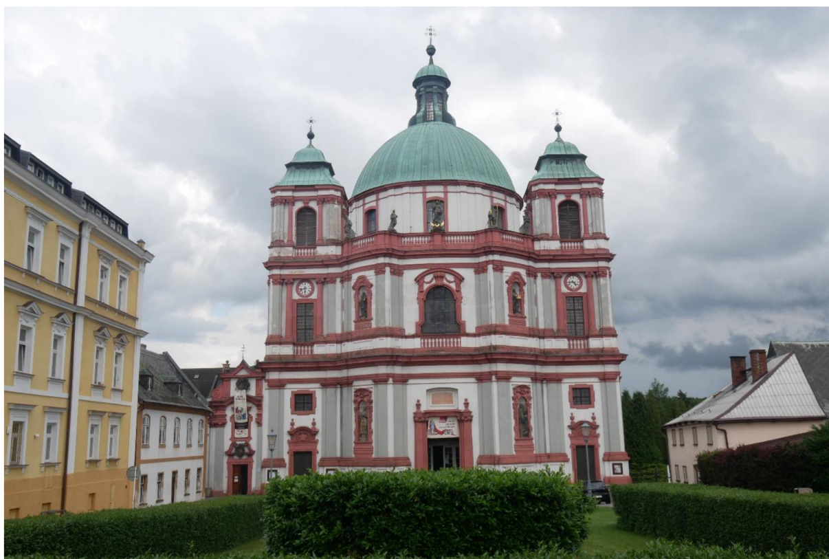
OBRÁZEK 4 – Bazilika sv. Vavřince a sv. Zdislavy.