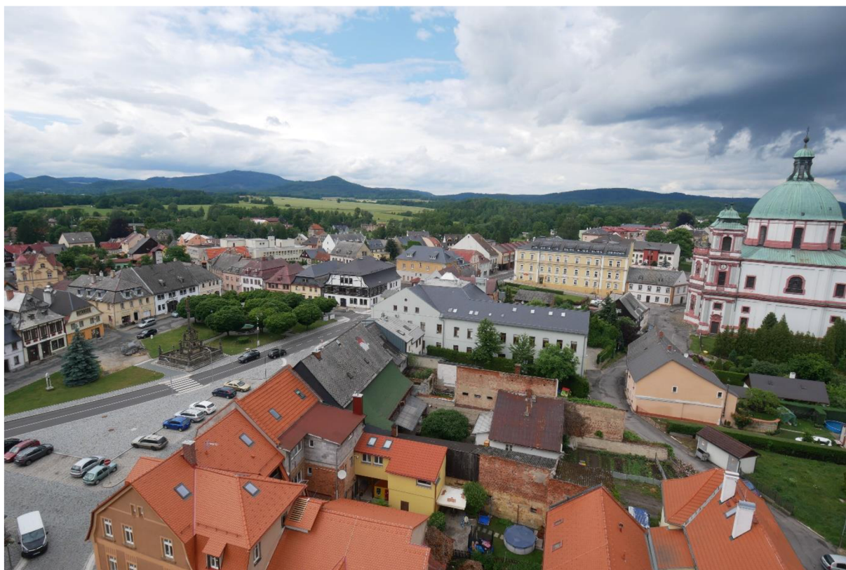
OBRÁZEK 2 – Jablonné v Podještědí.

Dalším významným místem je samotné město Jablonné v Podještědí (obrázek 2), do kterého Zdislava docházela a pomáhala jej společně s Havlem a příslušníky dominikánského řádu budovat. V samotném městě pak leží další z významných míst – klášter (obrázek 3), jenž zde kolem roku 1250 nechali s přispěním Havla a Zdislavy z Lemberka vystavět dominikáni. Dnešní podobu kláštera přehlušuje vystavěná majestátní budova baziliky sv. Vavřince a sv. Zdislavy (obrázek 4), jež byla vystavěna na počest Zdislavy na místě původního kostela. Zmiňovaná je také Česká Ves, jež je součástí města a leží na kopci, přes který dnes vede silnice směrem na Českou Lípou.