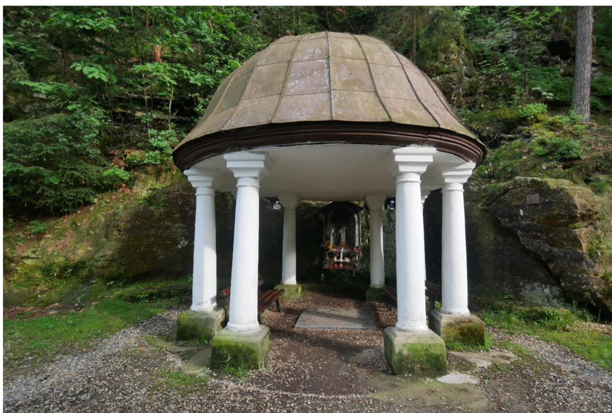
OBRÁZEK 6 – Studánka altán.