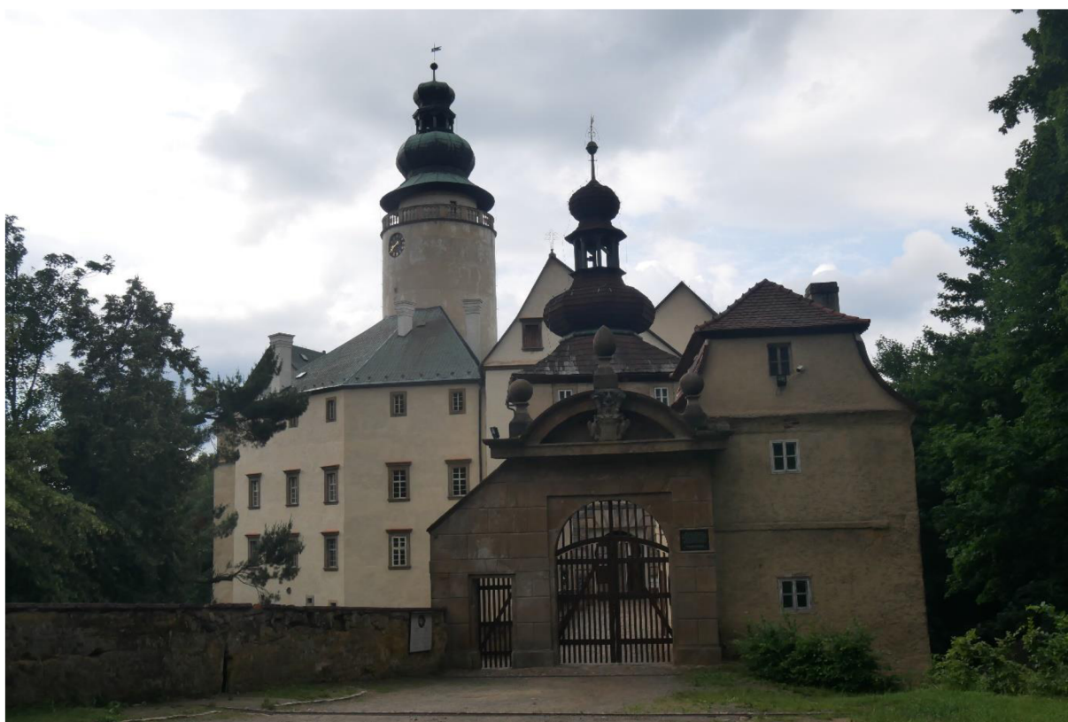
OBRÁZEK 1 – Lemberk.

Prvním místem Zdislavina pobytu je hrad Lemberk, ostatně je zmíněn i v jejím jméně. V době, kdy jej Zdislava obývala, měl však jinou podobu, než má dnes. Z gotického hradu je po mnoha rekonstrukcích a přestavbách raně barokní zámek (obrázek 1).