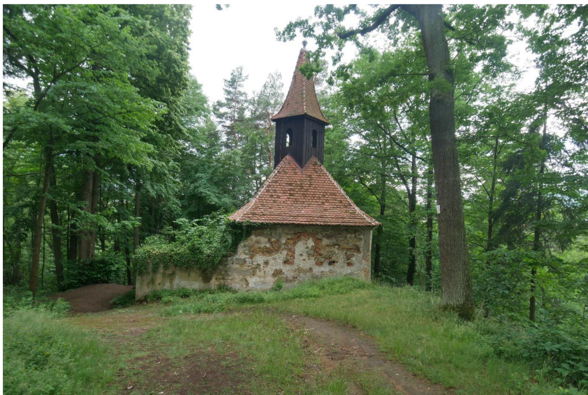
OBRÁZEK 8 - Kaple Nejsvětější Trojice.