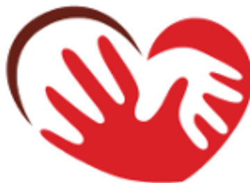
Obrázek č. 2: Logo Integrovaného centra sociálních služeb Jihlava, příspěvková organizace

služby pro seniory a osoby se zdravotním postižením, číselná klasifikace je 8810 (Český statistický úřad, 2023).