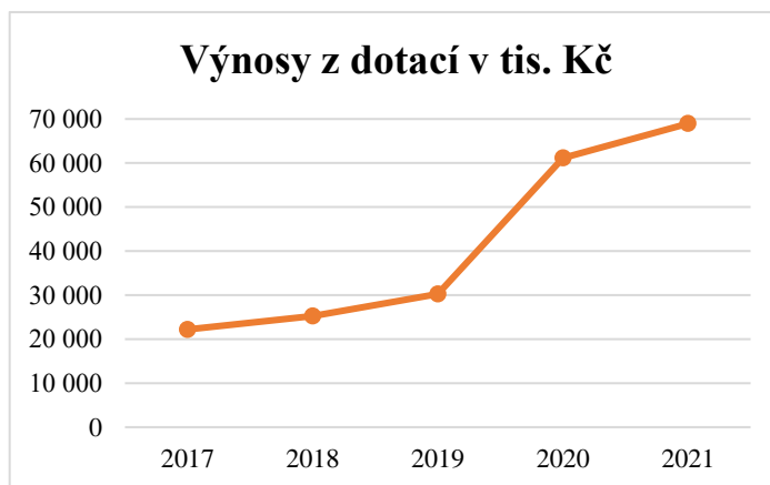
Graf č. 1: Výnosy z dotací v tis. Kč

Na vyúčtování organizace závisí dotace ze státního rozpočtu a z rozpočtu kraje. Bezesporu tyto dotace jsou využity na zaplacení části osobních nákladů. Příkladem jsou mzdové náklady, sociální a zdravotní pojištění. Dotace ze státního rozpočtu jsou poskytovány dvakrát ročně. Jednorázově je vyplacena dotace z rozpočtu kraje. Zřizovatel přiděluje dotace a příspěvky organizaci rovnoměrně celý rok. Dotacemi, kterými jsou peněžní prostředky, je pokryta část nákladů každý měsíc. Organizace ICSS zná předem hodnotu příspěvku a dotace od zřizovatele, který je dotuje celý rok. S touto výší organizace nakládá (Výroční zprávy, 2017-2021).