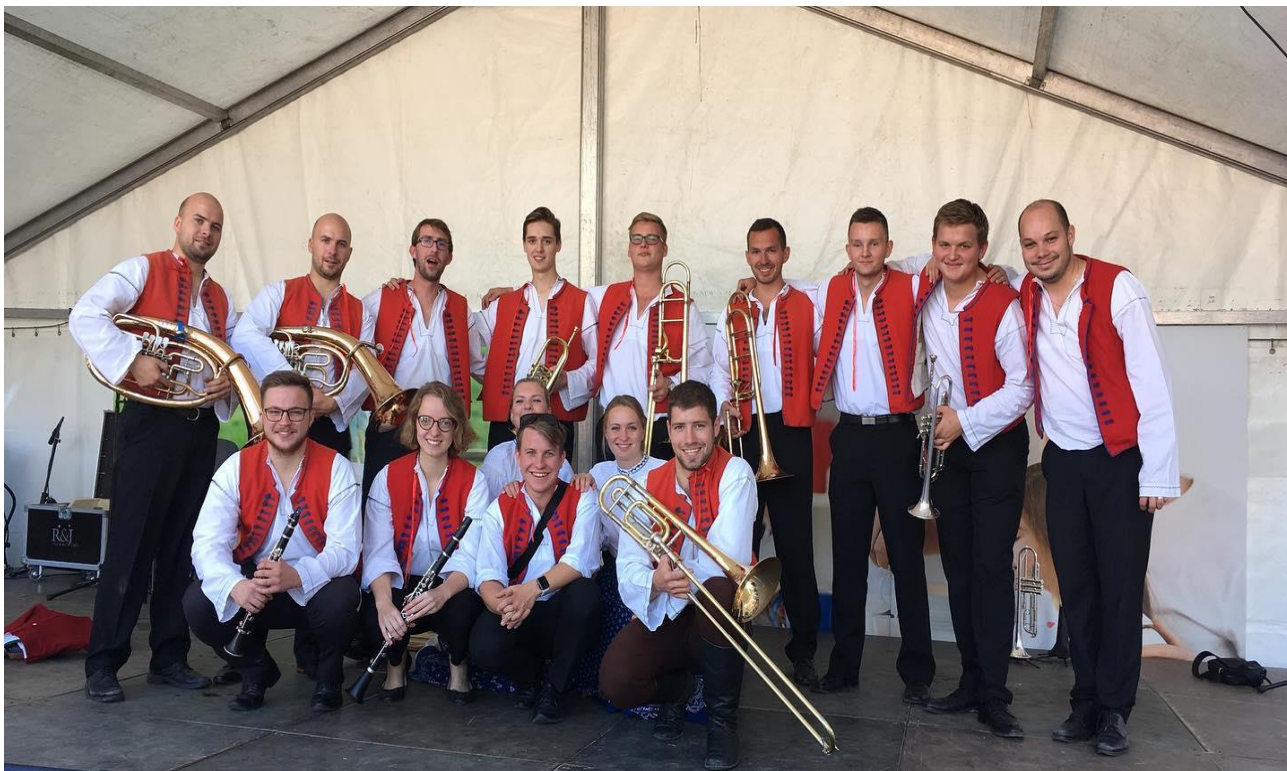
Příloha č. 36: