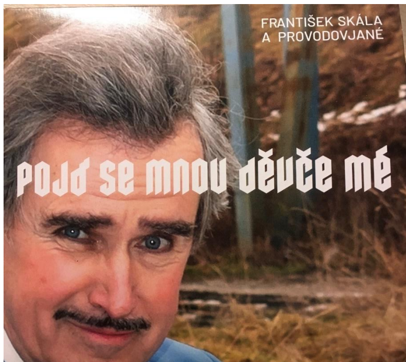
Příloha č. 26: