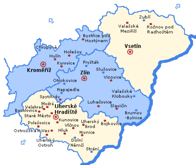
Obr. 1: Mapa Zlínského kraje. 71