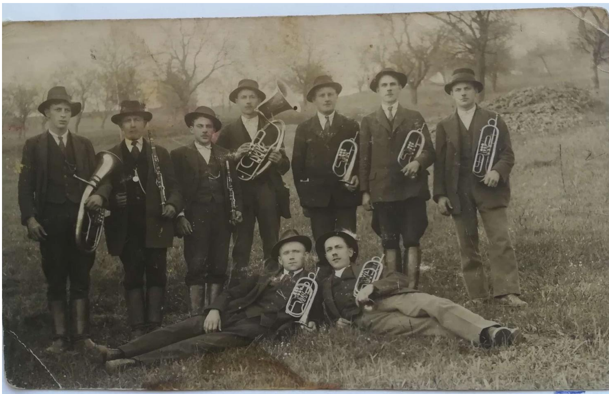
Příloha č. 18: