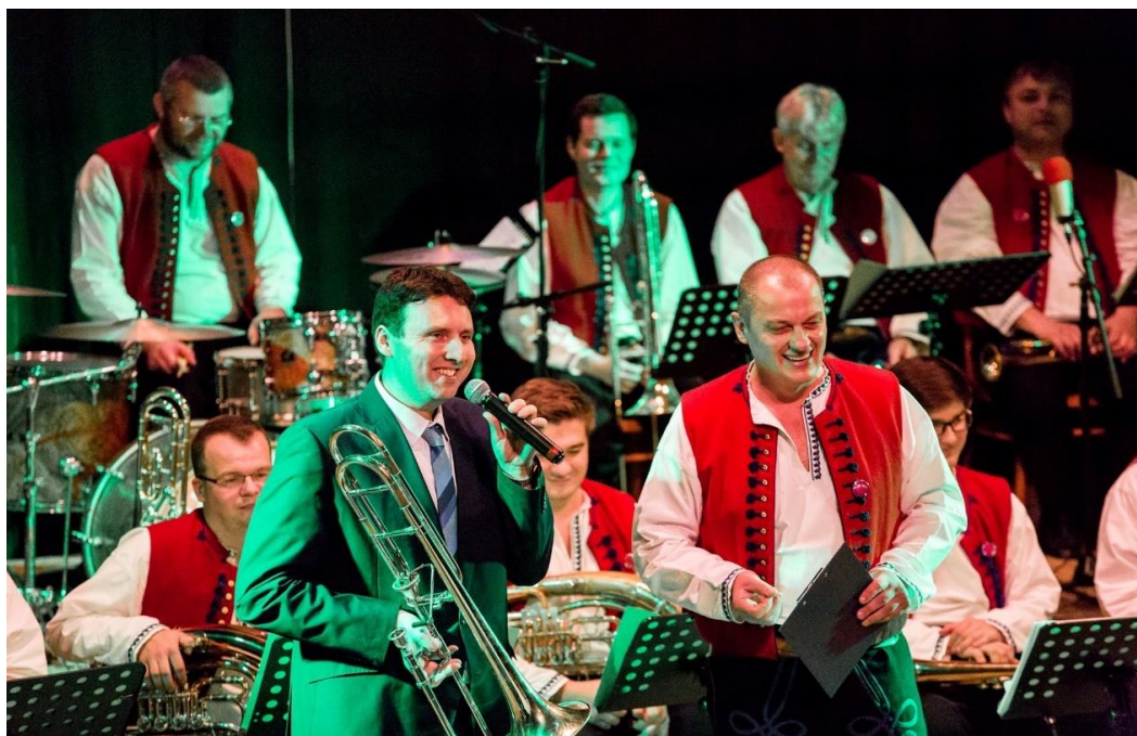
Příloha č. 30: