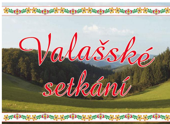
Příloha č. 8: