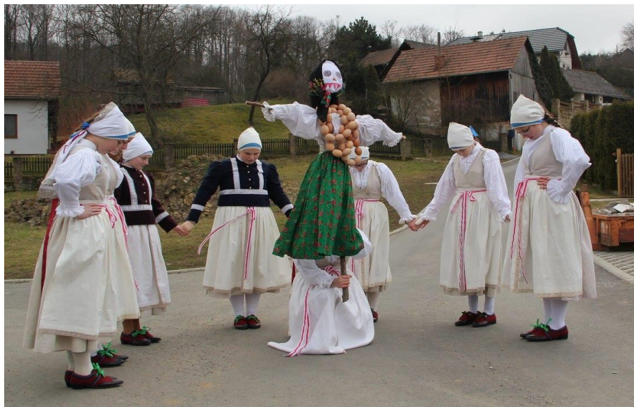
Příloha č. 16: