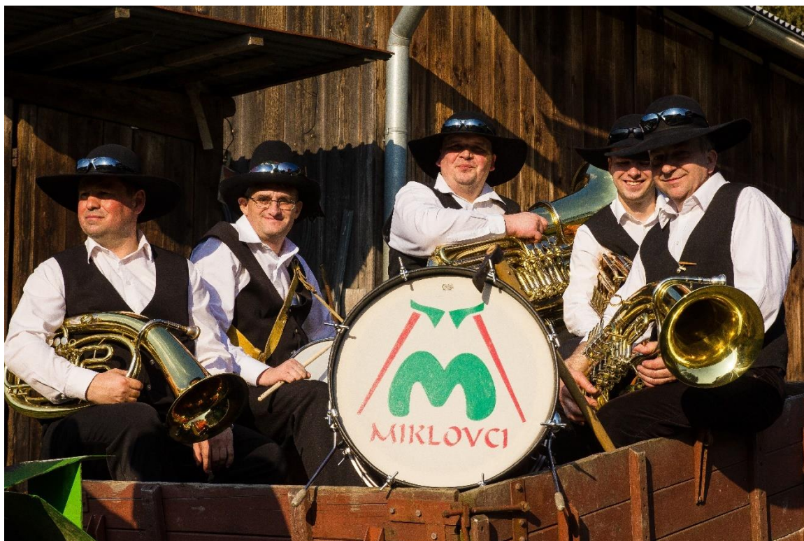
Příloha č. 34: