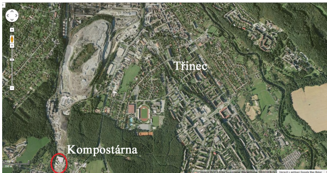
Obrázek 3.1: Kompostárna z leteckého pohledu 1

Pro praktickou část jsem si vybral společnost Nehlsen Třinec s.r.o. Sídlo společnosti se nachází v extravilánu jižní části města Třince.