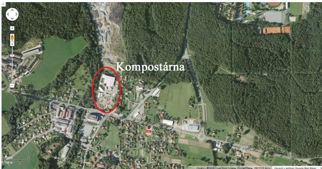
Obrázek 3.2: Kompostárna z leteckého pohledu 2