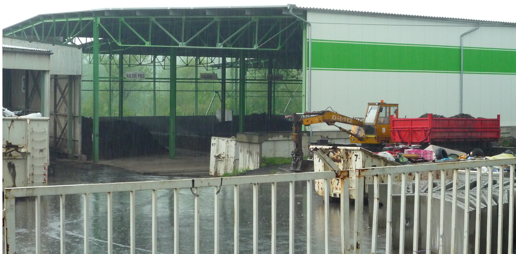
Obrázek 3.3: Hala kompostárny