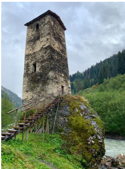
Obrázek 7: Svanská věž

třípatrovou budovu, v jejíž nejvyšším patře bylo místo pro ochranu (Kutatěladze, Gudžedžiani, 2015).