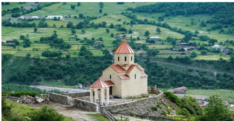
Obrázek 5: Kostel svatého George v Mestii