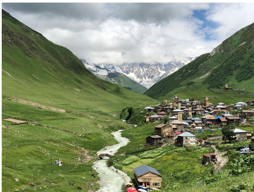
Obrázek 3: Vesnice Ušguli na úpatí hory Šchary

Právě v Mestii začínají četné turistické trasy. Hlavním cílem této cesty byla vesnice Ušguli. Ušguli je vysokohorská trvale osídlená vesnice, která se nachází v nadmořské výšce 2 200 metrů nad mořem, a je nejvýše položenou obývanou vesnicí v Evropě. Ušguli se považuje za nejnepřístupnější kout obydlené Svanetie. V Ušguli dnes žije kolem sedmdesáti rodin. Není příliš snadné dostat se z Mestie do Ušguli.