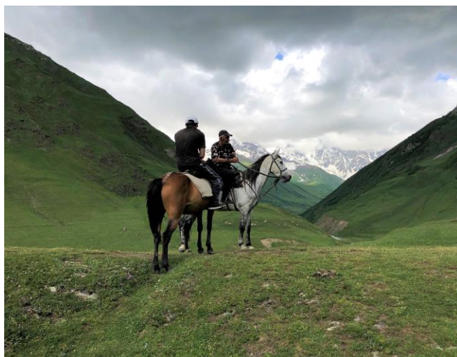
Obrázek 8: Koňská turistika v Ušguli

K jízdě na koni turisté nemusejí mít žádné speciální jezdecké zkušenosti. Horší koně rozumějí nejlepšímu způsobu cesty a jsou zvyklí na vyjížděky horami. Některé výlety jsou vhodné z Mestie, některé stezky pro koně se nacházejí v poměrně odlehlých vesnicích. Tyto trasy však lze kombinovat s pěší procházkou.