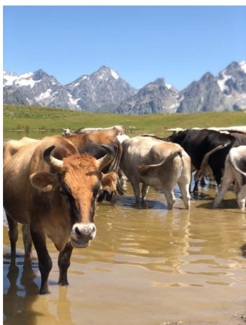
Obrázek 6: Hospodářství ve Svanetii