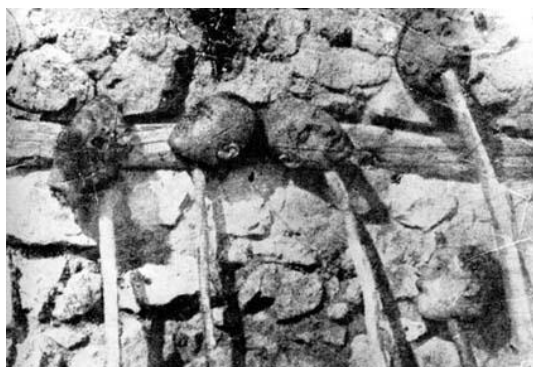
Useknuté hlavy Arménů, rok 1915