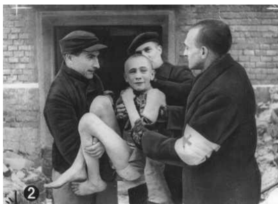
Zanedlouho po osvobození, ošetřovatelé vynášejí vyčerpané dítě z táborového baráku. Osvětim, Polsko, po 27. lednu roku 1945