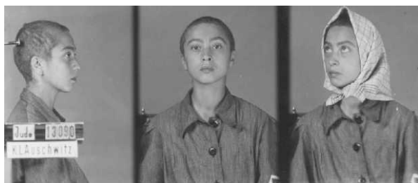
Fotografie z osobního spisu ženy, Osvětim, polsko, mezi léty 1942-1945