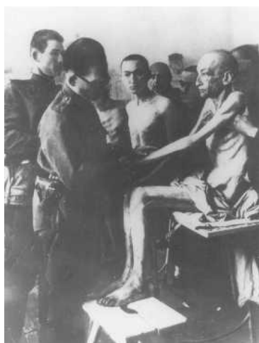
Zanedlouho po osvobození Osvětimi: lékař prohlíží zachráněné zajatce koncentračního tábora. Polsko, 18. ledna roku 1945