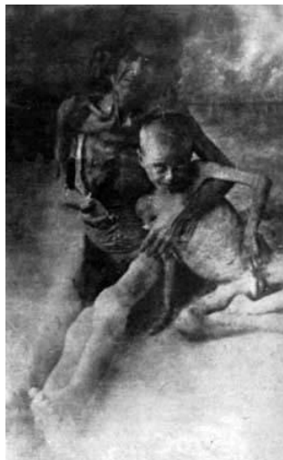
Hladová Arménka se svým synem, Syrská poušť, rok 1916