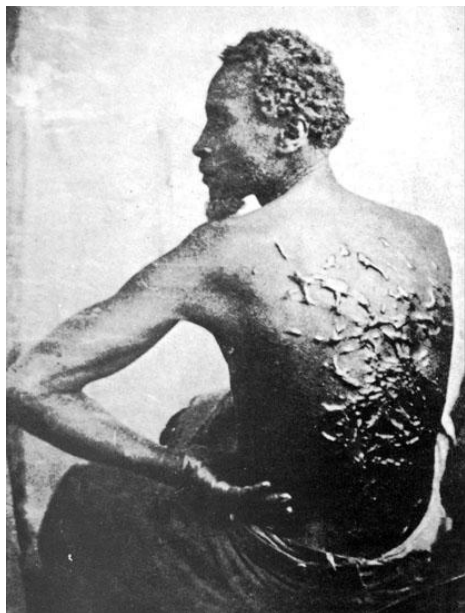
Afroamerický otrok po vysekání, USA