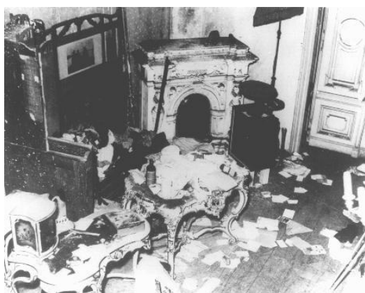
Osobní židovský dům, který byl barbary zničen, Vídeň, Rakouskou, rok 1938