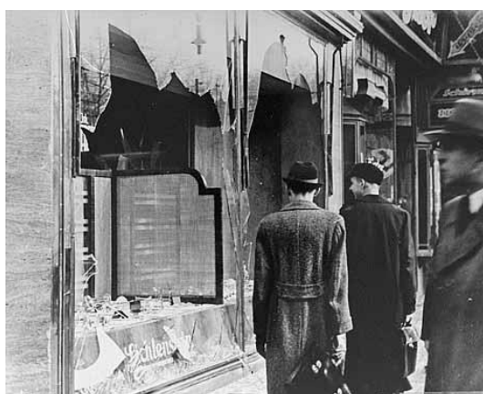
Obchod, který patřil Židům, Berlín, Německo, rok 1938