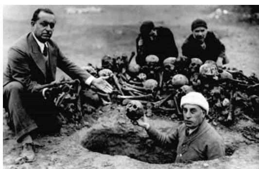
Skupina lidí vytahuje ze země pozůstatky arménských obětí, Deir-Zor, rok 1938