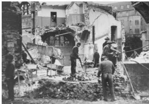
Synagoga v Dortmundu během „Křišťálové noci“, Německo, rok 1938