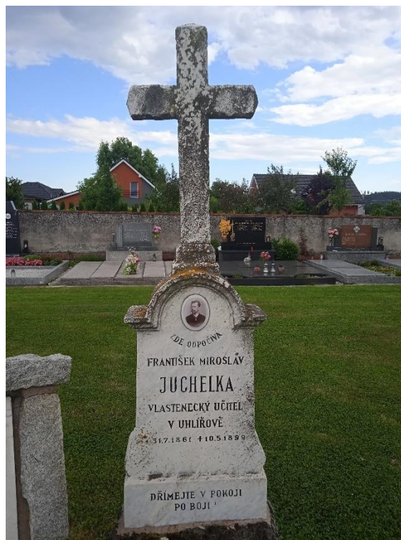
Obrázek č. 7: Detail hrobu 343