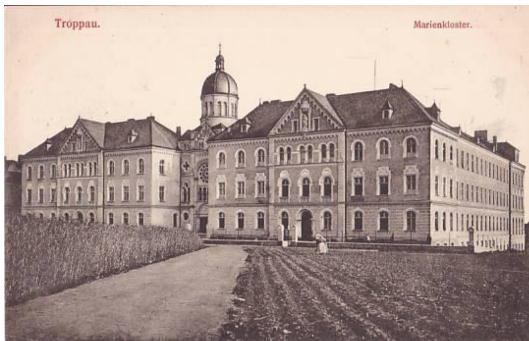
Obrázek č. 2: Pohlednice Troppau. Marienkloster (cca 1938) 338