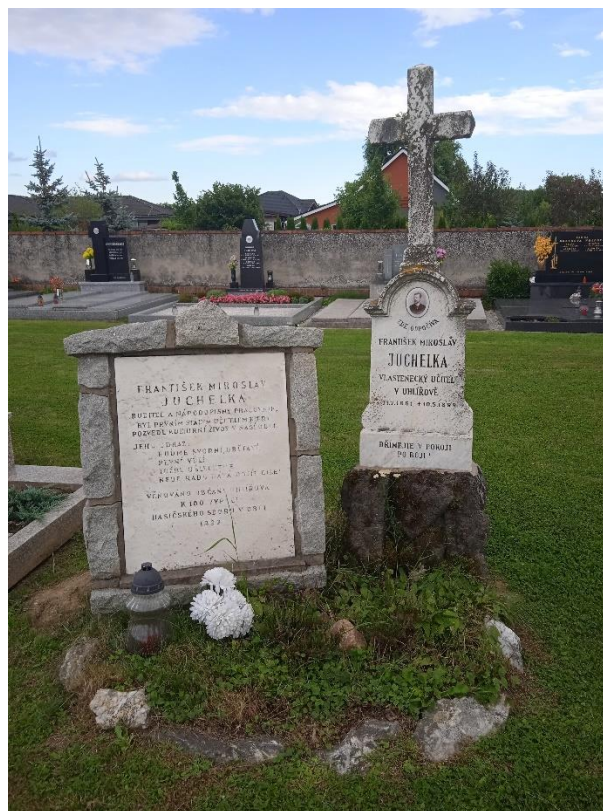
Obrázek č. 6: Hrob Františka Miroslava Juchelky v Uhlířově 342