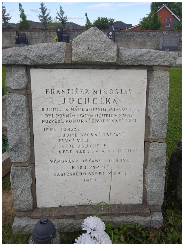
Obrázek č. 8: Detail pamětní desky 344