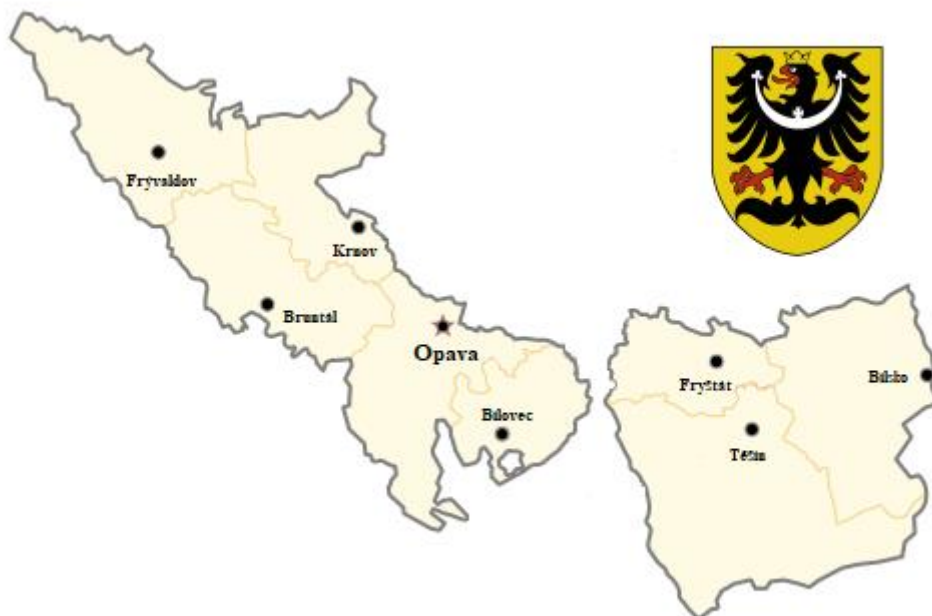
Mapa č. 2: Soudní okresy politického okresu Opava mezi lety 1868-1896