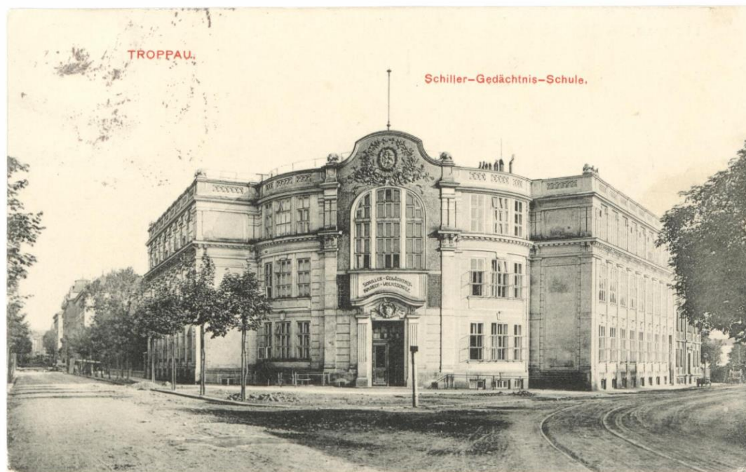
Obrázek č. 4: Pohlednice Troppau. Schiller-Gedächtnis-Schule (1911) 340